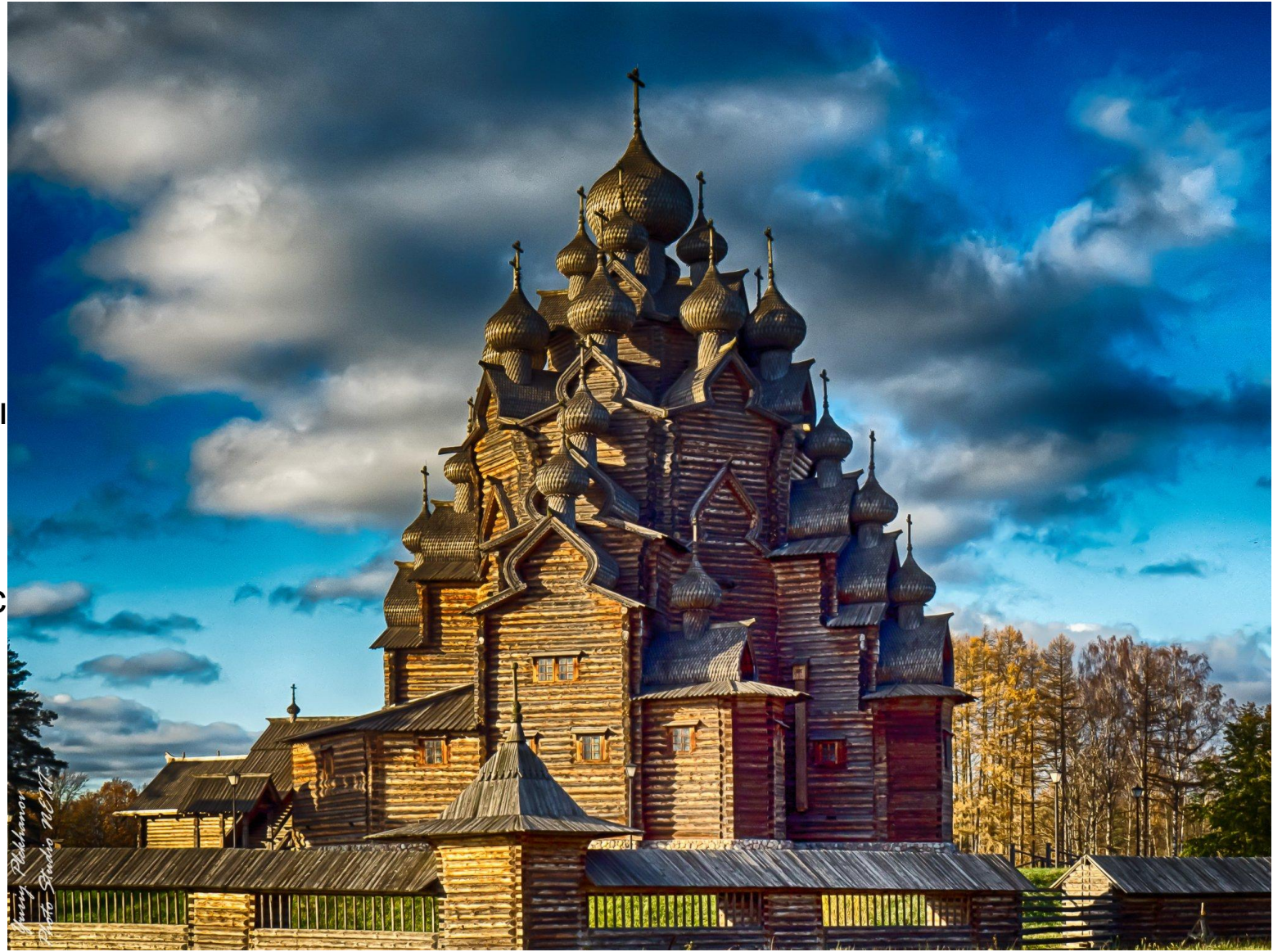
Храм Преображения Господня на острове Киж