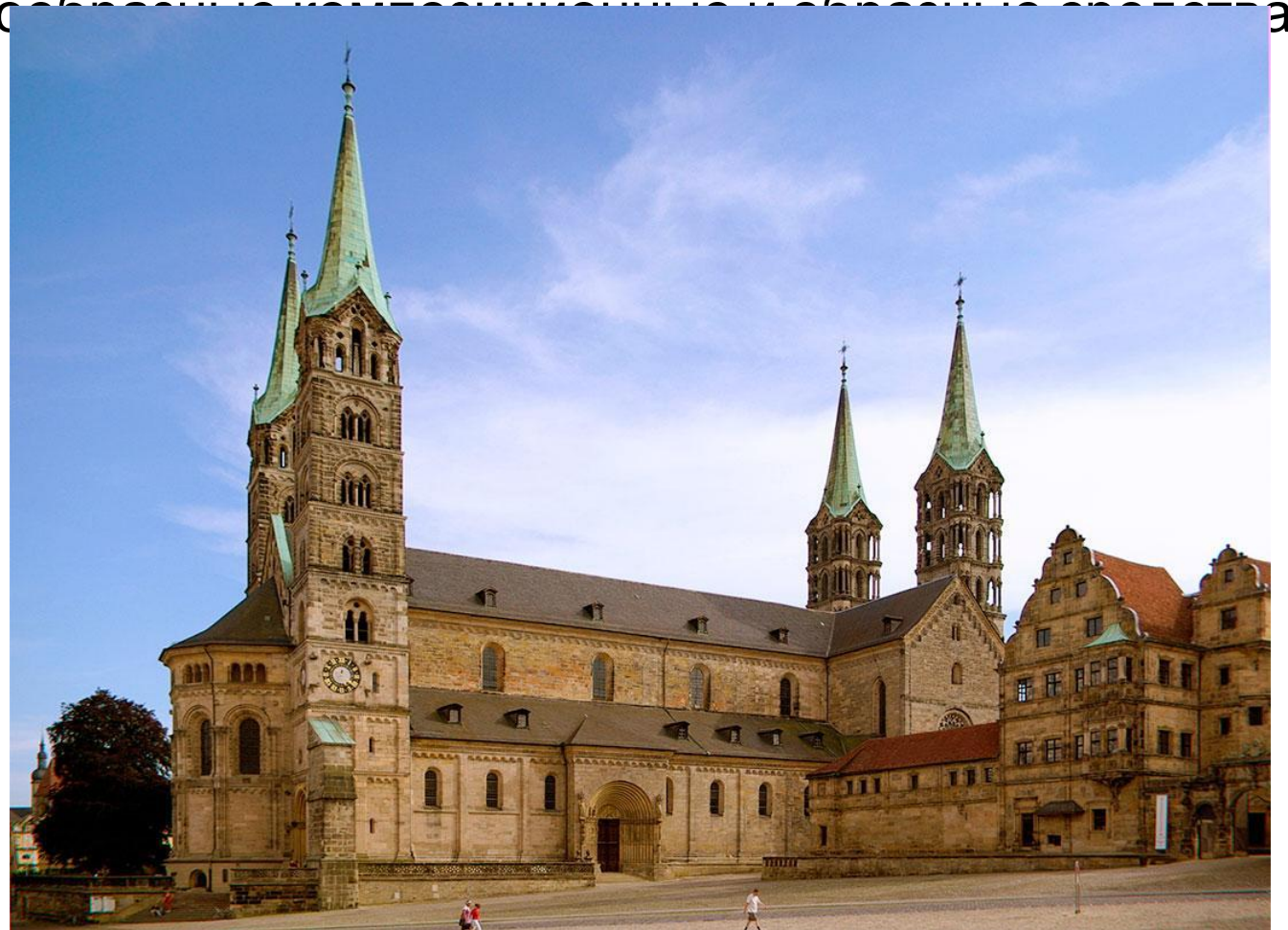
Бамбергский собор, Германия

задачи, для чего применяются разнообразные конструктивные и художественные средства.