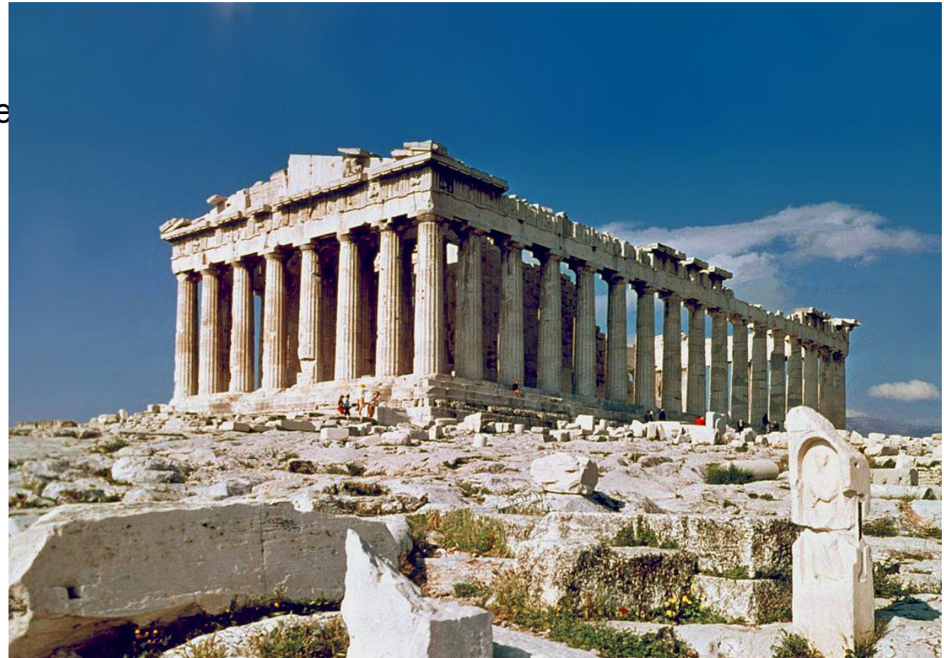
Древний храм в Афинах