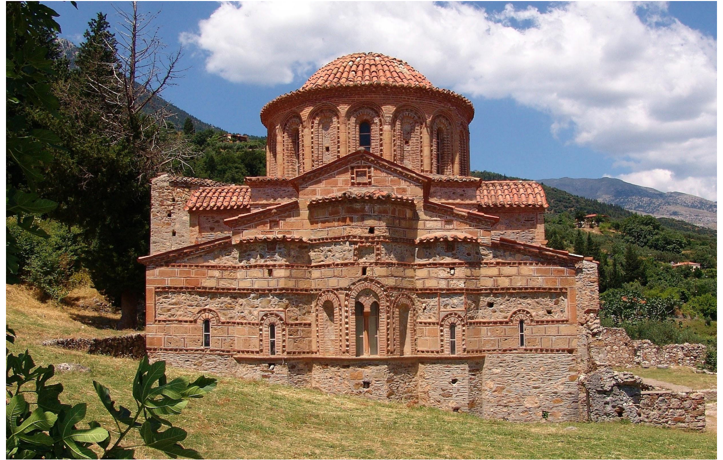
Древний Византийский храм