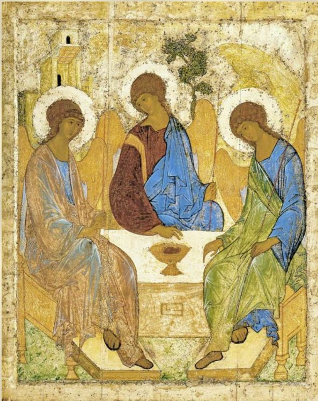
Икона «Троица». 15 век, прп. Андрей Рублев.