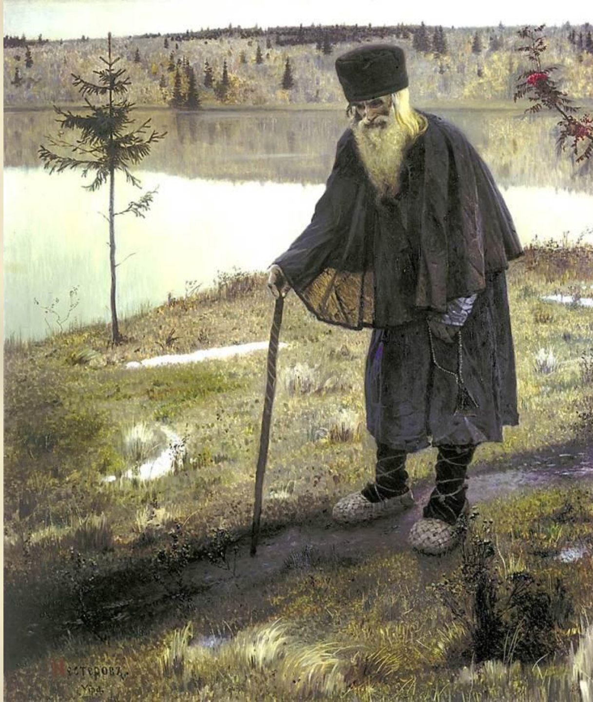
Нестеров М. В. Пустынник.