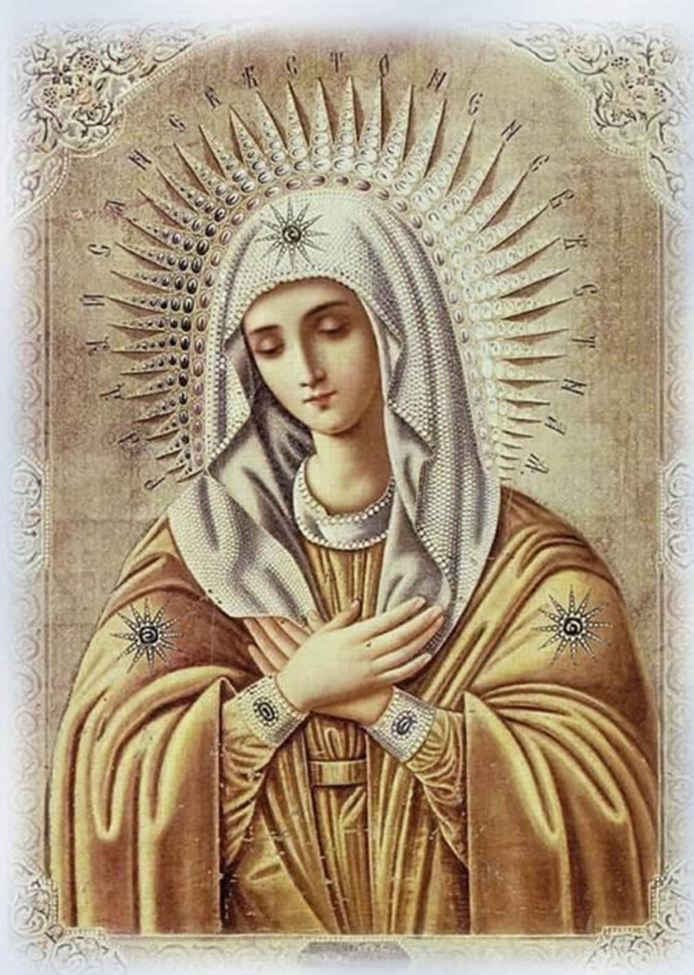
Икона Пресвятой Богородицы «Умиление»