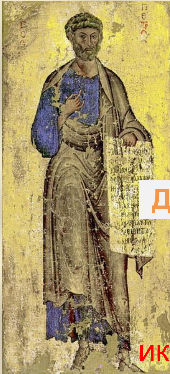
Икона святого апостола Петра. 12 век. Афон