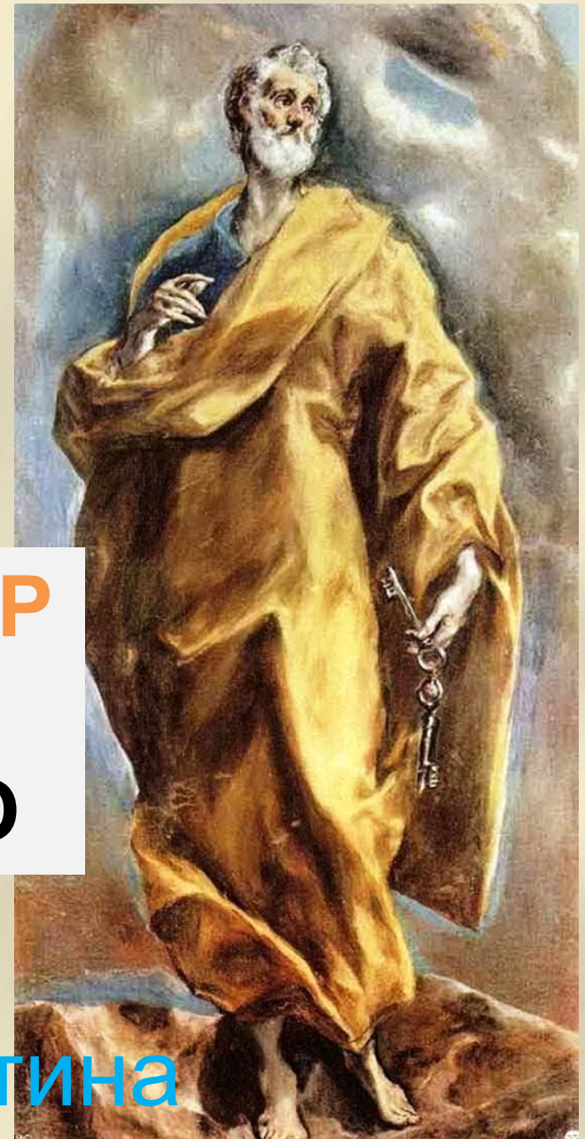
Апостол Петр. Эль Греко.