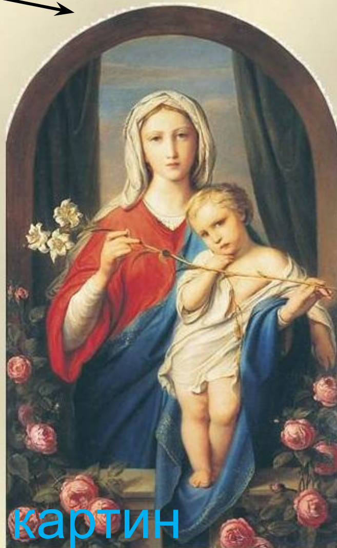
Икона Пресвятой Богородицы «Одигитрия», 15 век