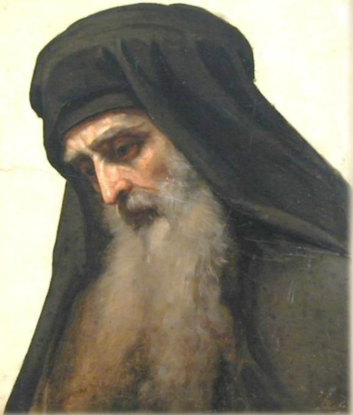
Крамской И.Н. Голова монаха.