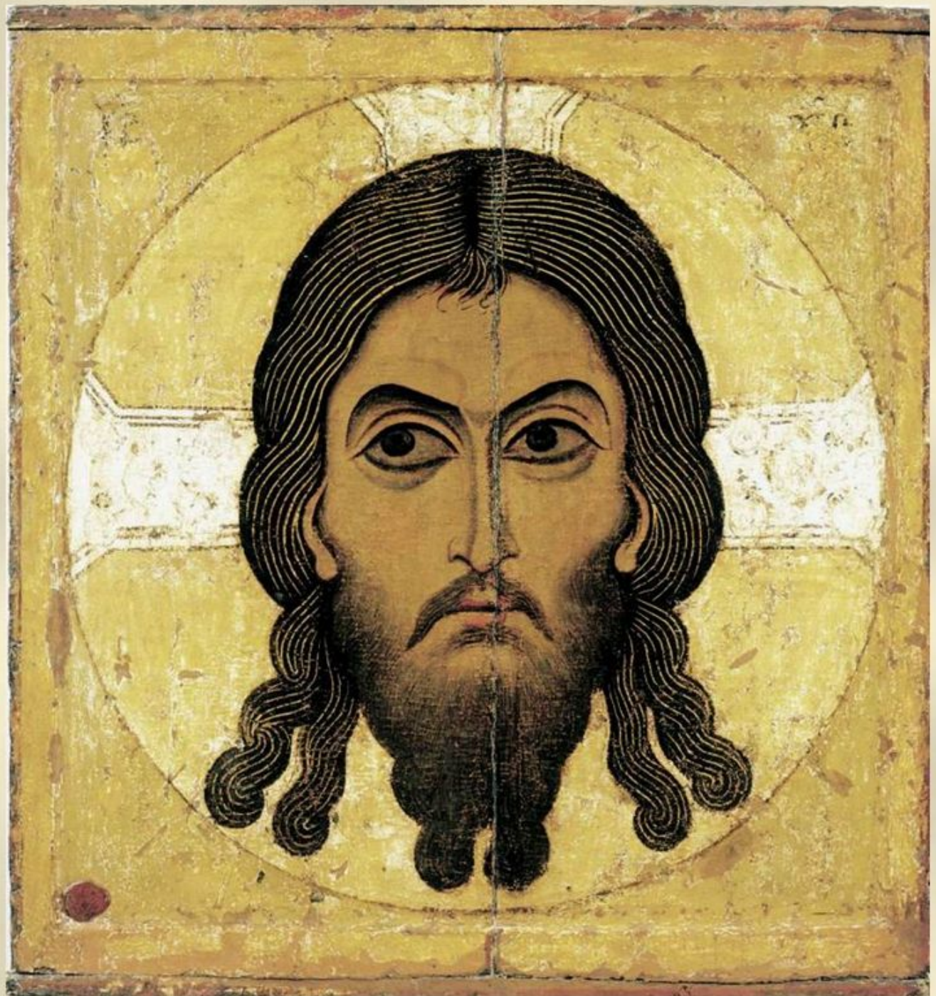
Икона «Нерукотворный Спас». 12 век.