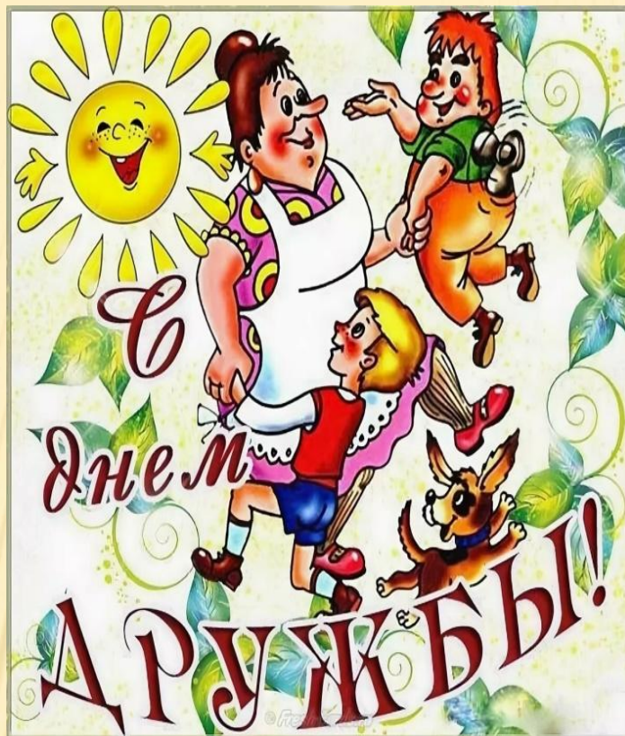
Карсон и его друзья