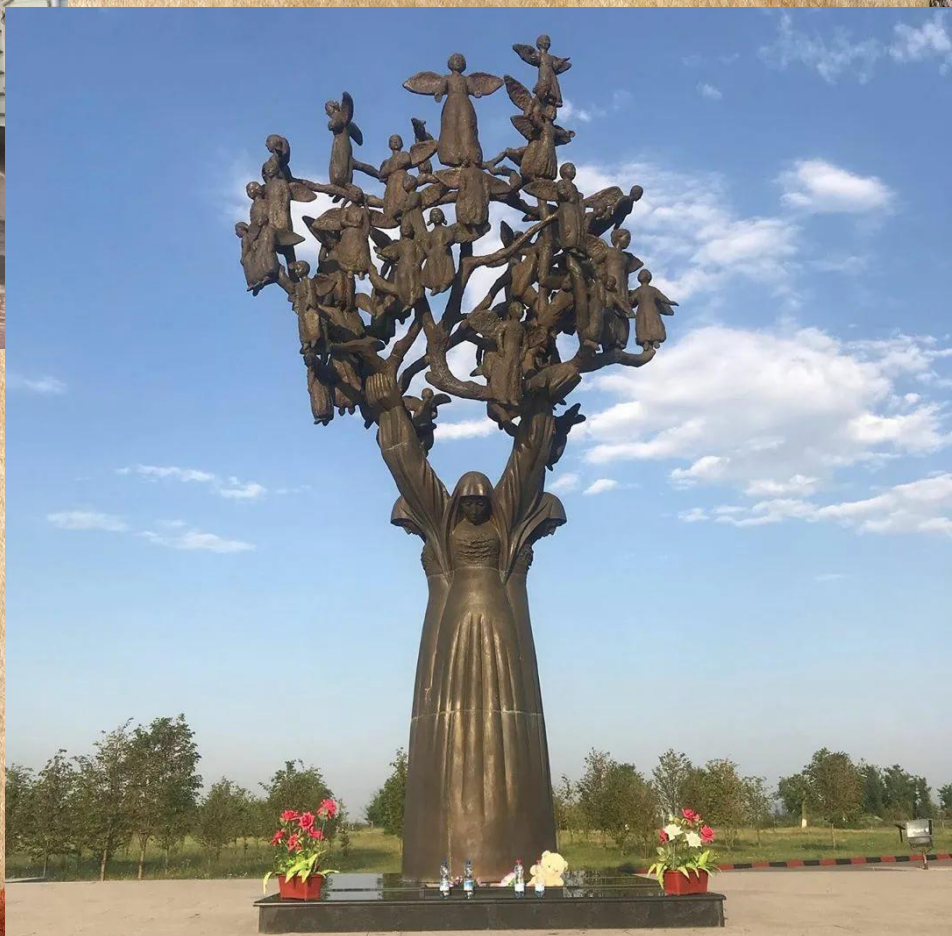
Памятник жертвам Беслана в Москве