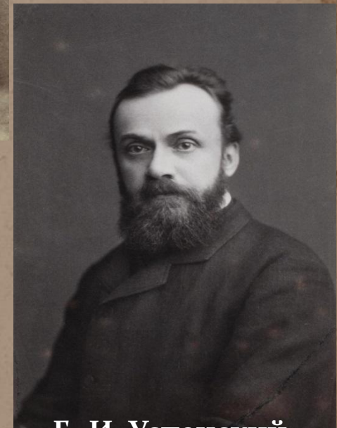
Г. И. Успенский