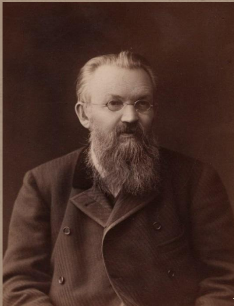
А. С. Суворин