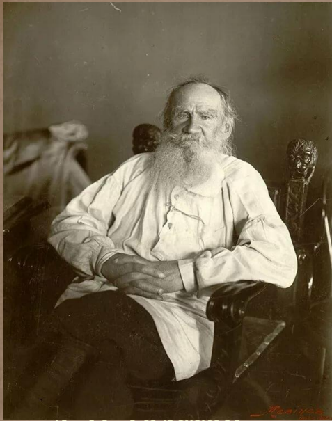
Л. Н. Толстой