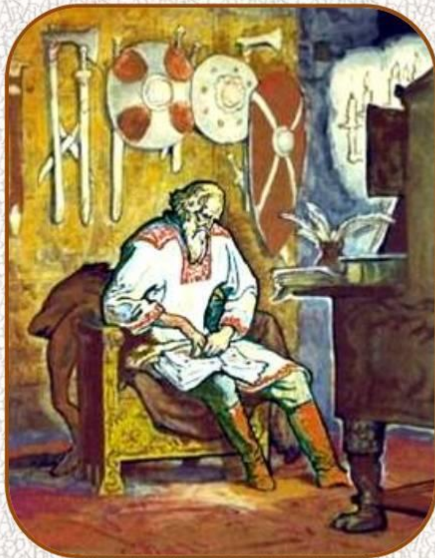
Великий князь Владимир Мономах.

Владимир Мономах оставил замечательное произведение: «Поучение чадам своим». Текст «Поучения» обнаружен в Лаврентьевской летописи (1377 г.). В каком году Владимир писал свое «Поучение», точно неизвестно. Может быть, вскоре после съезда князей в Любече? И поэтому так горячо призывает князь русских людей к единству и бескорыстному служению Родине.