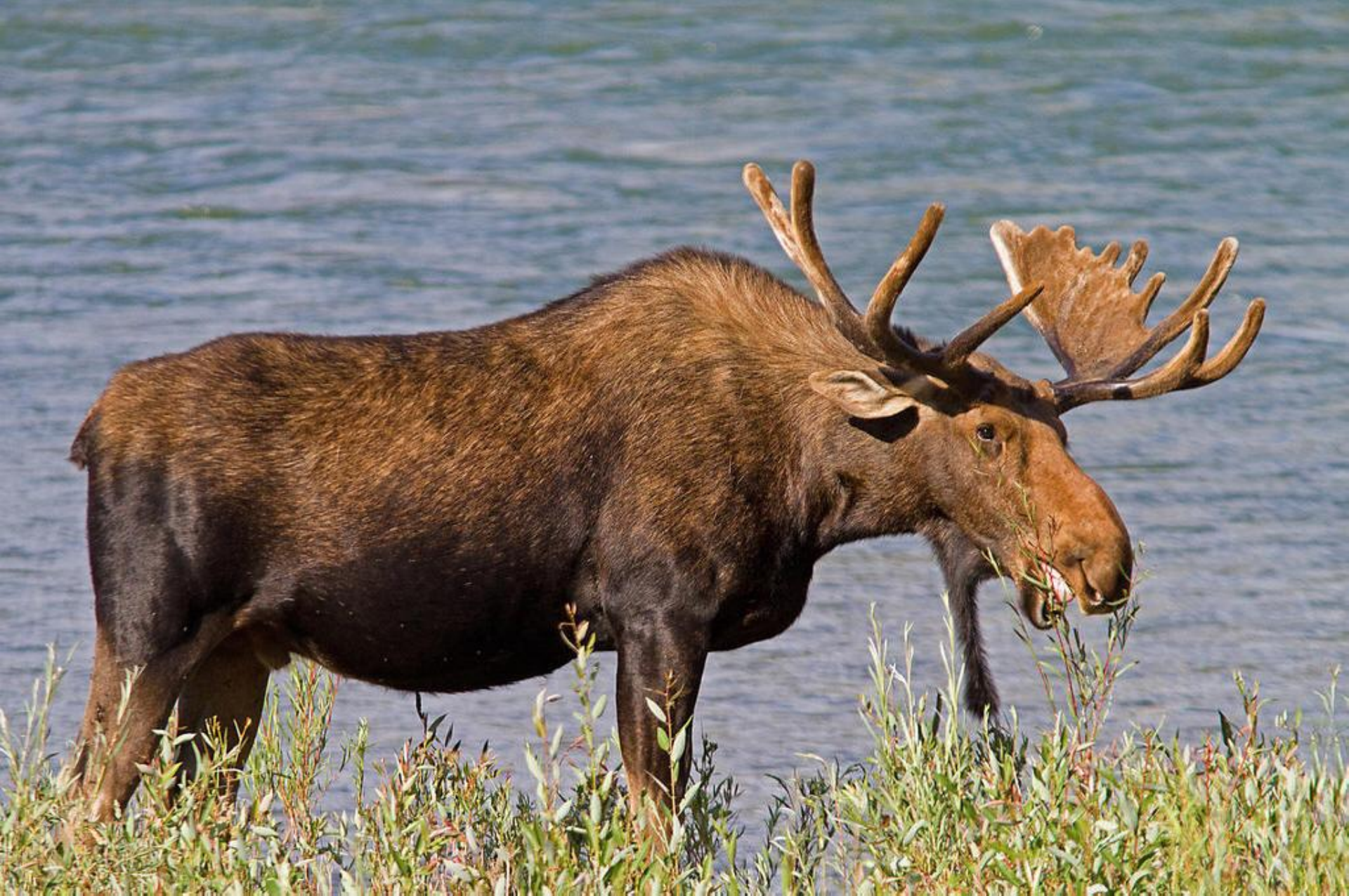
Бродит по тайге лось-великан.