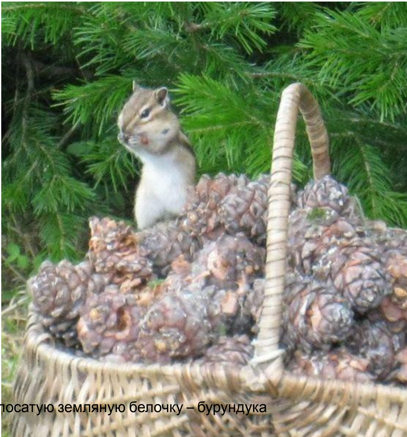
полосатую земляную белочку – бурундука