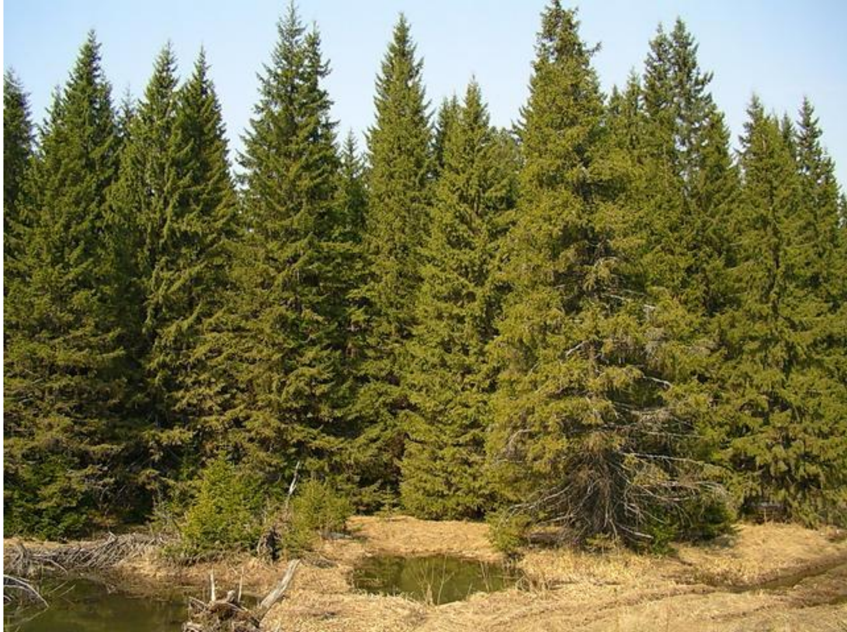
Тайга – хвойный лес. Здесь растут ели.