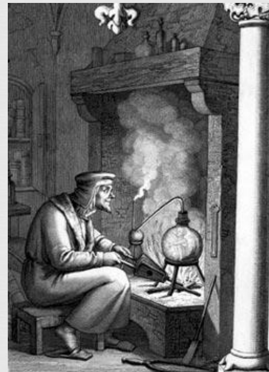
Гравюра, изображающая алхимика

Человек может использовать их для достижения своих целей