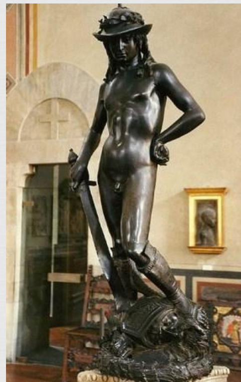
Донателло. Давид, 1430