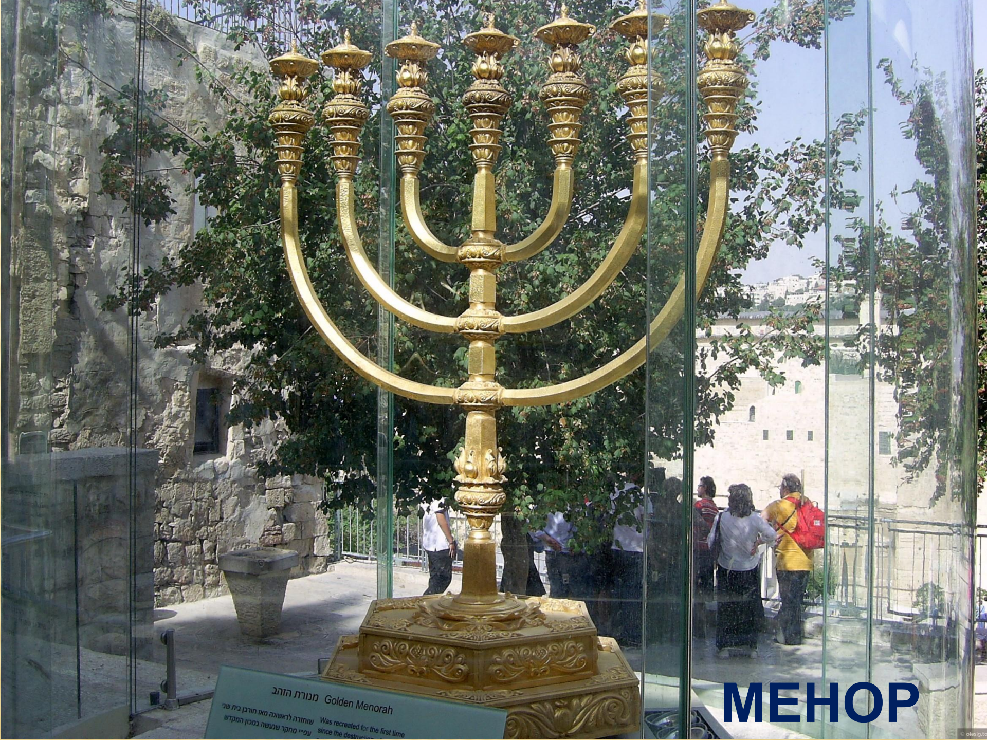
מנורת הזהב Golden Menorah שוחזרה לראשונה מאז חורבן בית שני עמ"י מחקר שנעשה במקוון המקדש Was recreated for the first time since the destruction