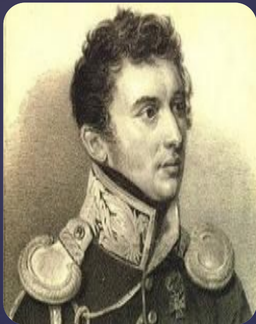
Н. М. Муравьев