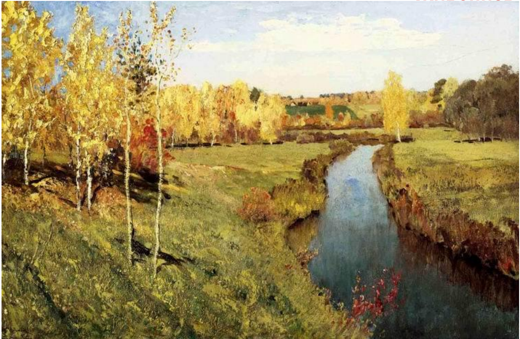
Исаак Ильич Левитан «Золотая осень»