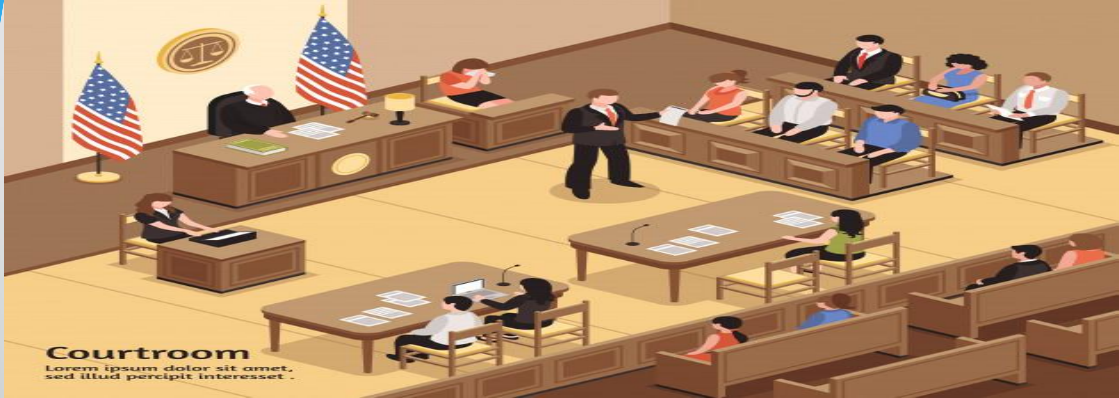
Courtroom Lorem ipsum dolor sit amet, sed illud percipit interesset .