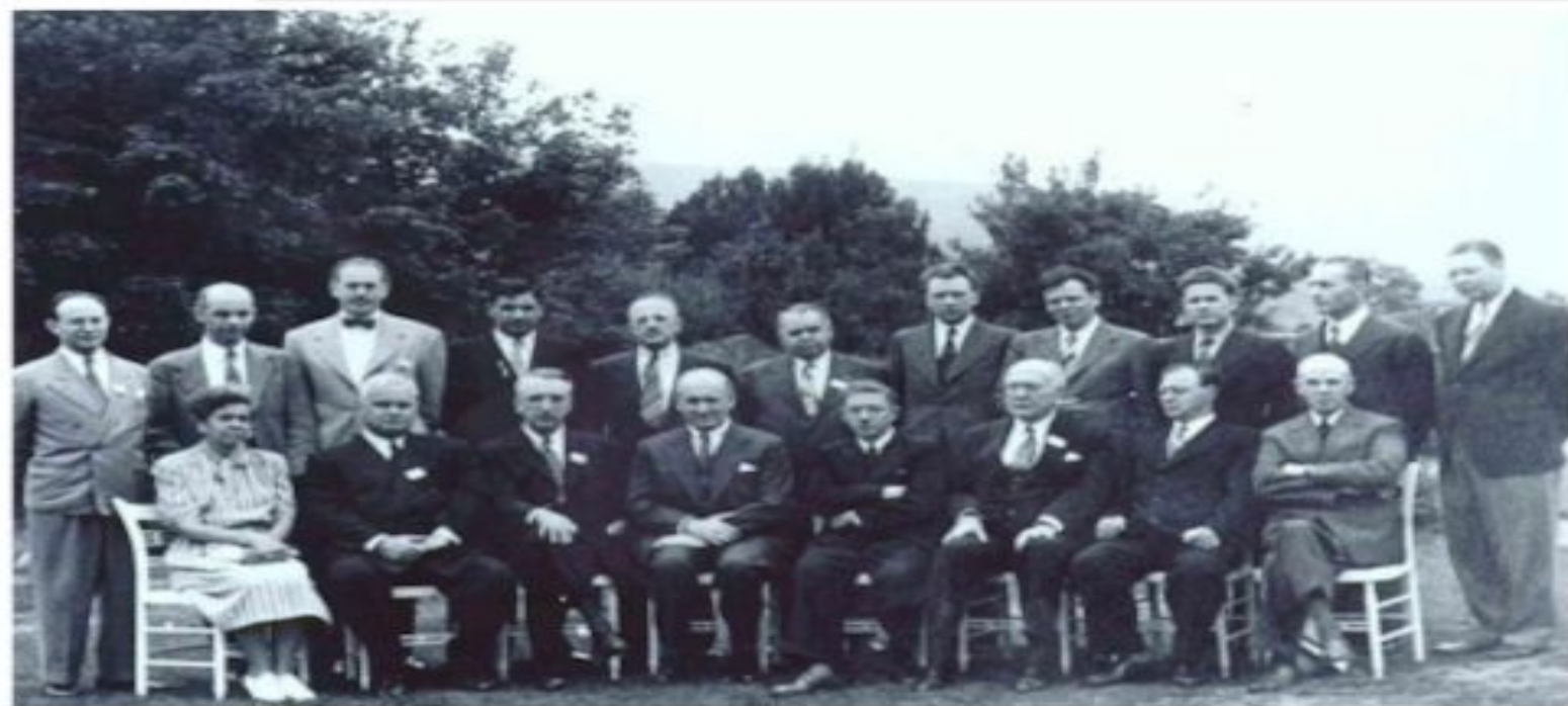
Участники делегаций СССР и США На конференции в Брестон-Вудсоне 1944 г.

В 1944 году в Брестон-Вудсе (США) на конференции ООН представители 44 стран приняли решения: установить фиксированное золотое содержание доллара; был создан МВФ (международный валютный фонд) и МБРР (Международный банк реконструкции и развития)