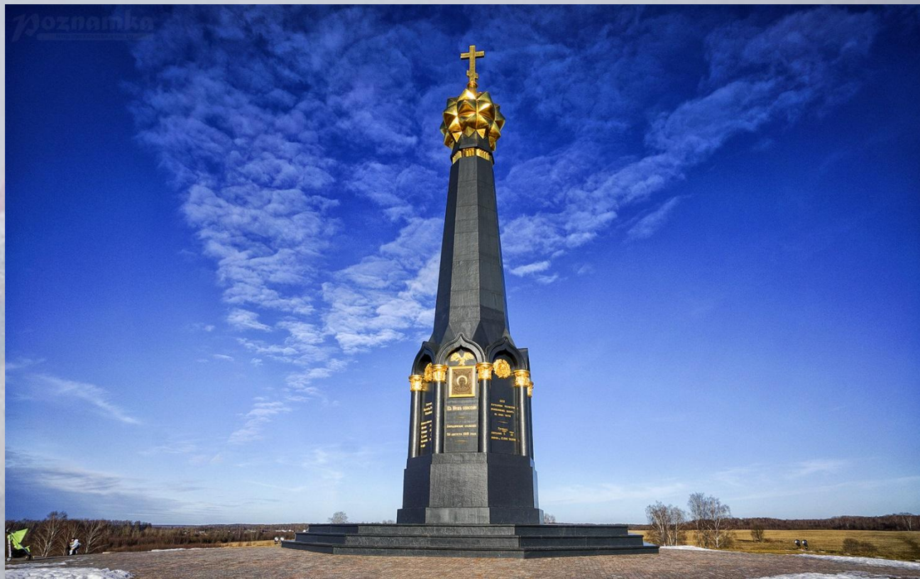
Главный памятник русским воинам на Бородинском поле

Сегодня — 8 сентября является днем Воинской славы в память о тех, кто своей жизнью рискуя и не щадя головы своей спас Отечество в день Бородинского сражения в 1812 году.