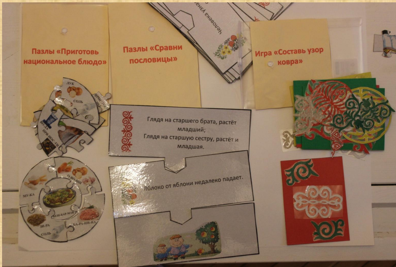
Пазлы «Приготовь национальное блюдо», пазлы «Собери пословицы» - картинки из киргизской и русской пословицы, игра «Составь узор ковра»