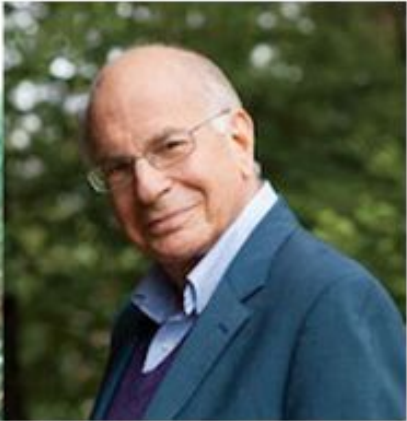
Амос Тверски (1937-1996) Даниэль Каннеман (1934-), авторы «Суждения в условиях неопределенности» (1982)