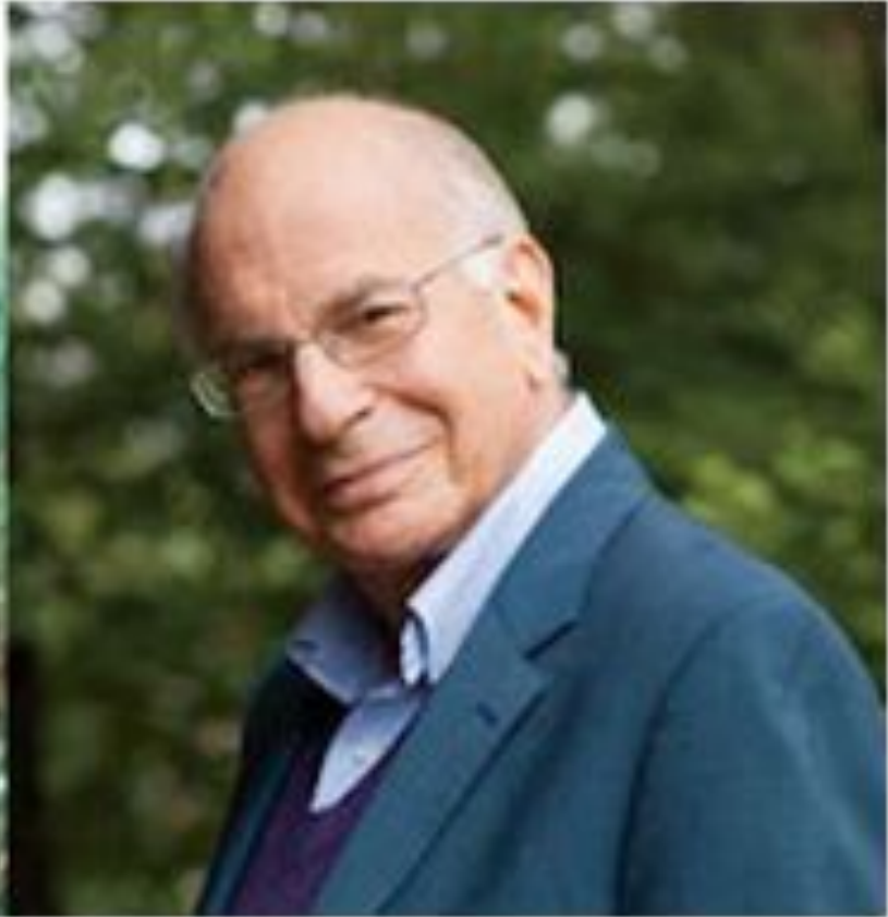
Амос Тверски (1937-1996) Даниэль Каннеман (1934-), авторы «Суждения в условиях неопределенности» (1982)