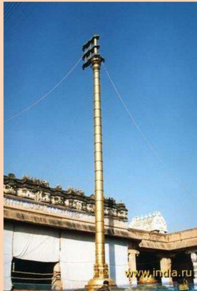
Алтын стамбха ( 500 кг алтын)