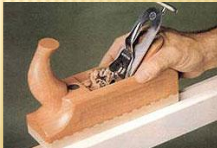
Рубанок с деревянной колодкой