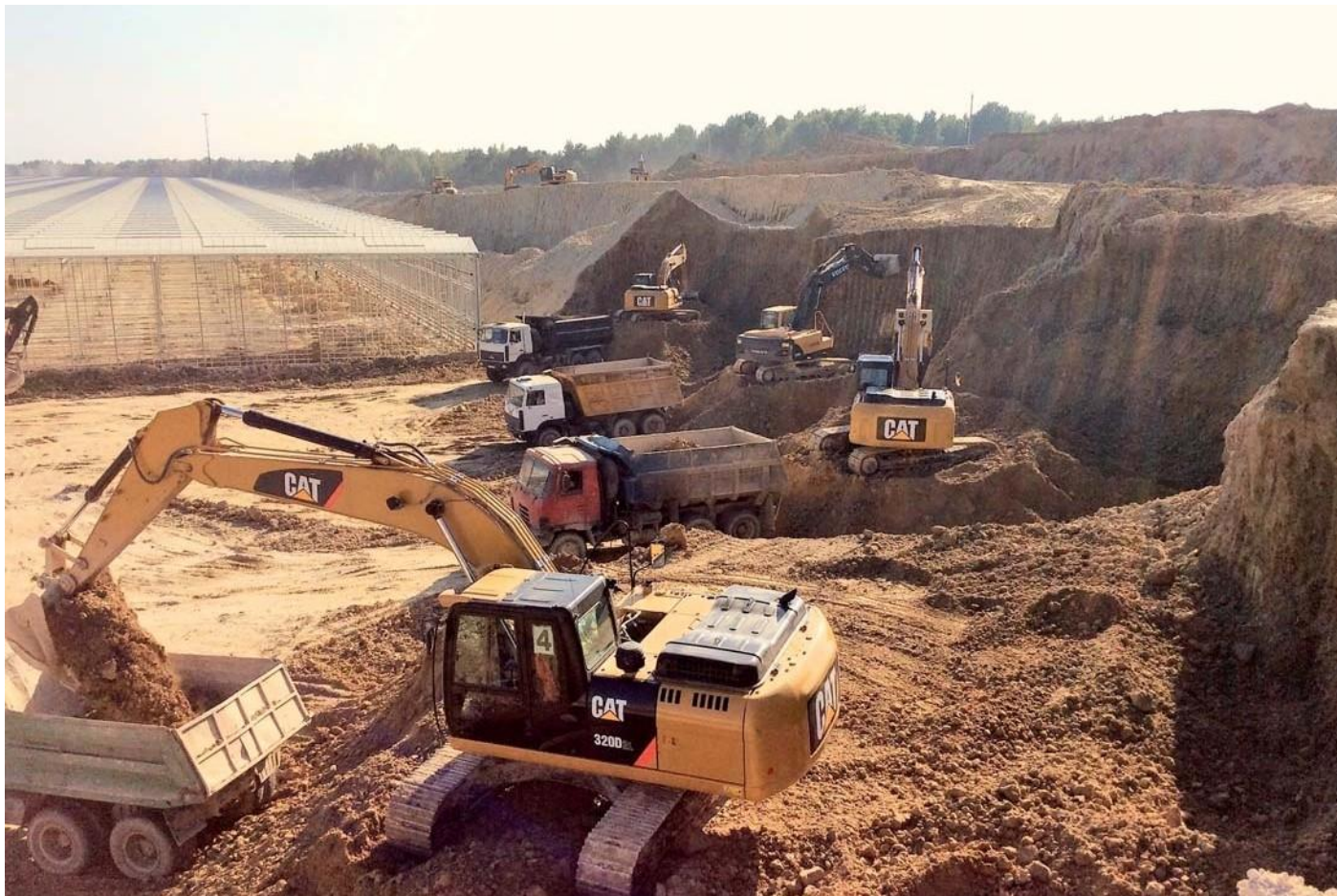
Тепличный комплекс. Калужская область, Людиновский район, деревня Войлово