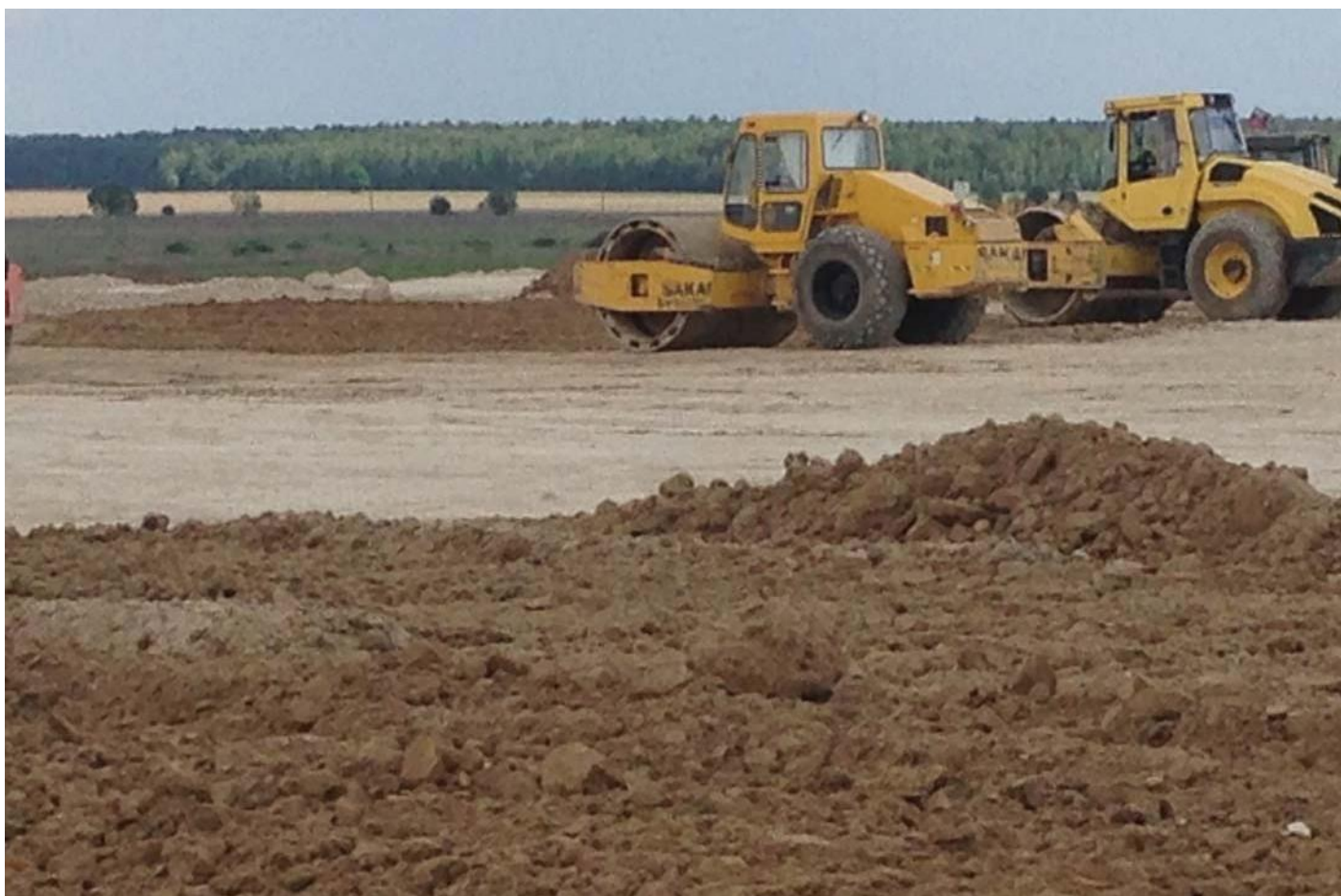
Этап строительства АДМ "МЯЧКОВО" гоночной трассы.