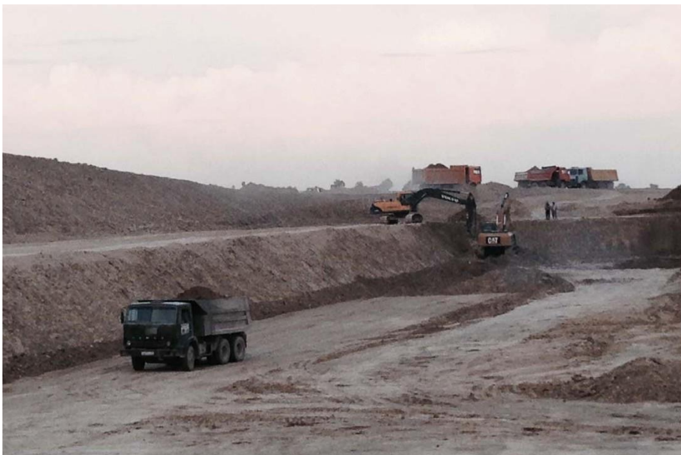
Тепличный комплекс. Калужская область, Людиновский район, деревня Войлово.