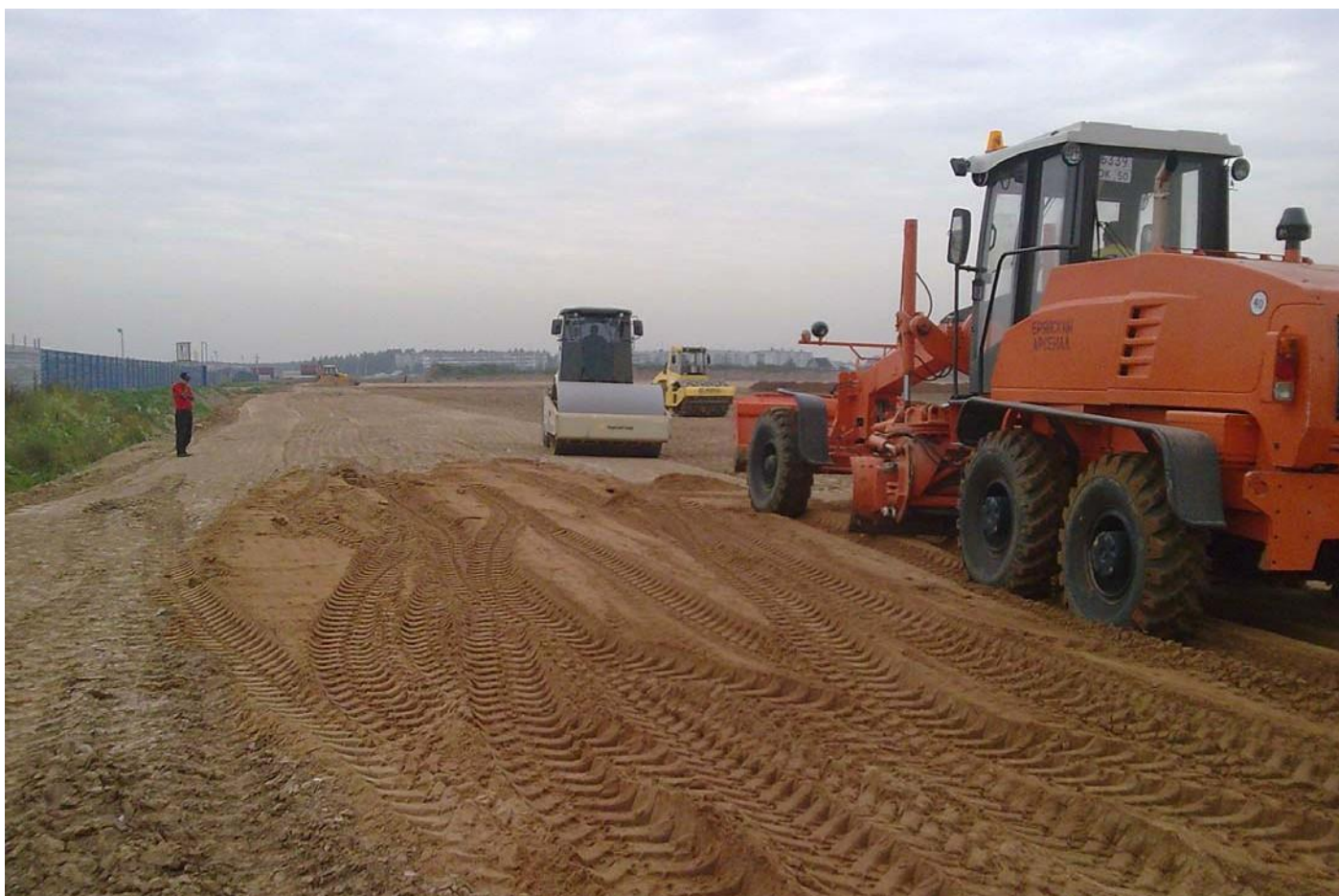
Автологистика Московская обл. Солнечногорский район д. Пикино