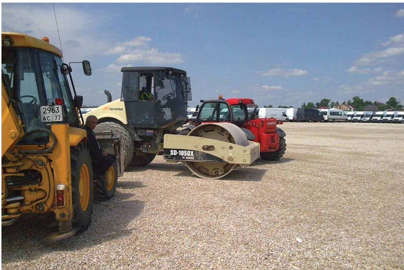
Автологистика Московская обл. Солнечногорский район д. Пикино