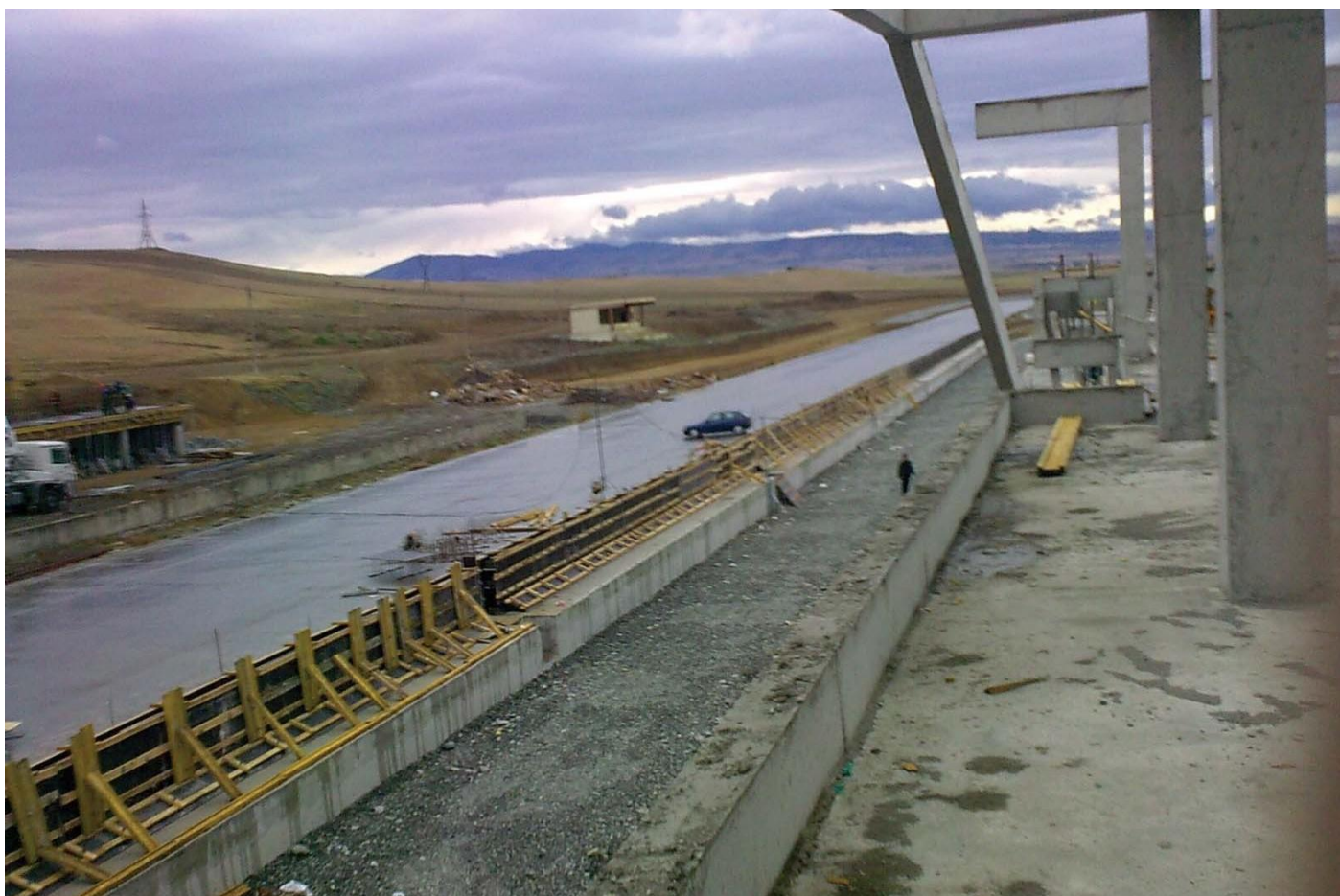
Этап строительства гоночной трассы "РУСТАВИ" в республике Грузии.