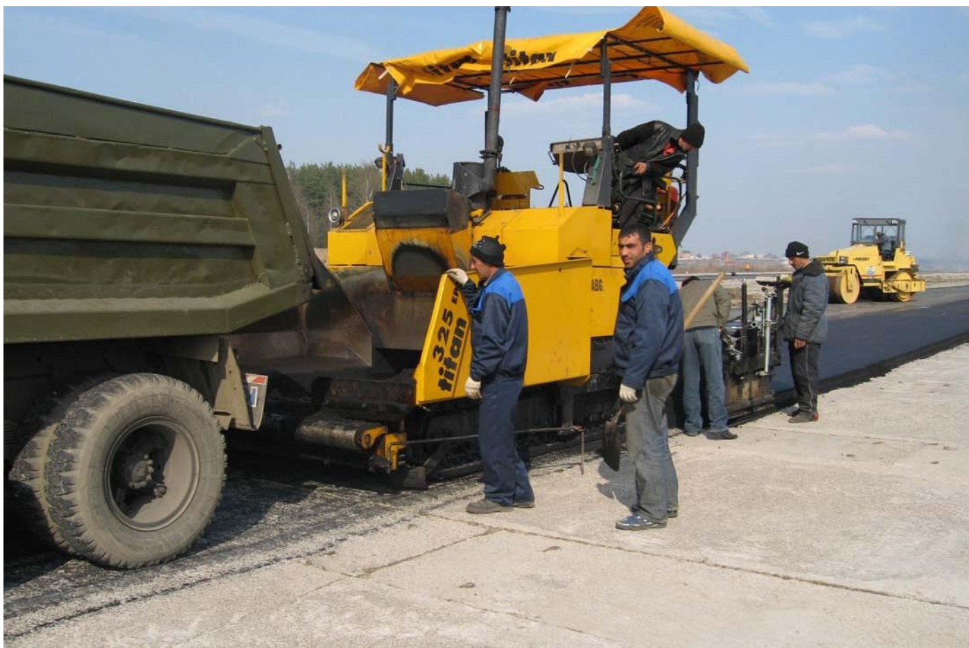
Этап строительства АДМ "МЯЧКОВО" гоночной трассы.