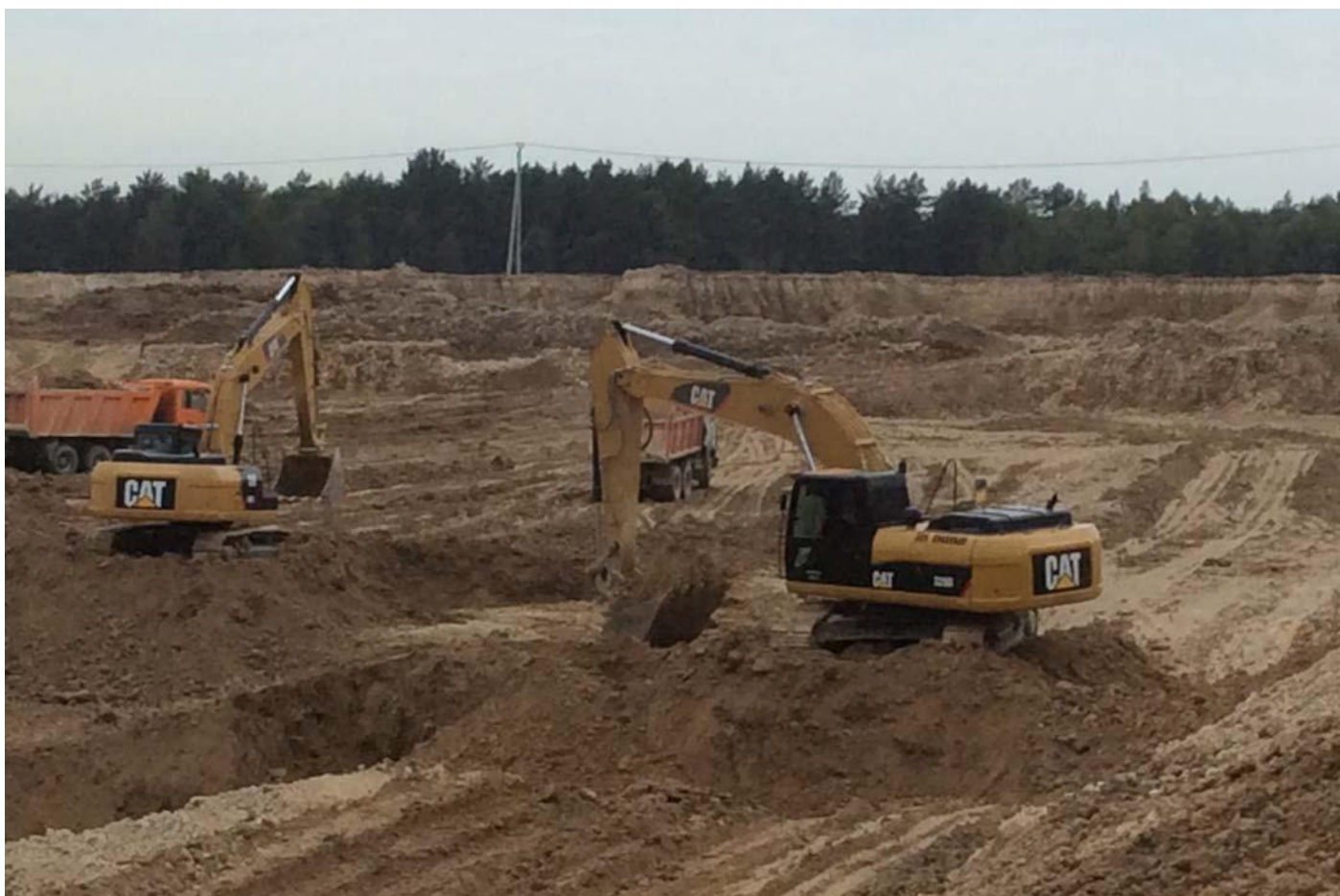
Тепличный комплекс. Калужская область, Людиновский район, деревня Войлово.