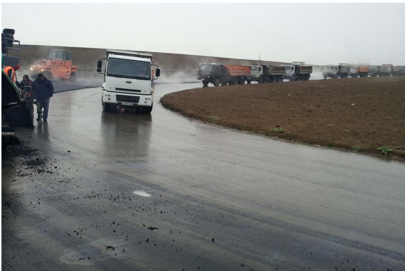
Этап строительства гоночной трассы "РУСТАВИ" в республике Грузии.