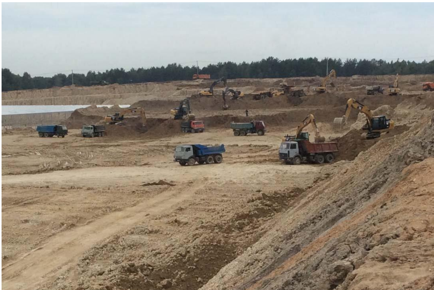
Тепличный комплекс. Калужская область, Людиновский район, деревня Войлово.