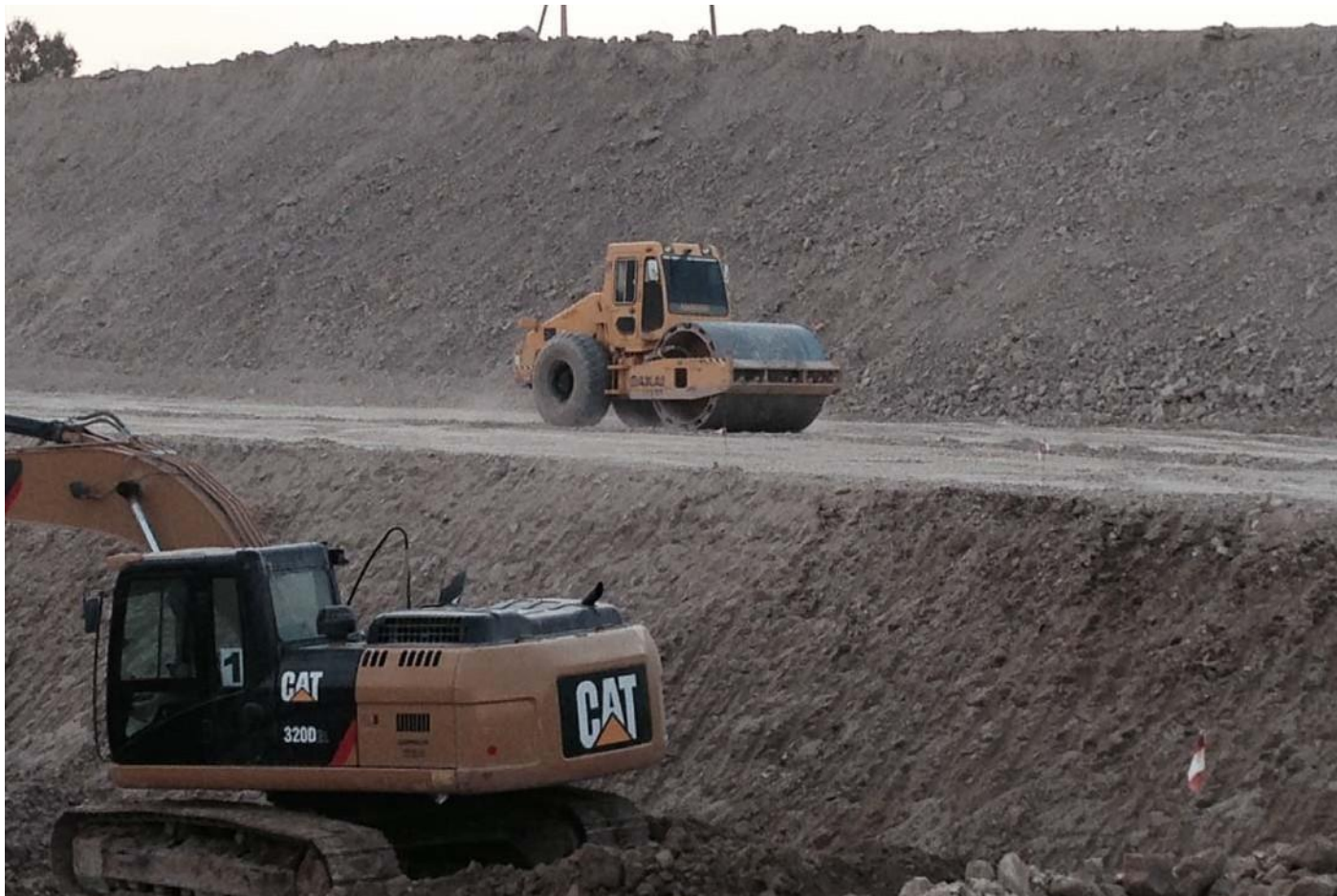
Тепличный комплекс. Калужская область, Людиновский район, деревня Войлово.