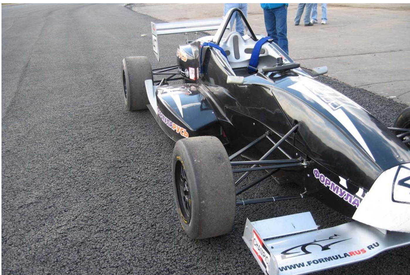
Этап строительства АДМ "МЯЧКОВО" гоночной трассы.