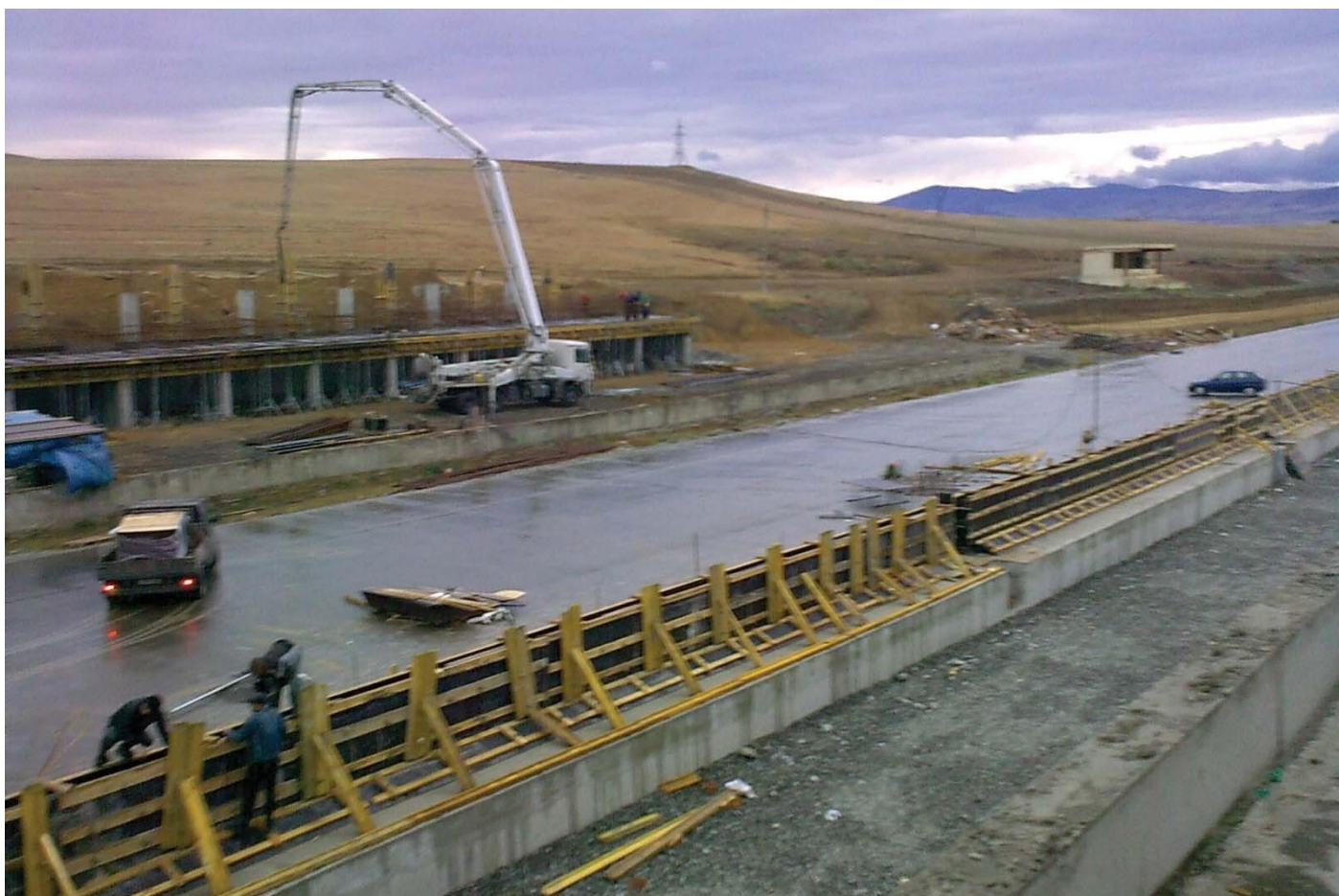
Этап строительства гоночной трассы "РУСТАВИ" в республике Грузии.