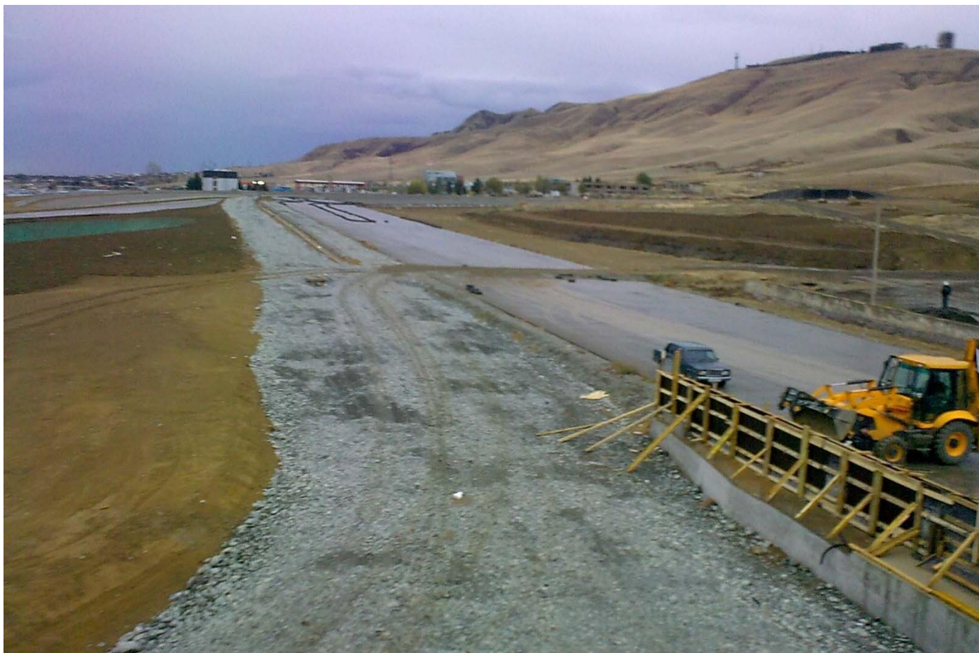
Этап строительства гоночной трассы "РУСТАВИ" в республике Грузии.