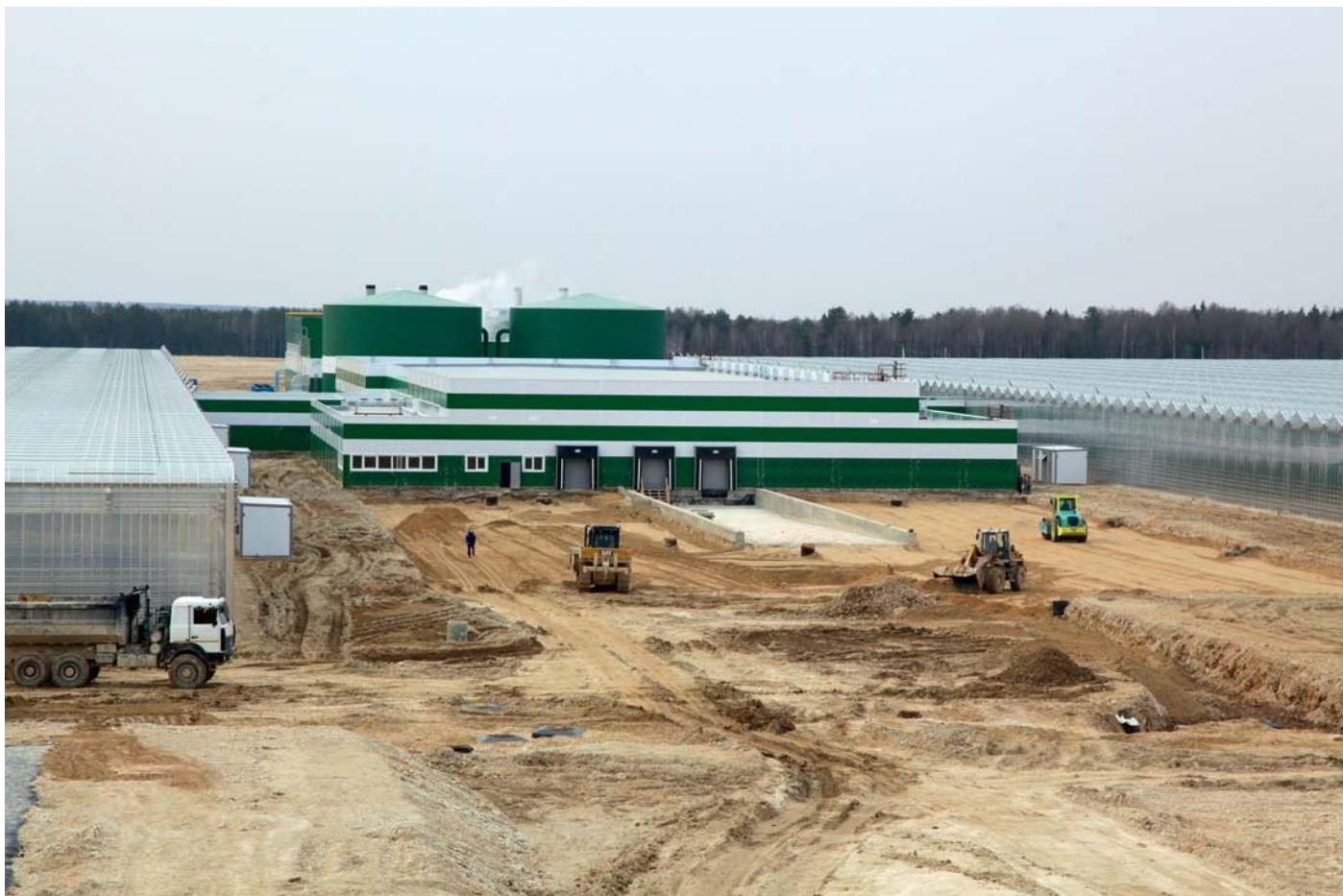
Тепличный комплекс. Калужская область, Людиновский район, деревня Войлово