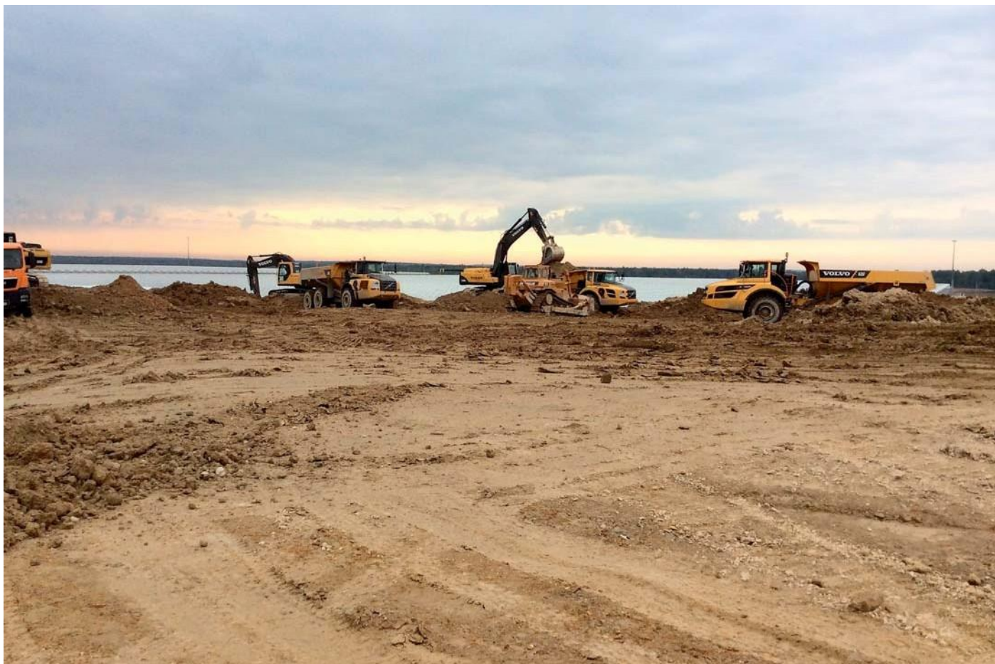
Тепличный комплекс. Калужская область, Людиновский район, деревня Войлово