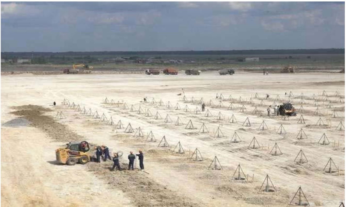
Тепличный комплекс. Калужская область, Людиновский район, деревня Войлово.