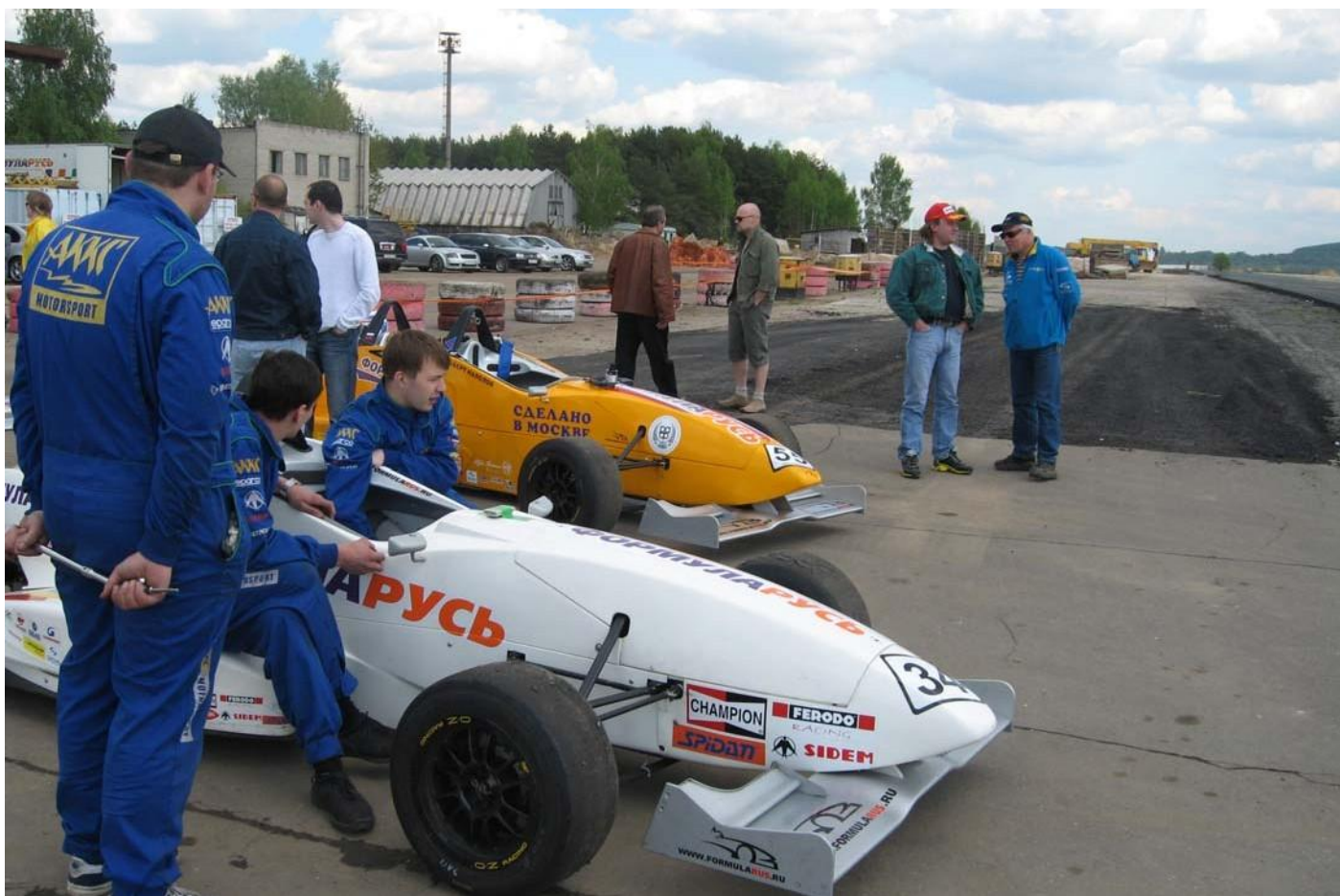
Этап строительства АДМ "МЯЧКОВО" гоночной трассы.