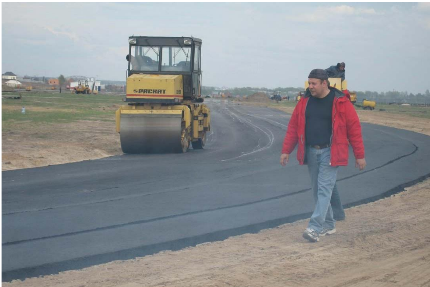
Этап строительства АДМ "МЯЧКОВО" гоночной трассы.