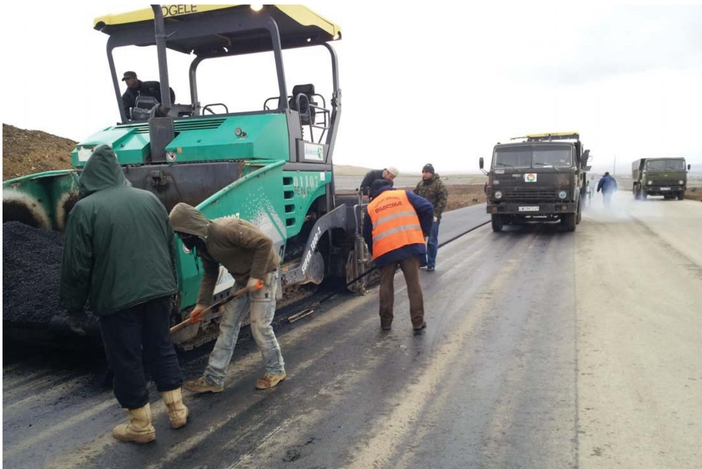
Этап строительства гоночной трассы "РУСТАВИ" в республике Грузии.