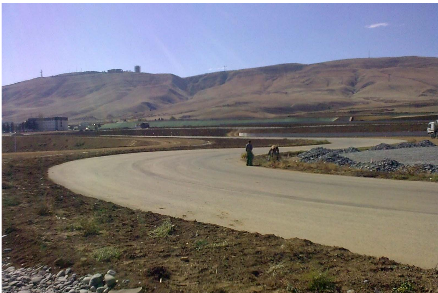
Этап строительства гоночной трассы "РУСТАВИ" в республике Грузии.