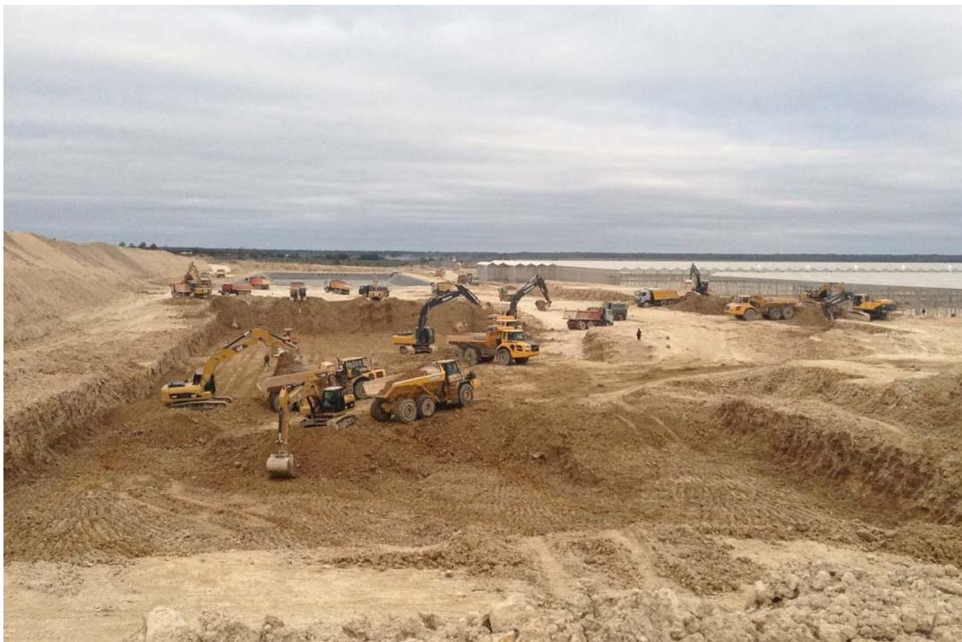
Тепличный комплекс. Калужская область, Людиновский район, деревня Войлово.