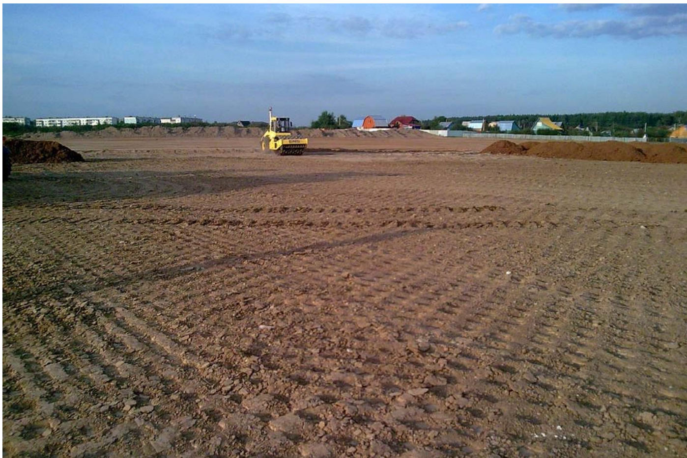
Автологистика Московская обл. Солнечногорский район д. Пикино