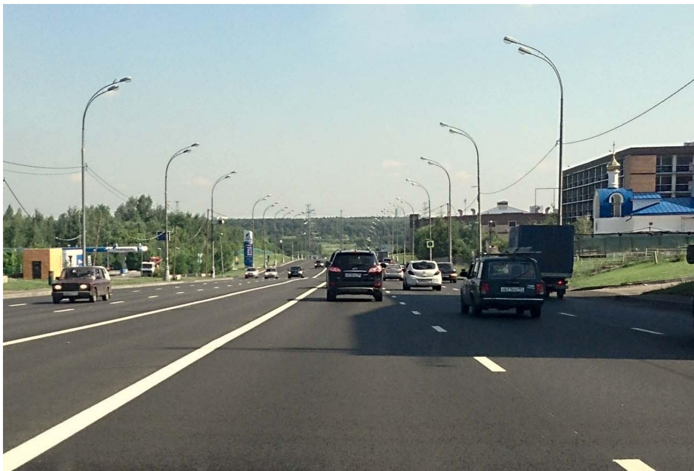
г. Москва, ул. Поляны. Ремонт асфальтобетонных покрытий