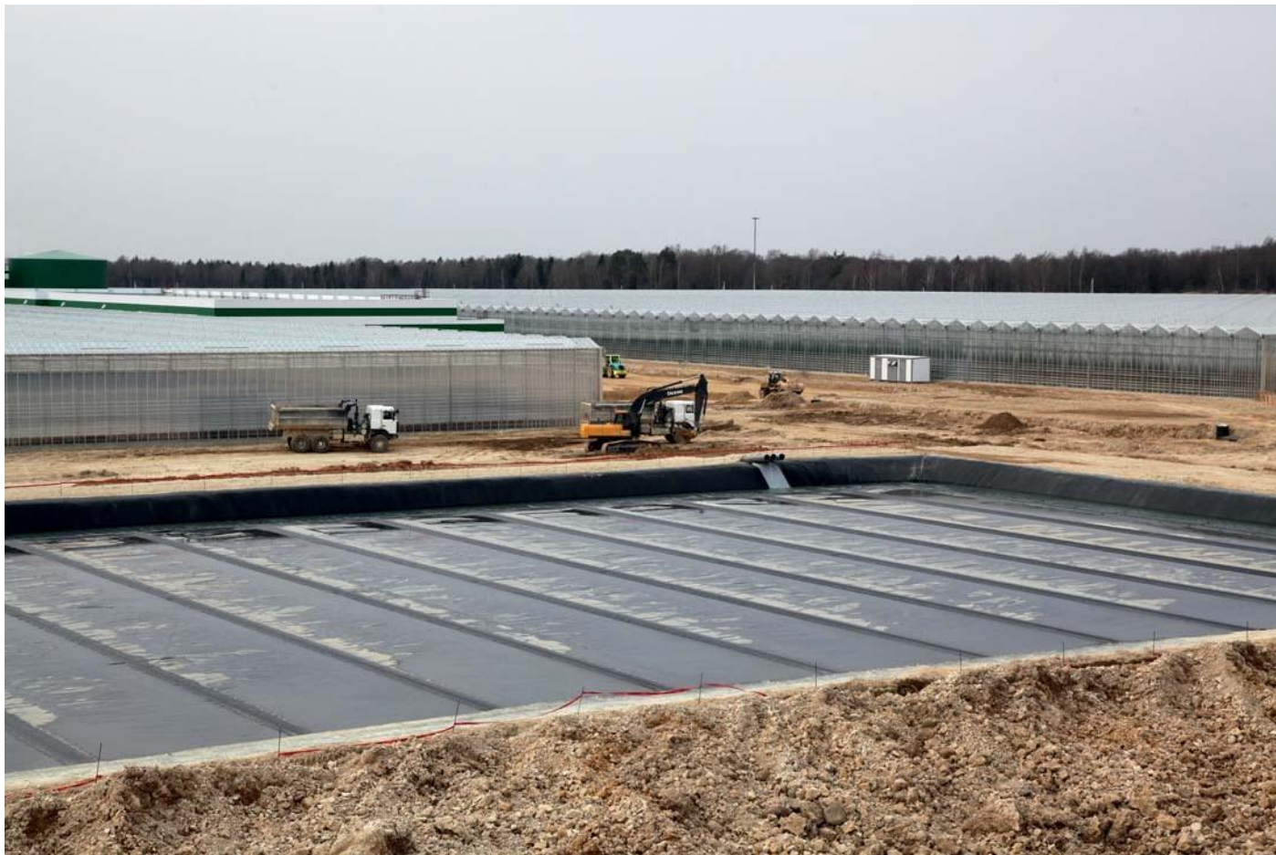
Тепличный комплекс. Калужская область, Людиновский район, деревня Войлово