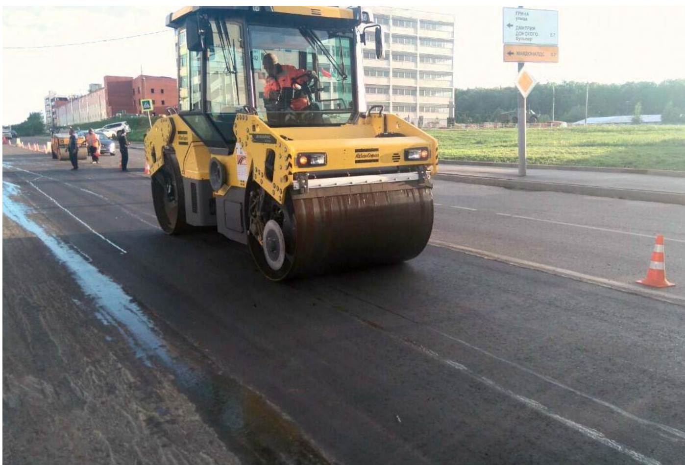
г. Москва, ул. Куликовская. Ремонт асфальтобетонных покрытий