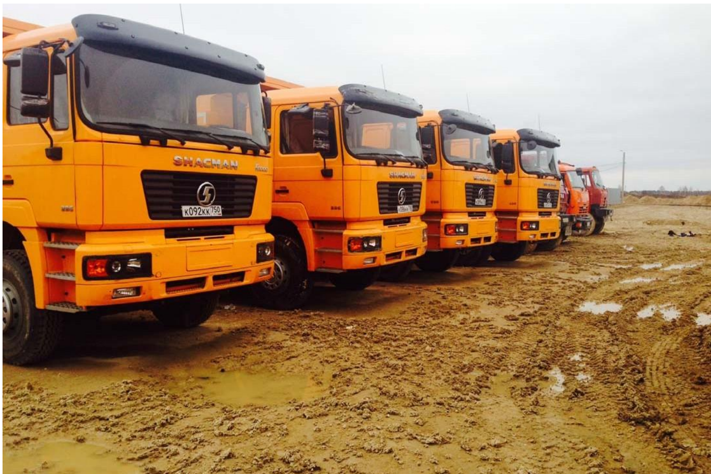
Тепличный комплекс. Калужская область, Людиновский район, деревня Войлово.