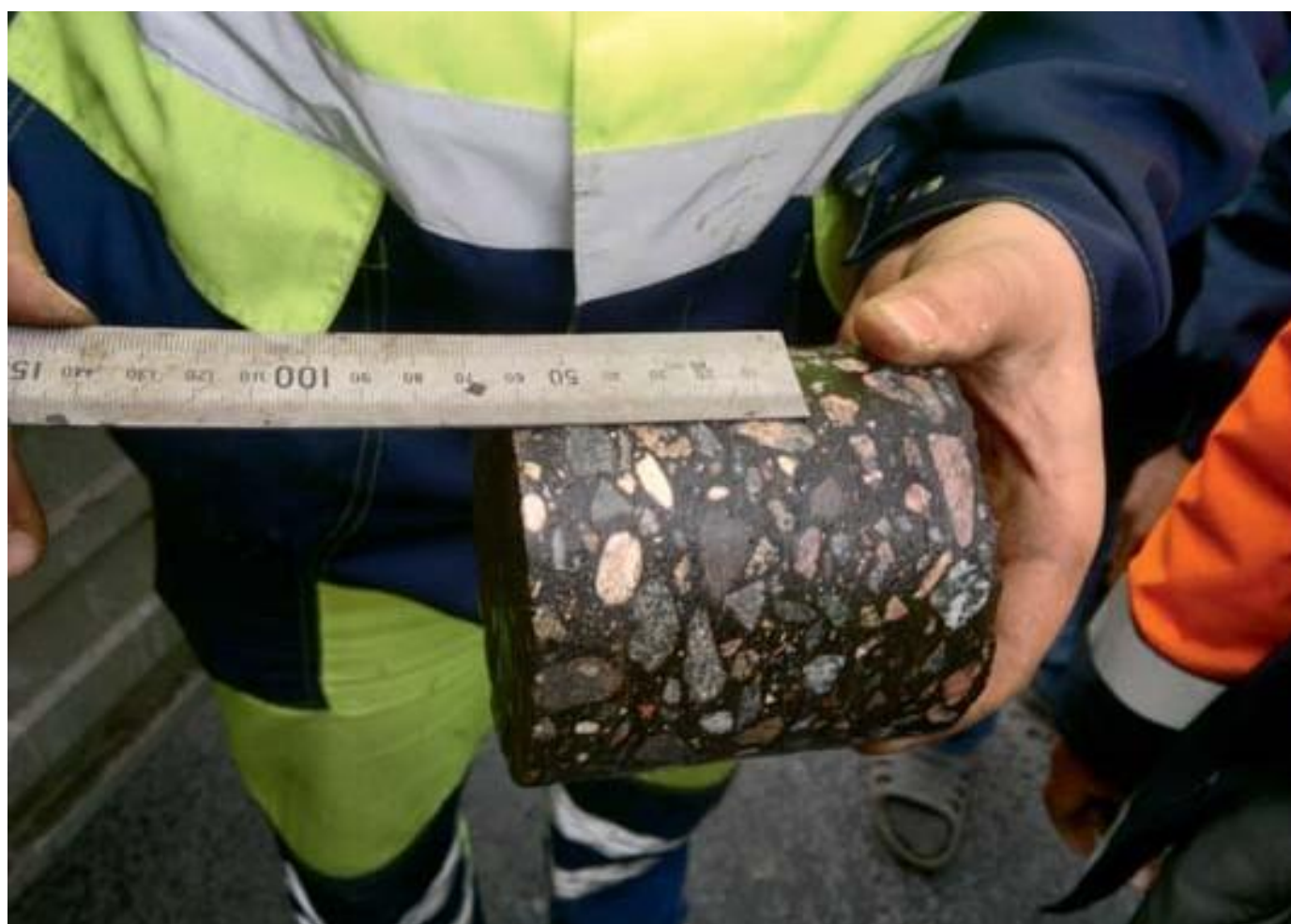
г. Москва, ул. Голубинская. Ремонт асфальтобетонных покрытий