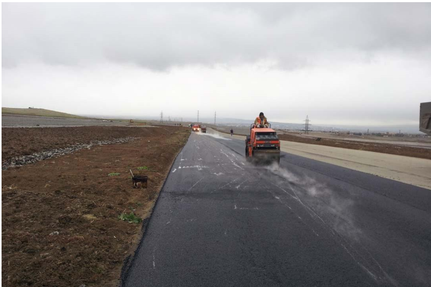
Этап строительства гоночной трассы "РУСТАВИ" в республике Грузии.