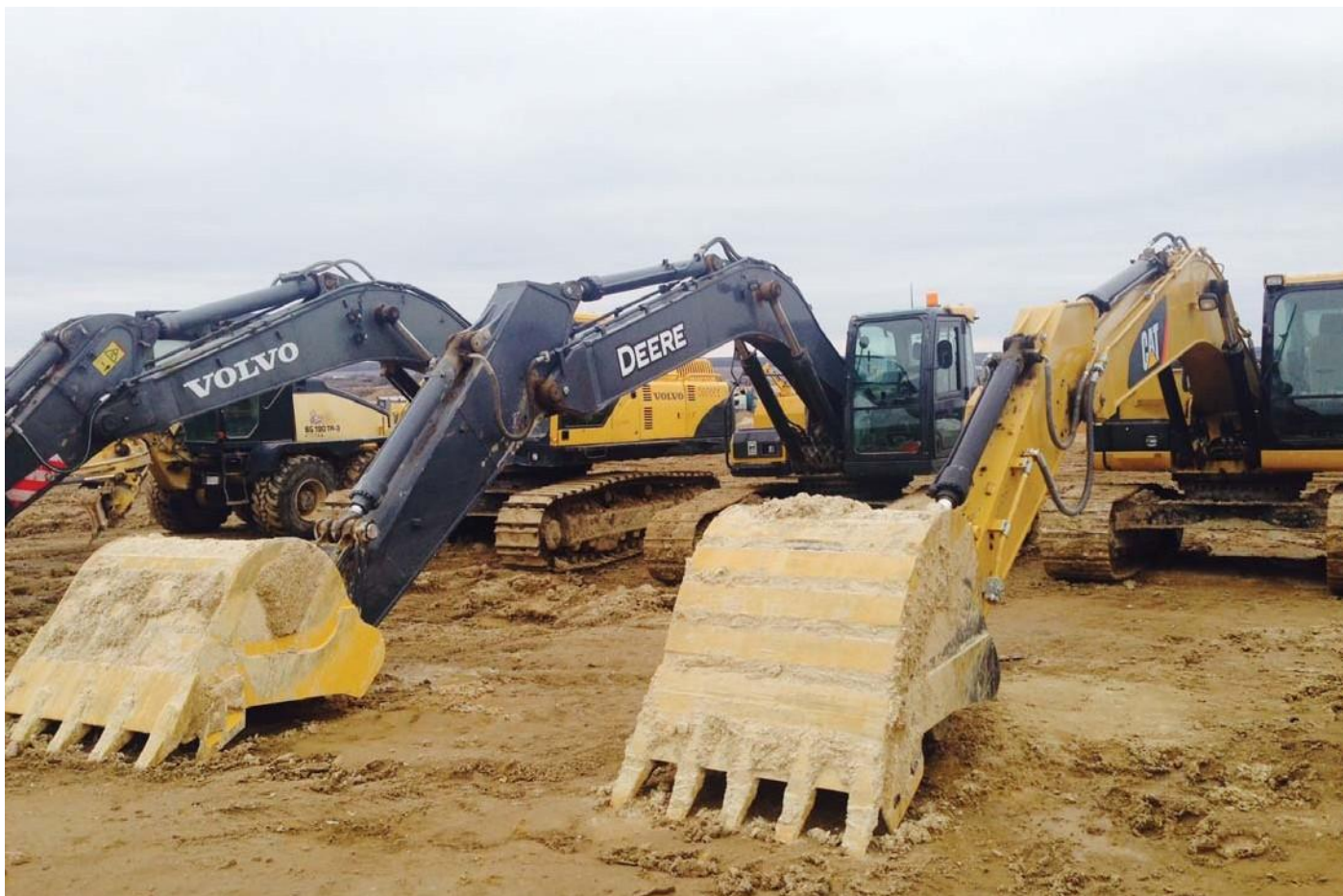
Тепличный комплекс. Калужская область, Людиновский район, деревня Войлово.