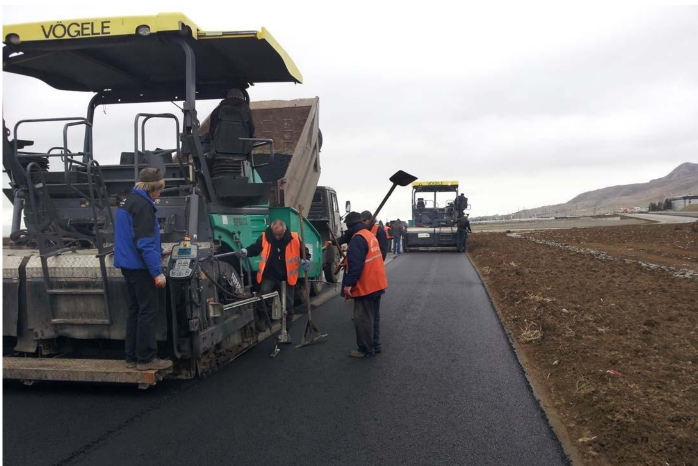
Этап строительства АДМ "МЯЧКОВО" гоночной трассы.