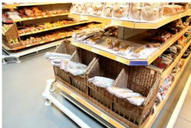
Корзины для выкладки хлеба

К инвентарю для выкладки непродовольственных товаров относятся лотки, корзины, кассеты, планшеты с образцами товаров, плечики для одежды и др.