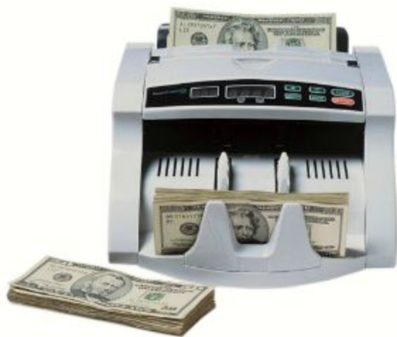
Устройство для подсчета денег

Для подсчета денег и расчетов с покупателями используют устройства для пересчета денежных купюр, монетницы (тарелки для монет), губочницы для смачивания пальцев при подсчете денег, калькуляторы, наколки для чеков и др.