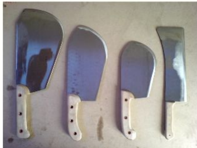
Ножи для обработки мясных туш