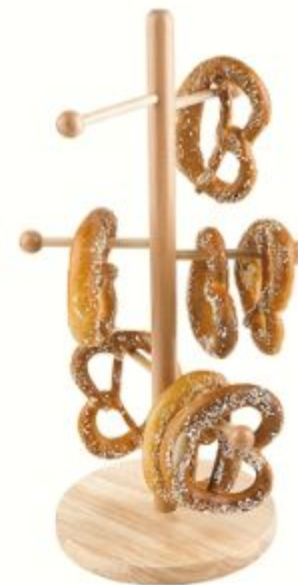
Подставка под кондитерские изделия

Для рекламы продовольственных товаров используют подставки для сыпучих бакалейных товаров, вертушки наприлавочные для бутылок и банок, кронштейны настенные и др.