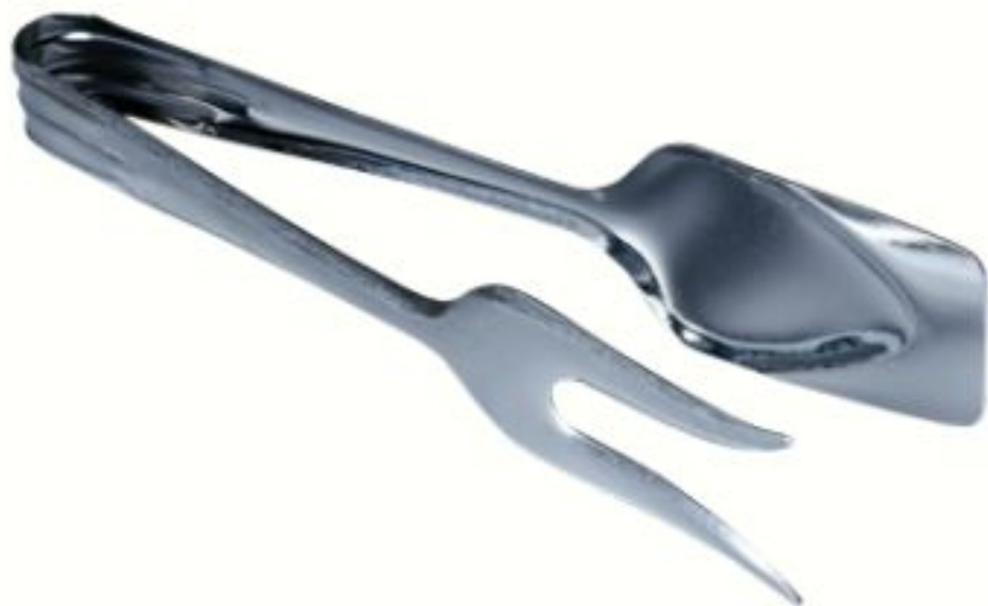
Щипцы для мяса