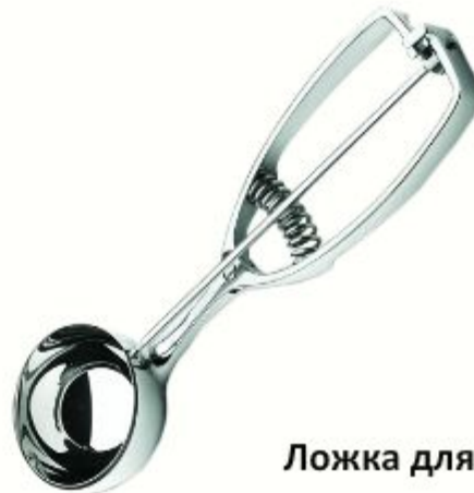
Ложка для мороженого