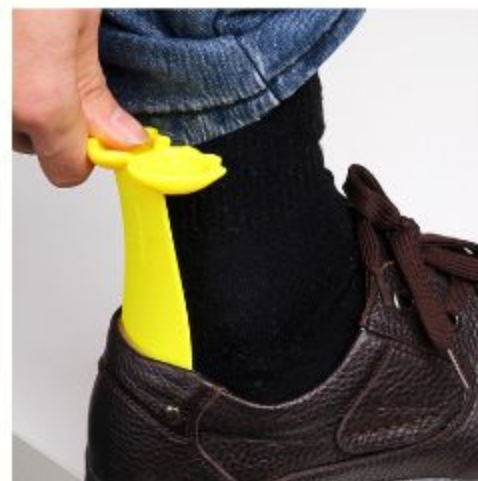
Рожок для обуви