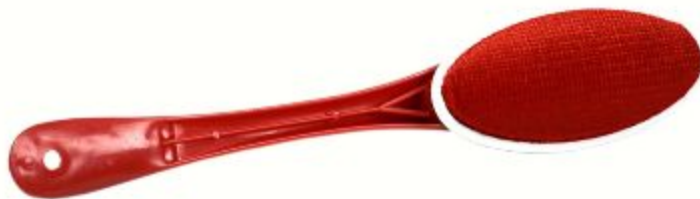
Щетка для чистки одежды

К инвентарю для подготовки к продаже непродовольственных товаров относятся утюги, гладильные доски, щетки для чистки одежды, электропылесосы, ножницы, совки, стеклорезы и линейки для резания стекол, гаечные ключи, отвертки.