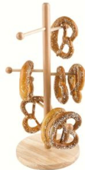
Подставка под кондитерские изделия

Для рекламы продовольственных товаров используют подставки для сыпучих бакалейных товаров, вертушки наприлавочные для бутылок и банок, кронштейны настенные и др.