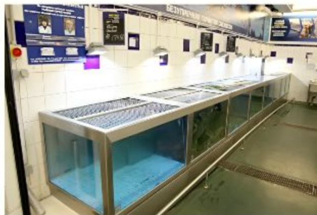
Аквариумы для рыбы