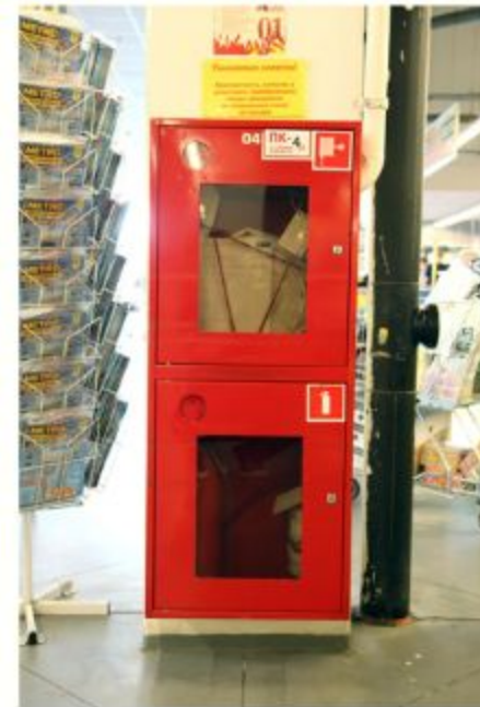
Противопожарный щит с набором инструментов

Противопожарный инвентарь должен находиться на видном месте.