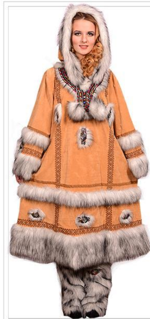
КОСТЮМ ЧУКЧА ЖЕНСКИЙ Арт N180170

2. Летом одевают легкие одежды – балахоны из оленей замши