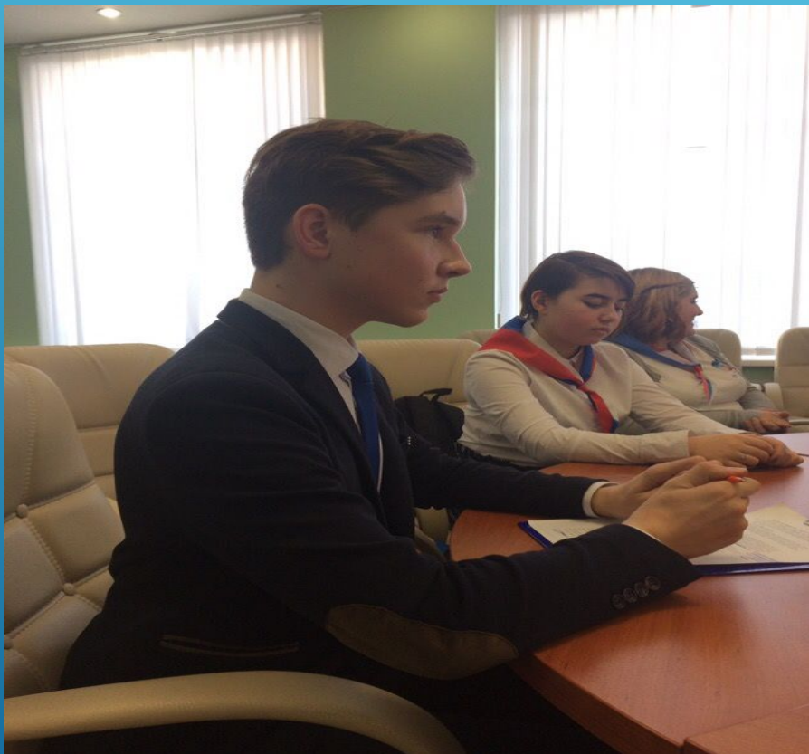
Круглый стол «РДШ-Территория Самоуправления»