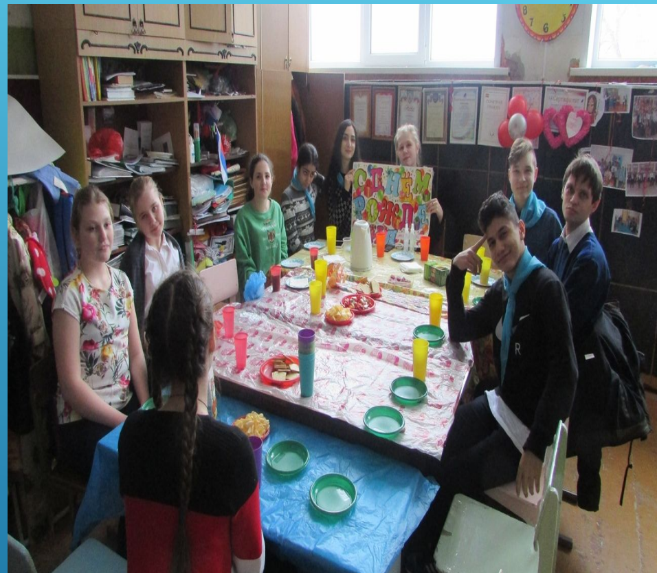
День рождения ДШО "ЮВЕНТА"