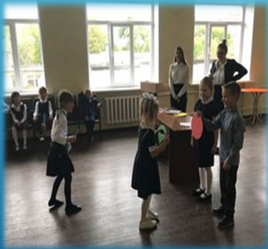
Путешествие в страну ПДД