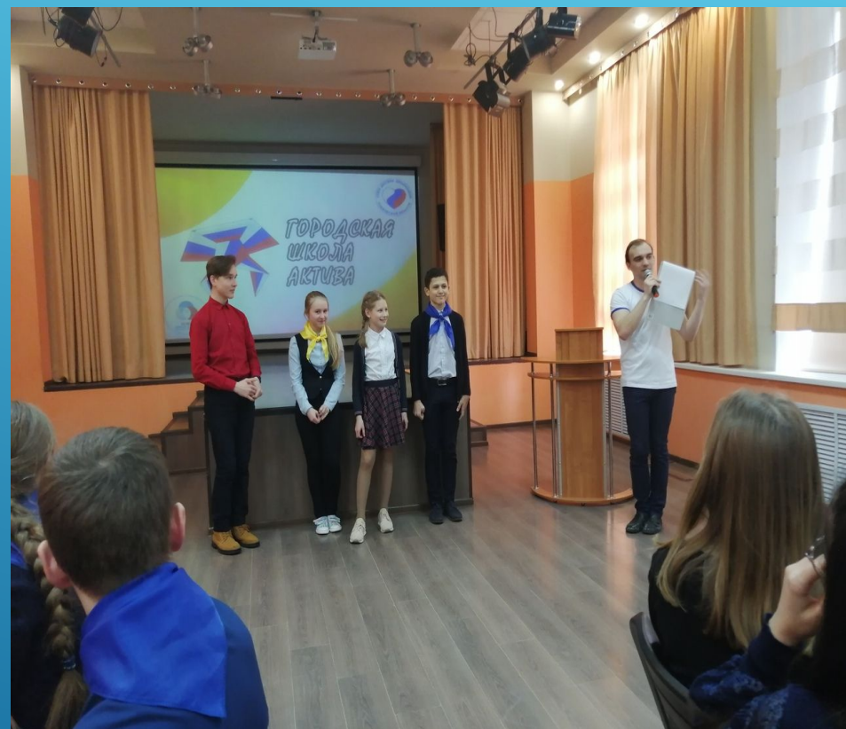
заккрытие Городской школы актива «Хочу стать вожатым»