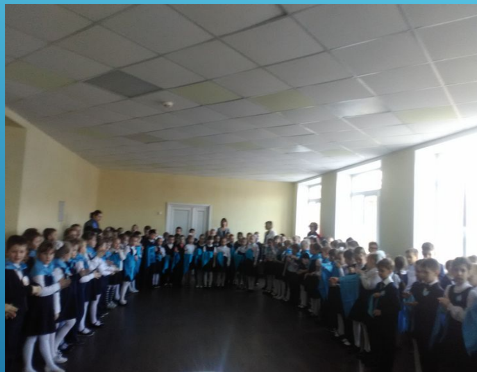
Посвящение 1 класса в Детской Школьной Организации «ЮВЕНТА».