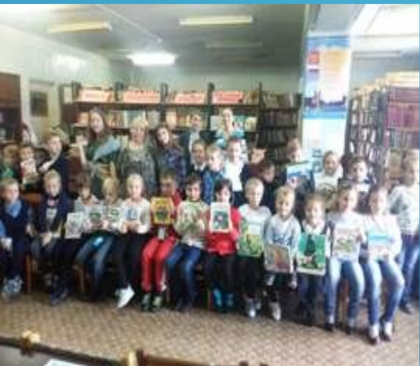
Встреча со сказочными героями