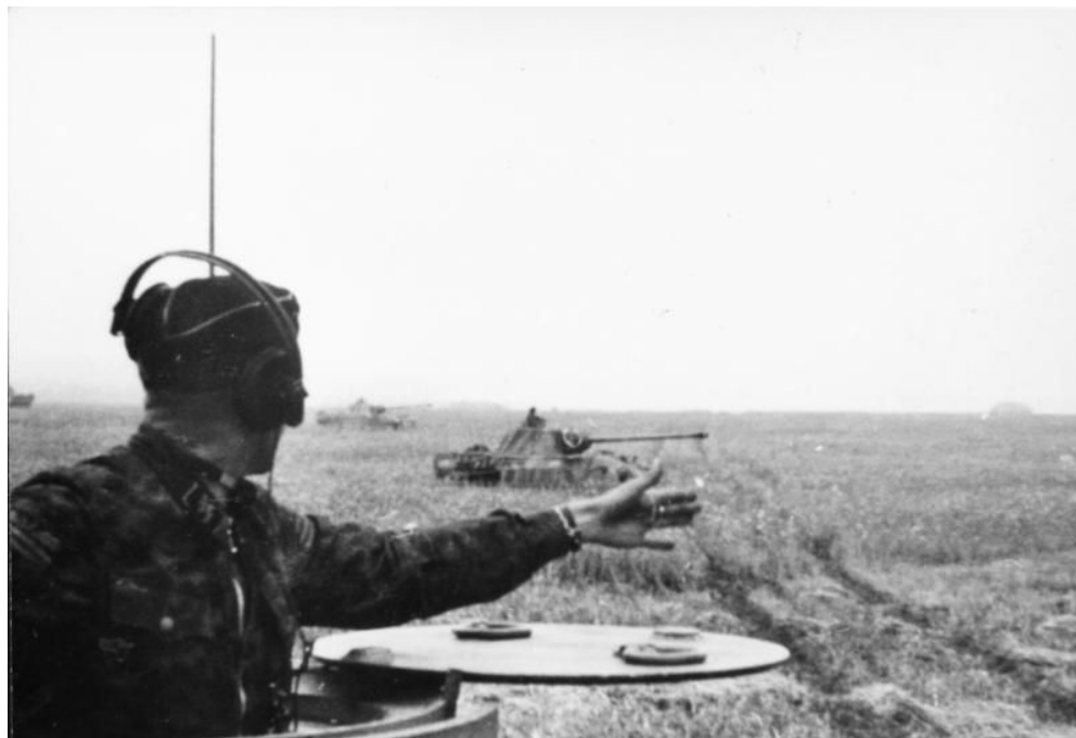
Bundesarchiv - Bild 10111-Merz-023-22 Foto: Merz | 1943 Juli - August

На начальной стадии наступления 48-й танковый корпус, являвшийся наиболее сильным соединением 4 танковой армии, в составе: 3 и 11 танковых дивизий, механизированной (танково-гренадерской) дивизии «Великая Германия», 10 танковой бригады и 911 отд. дивизиона штурмовых орудий, при поддержке 332 и 167 пехотных дивизий, имел задачей прорыв первой, второй и третьей линий обороны частей Воронежского фронта из района Герцовка — Бутово в направлении Черкасское — Яковлево — Обоянь.