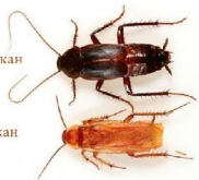
Рыжий таракан (Прусак)