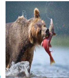
Медведь ловит семгу