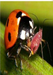
Божья коровка и тля