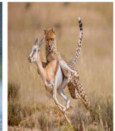
Гепард и косуля