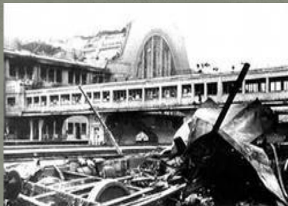
Здание вокзала в Киеве