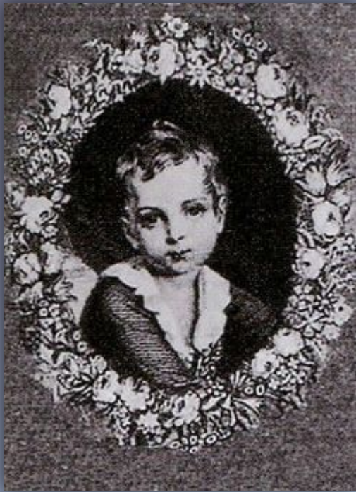
Великий князь Александр Николаевич в детстве