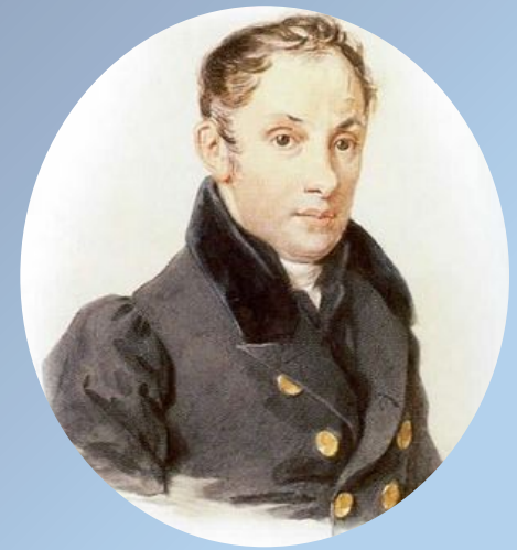
Жуковский Василий Андреевич