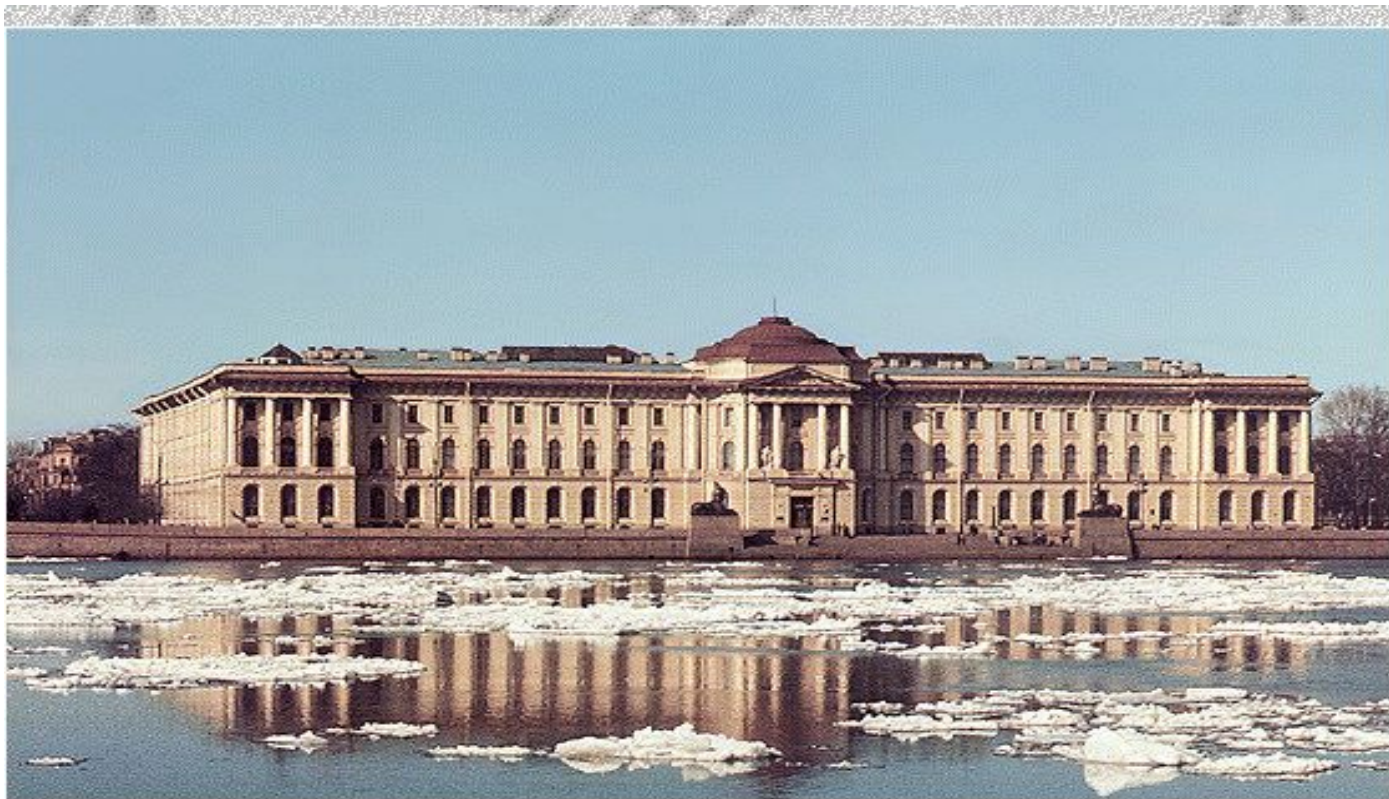
The Academy of Arts