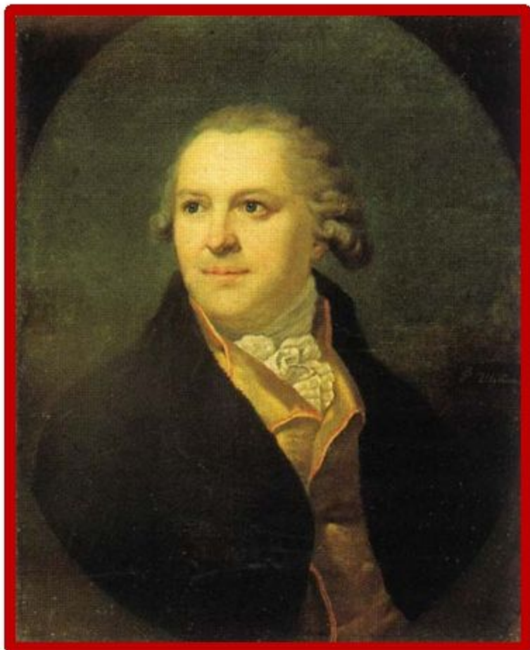
Федот Иванович Шубин

Федот Иванович Шубин (1740—1805) – наиболее значительный русский скульптор XVIII века, представитель классицизма.