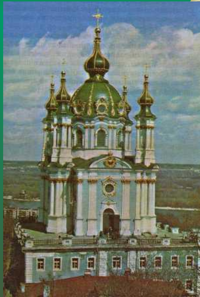
Архитектурные творения Растрелли