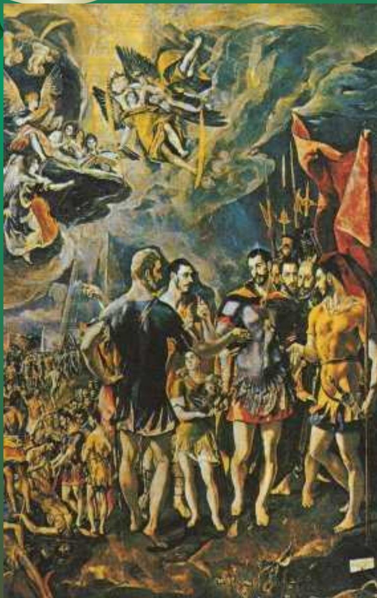
Эль Греко Мученичество Святого Маврикия