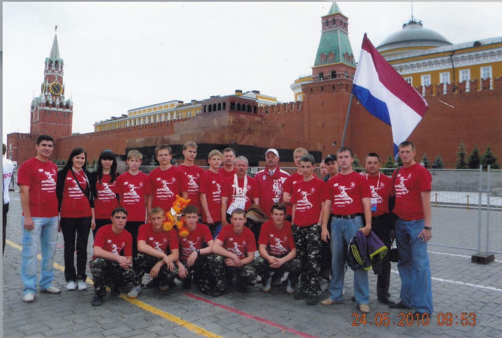
Команда кадет Саранского лицея №26 на Всероссийском военно-спортивном форуме ГТО. Москва. Красная площадь. 2012 г.