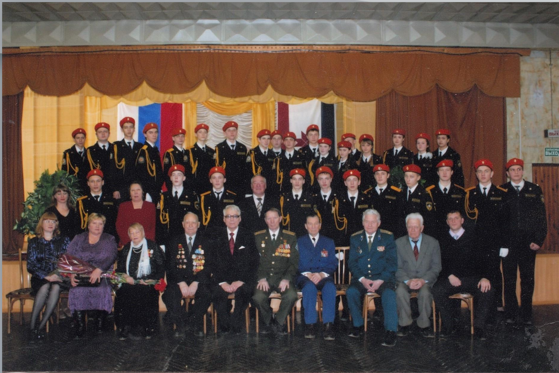
Кадеты Саранского лицея № 26 на встрече с ветеранами войны. Саранск. 2012 г.