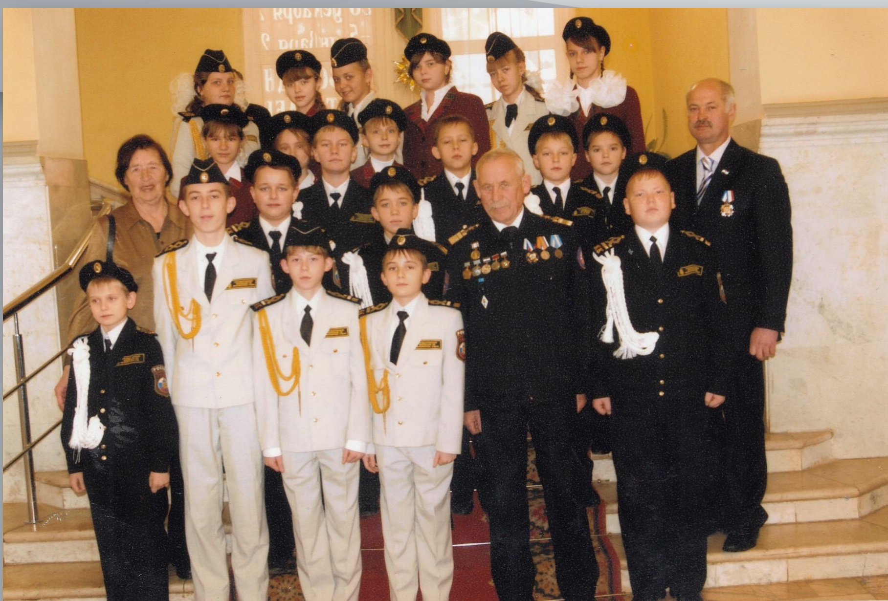
Республиканский кадетский слёт. Кадеты г. Ковылкино. Национальный театр. Саранск. 2011 г.