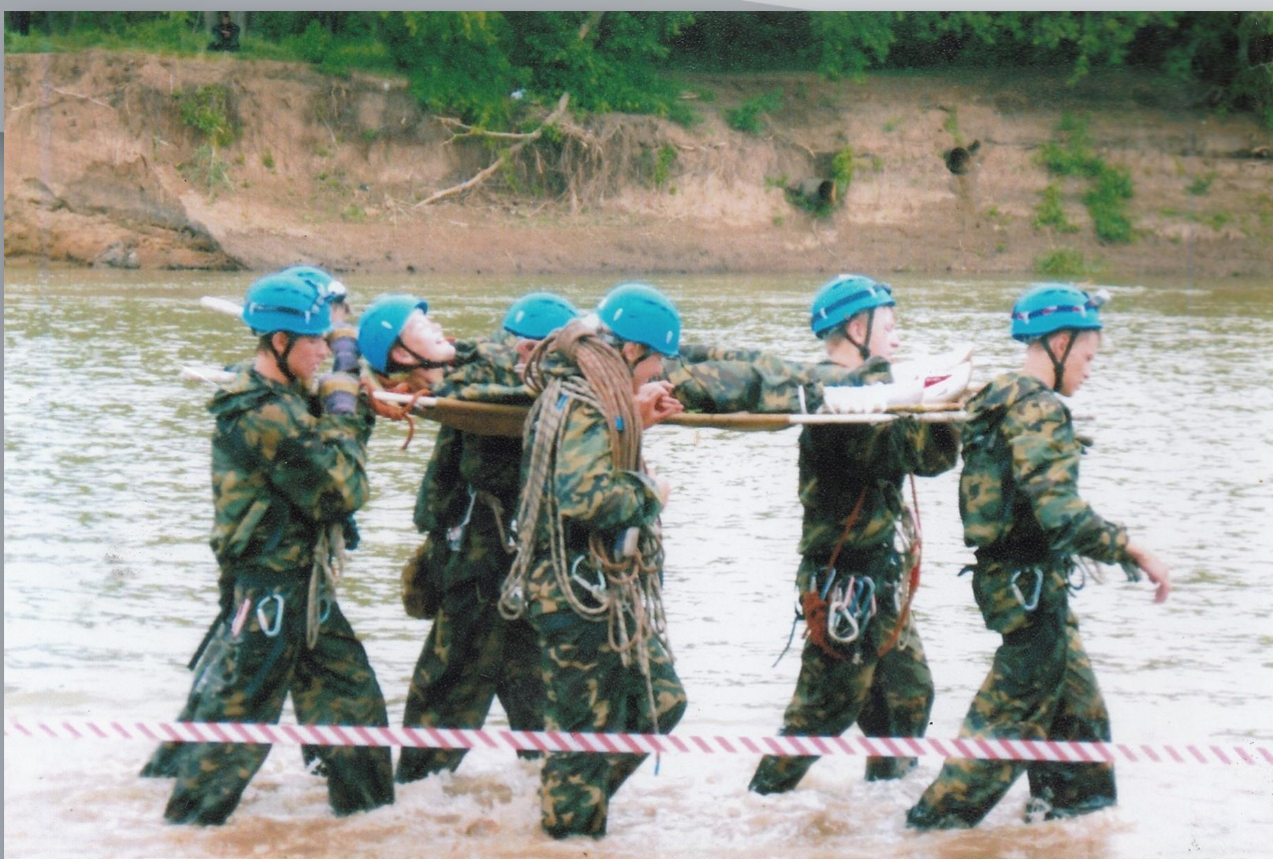
Члены клуба «Юный патриот» СОШ №8 на Межрегиональных соревнованиях «Юный спасатель». Оренбургская обл. р. Урал. 2007 г.