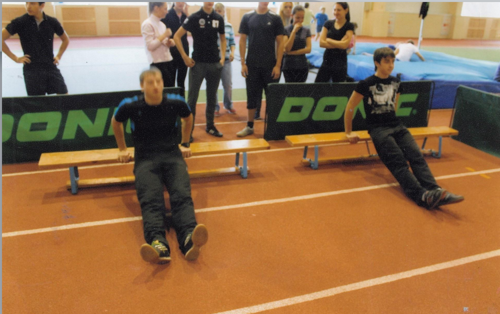
Республиканские соревнования - комплекс ГТО. Сдача норматива «Отжимание в упоре сидя». Саранск. 2012 г.