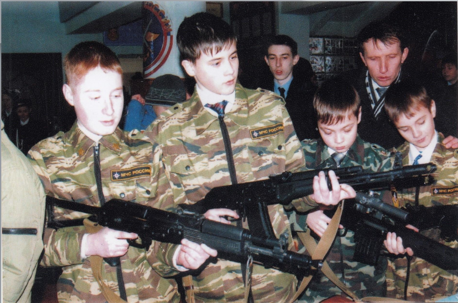
Кадеты МЧС. г. Ковылкино. 2013 г.