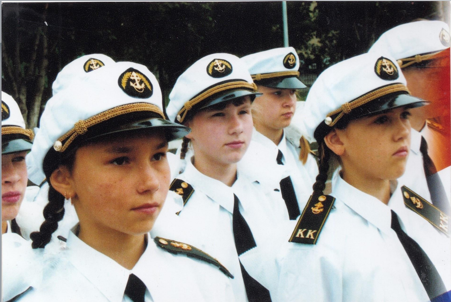
Морские кадеты «Ушаковцы» Саранской школы № 3. Саранск. 2013 г.