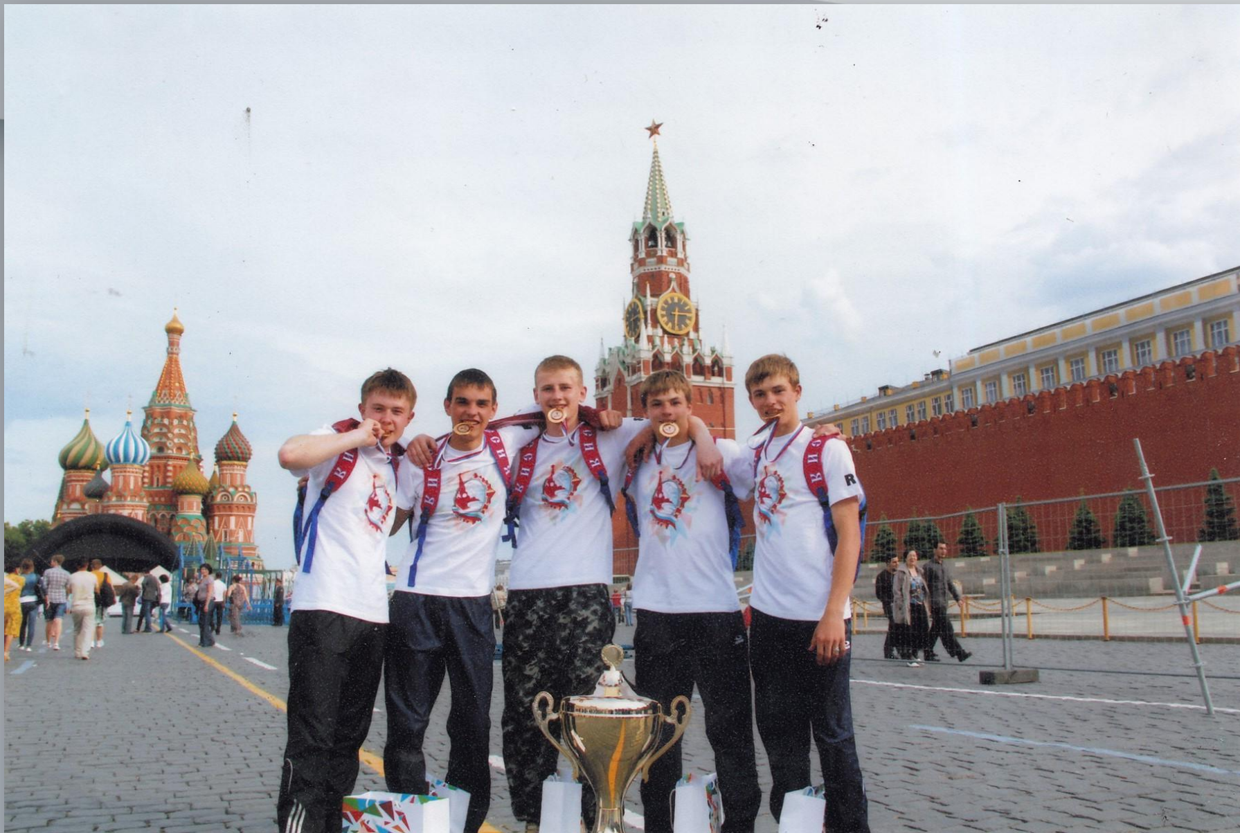
Команда кадет Саранского лицея №26 - победители соревнований ГТО. Москва. Красная площадь. 2012 г.