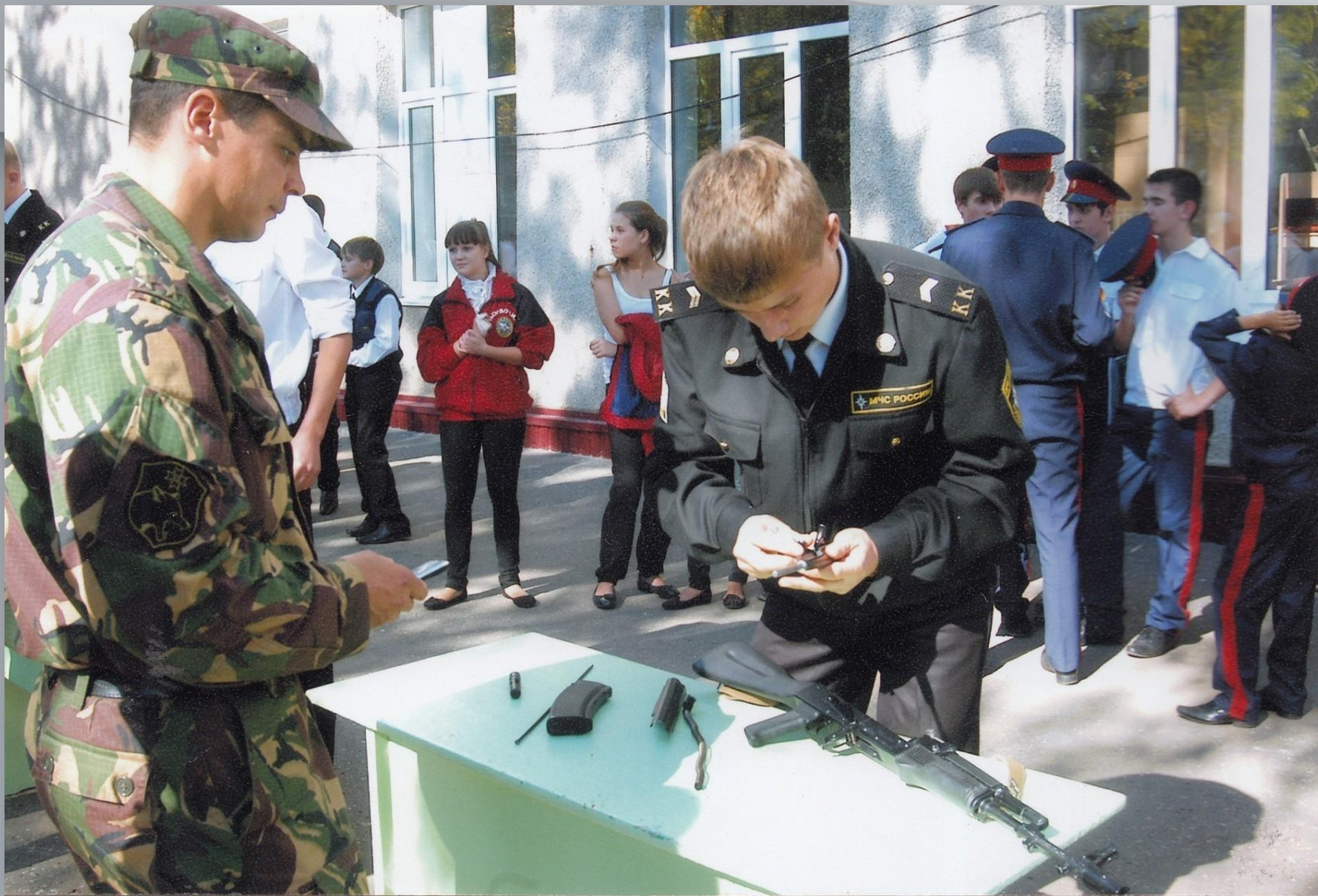
Республиканские соревнования по сборке и разборке оружия. Саранск. 2013 г.