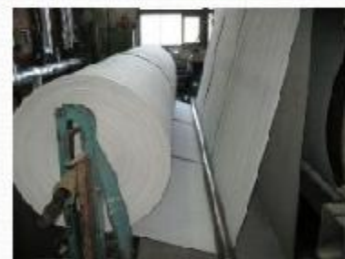
незаменимое сырье для производства бумаги