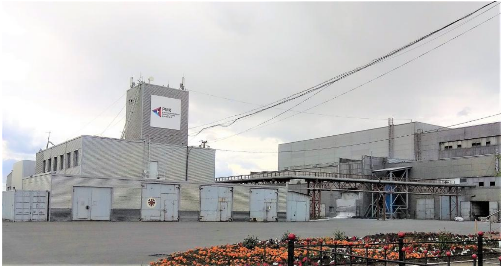
АЛЕКСАНДРИНСКАЯ ГОРНО-РУДНАЯ КОМПАНИЯ