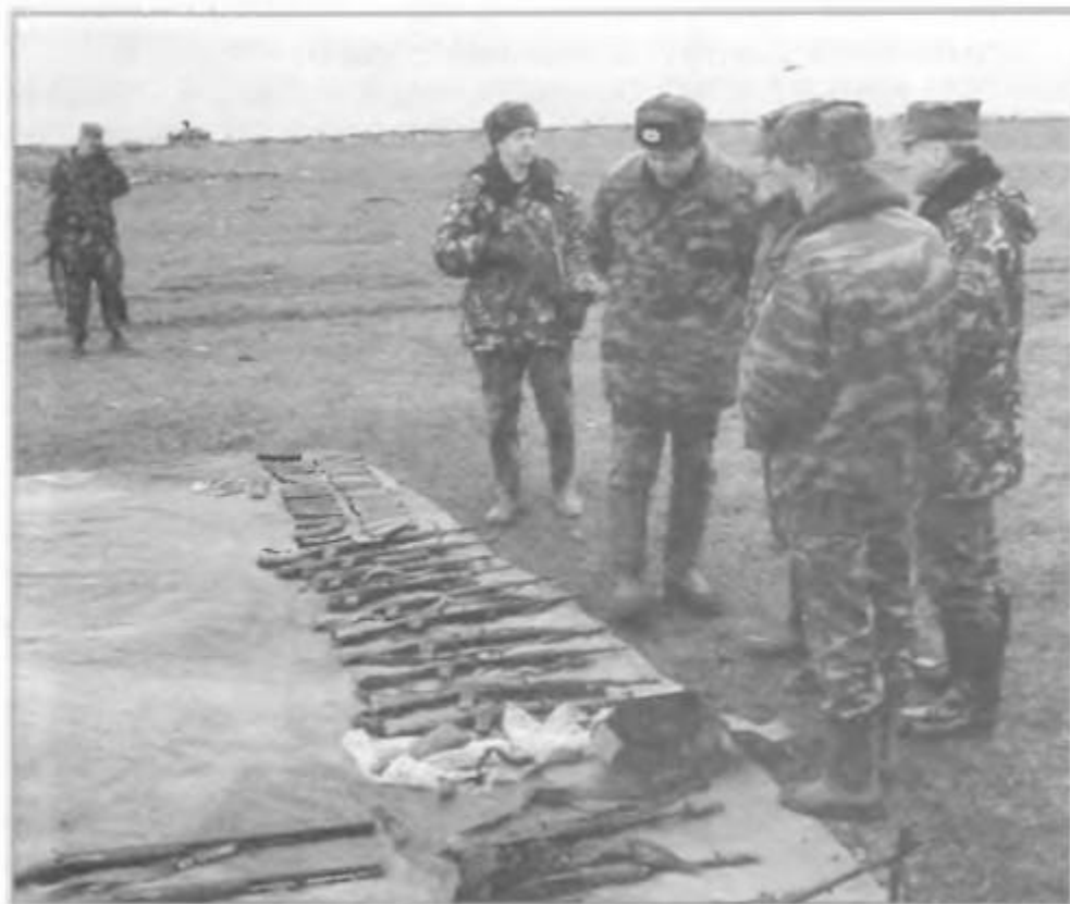
Ликвидация склада оружия и боеприпасов, принадлежащих незаконным вооруженным формированиям. Село Старые Атаги. Республика Чечня, февраль 2002 г.