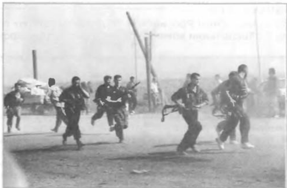
Боевики из незаконных вооруженных формирований в населенном пункте на территории Республики Чечня. 90-е гг. XX в.

Вооруженные силы Российской Федерации играют главную роль в обеспечении военной безопасности государства.