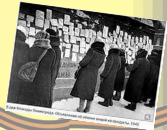
В дни блокады Ленинграда. Общественная обстановка на переднем плане. 1942