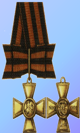
Знак отличия-Георгиевский Крест I ст.