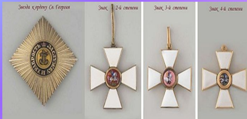
Императорский Военный орден Святого Великомученика и Победоносца Георгия