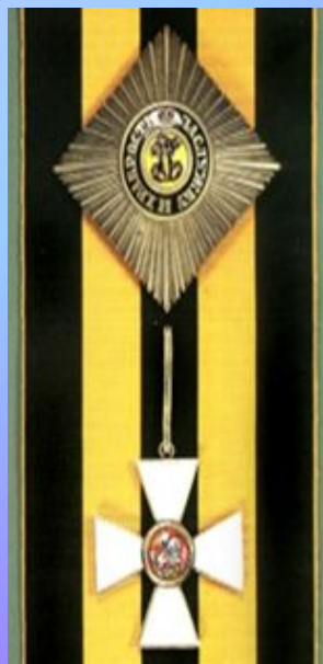
Орден Святого Георгия со звездой