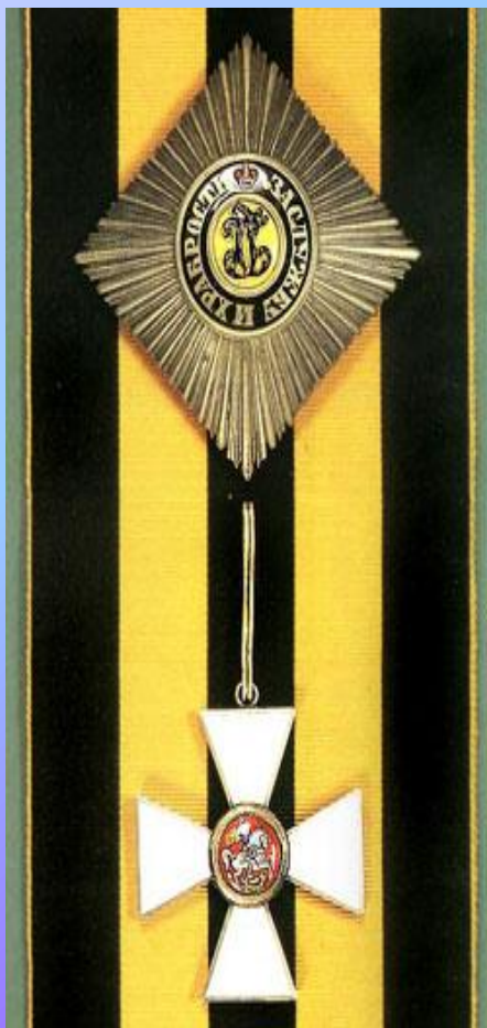
Орден Святого Георгия со звездой (1769 г.)