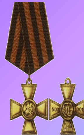
Знак отличия-Георгиевский Крест II ст.