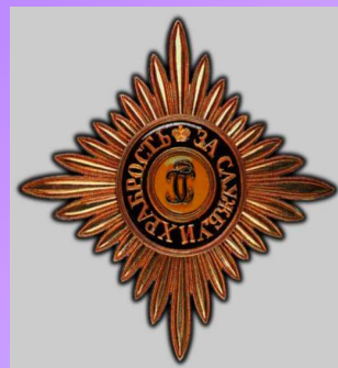
Высший военный орден Российской Федерации Орден Святого Георгия