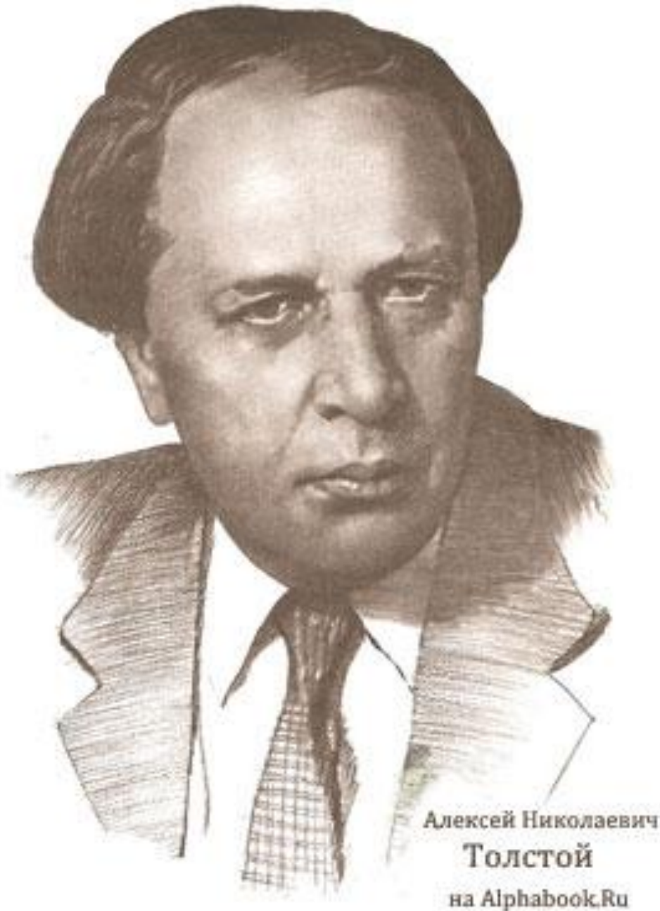
Алексей Николаевич Толстой на Alphabook.Ru