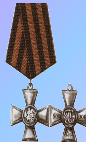
Знак отличия-Георгиевский Крест IV ст.