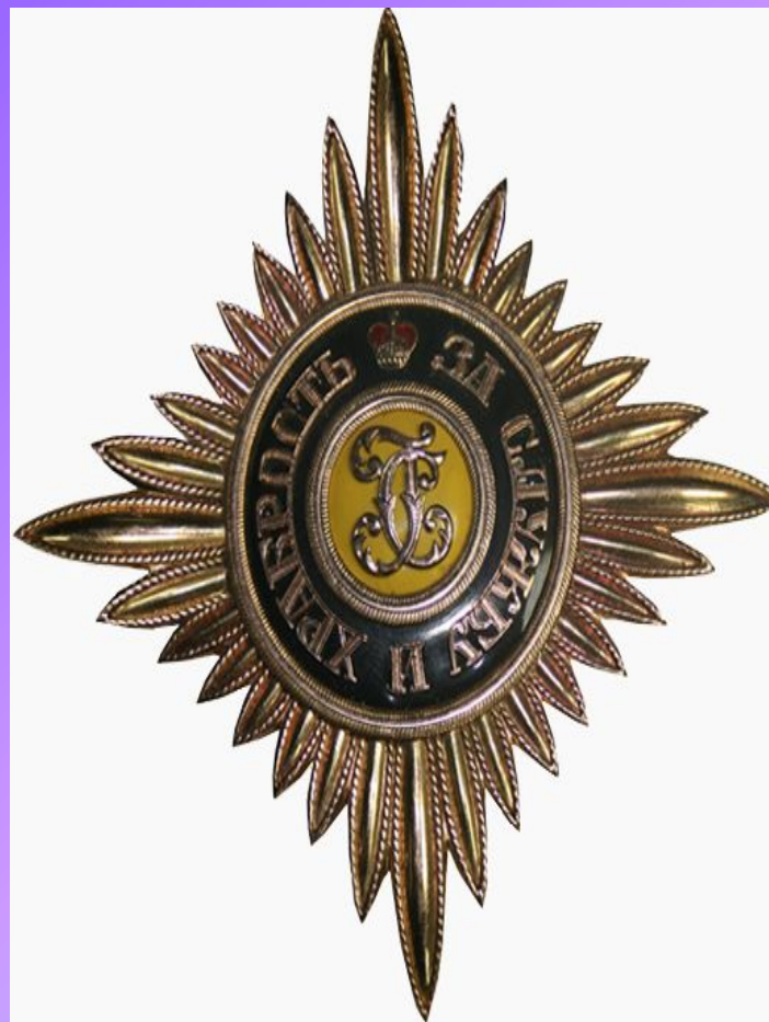
Орден Святого Георгия (2000 г.)