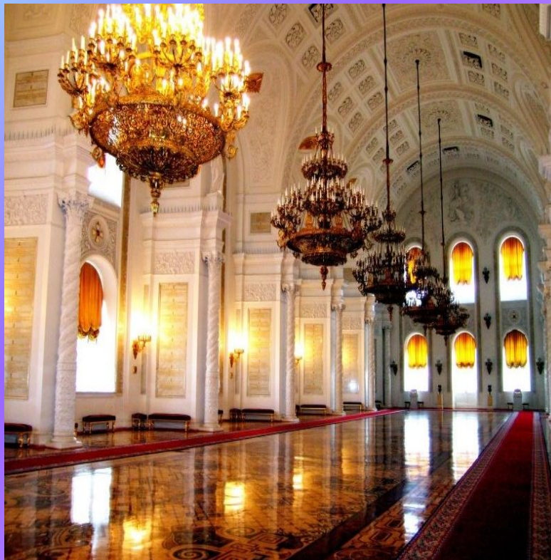
Георгиевский зал Большого Кремлевского дворца