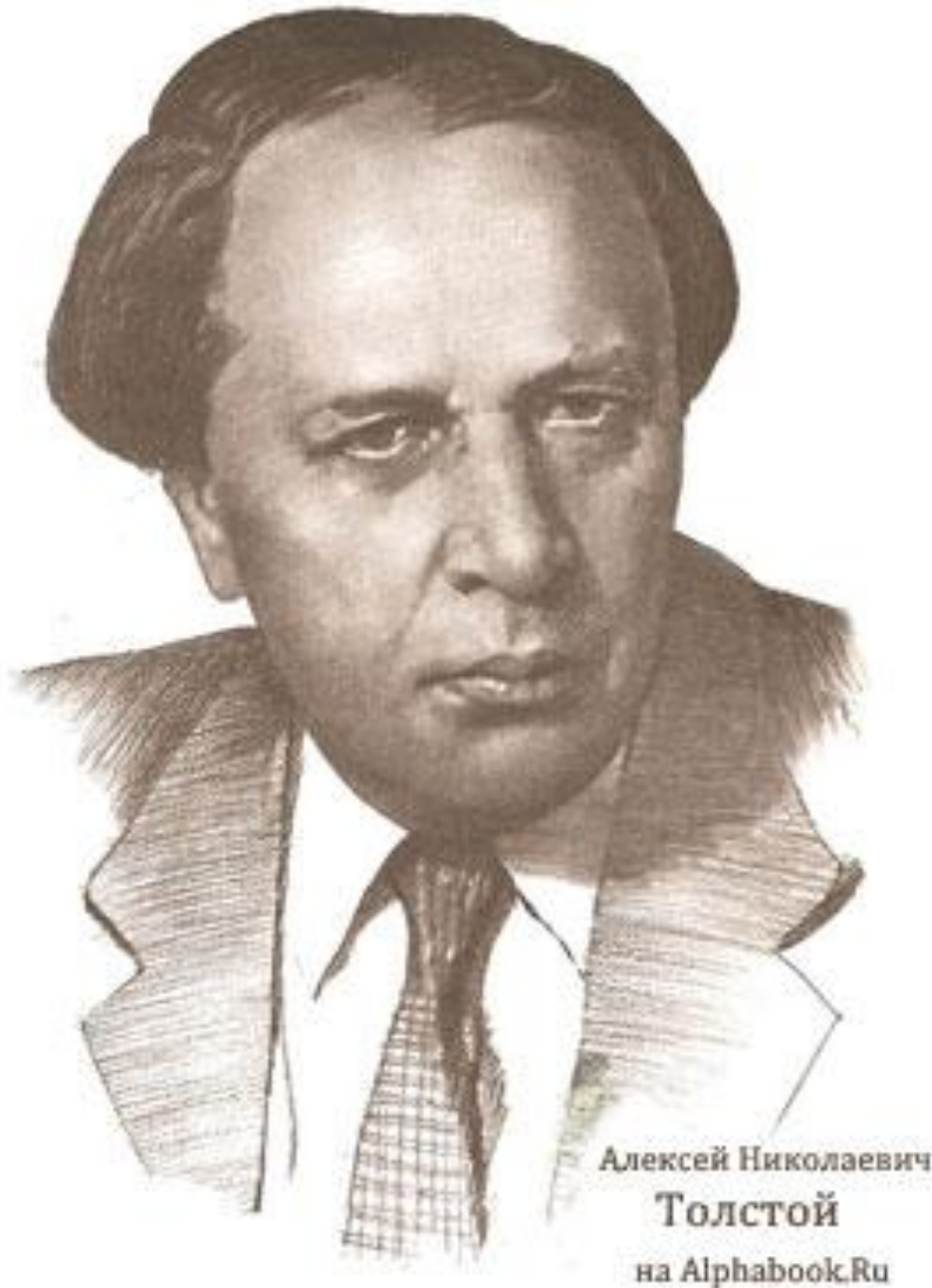
Алексей Николаевич Толстой на Alphabook.Ru