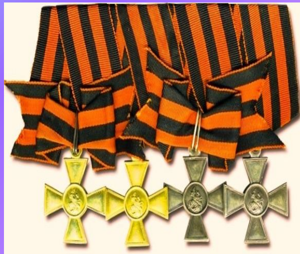
Георгиевский крест (1807 г., 1992 г.)