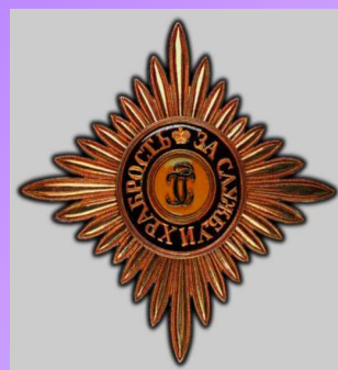
Высший военный орден Российской Федерации Орден Святого Георгия