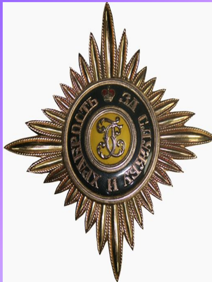
Орден Святого Георгия (2000 г.)