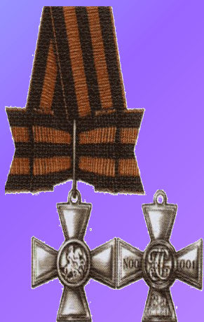
Знак отличия-Георгиевский Крест III ст.