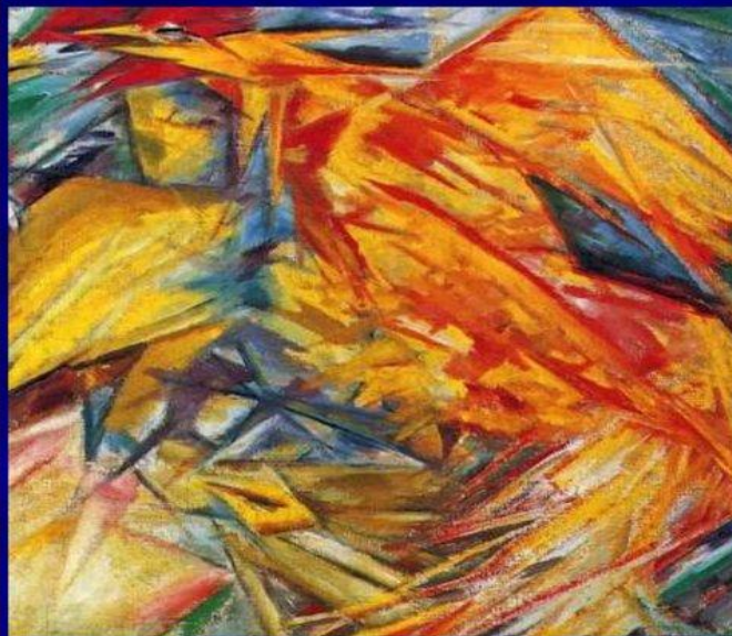
М. Ларионов. Петух и курица. 1912 Государственная Третьяковская галерея. Москва