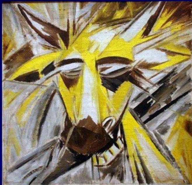
М. Ларионов. Голова быка