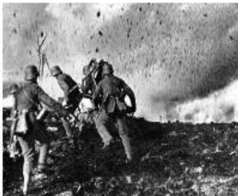
Во время войны. Фотография

"В истории России войны - это тяжкий труд всего народа" В. О. Ключевский