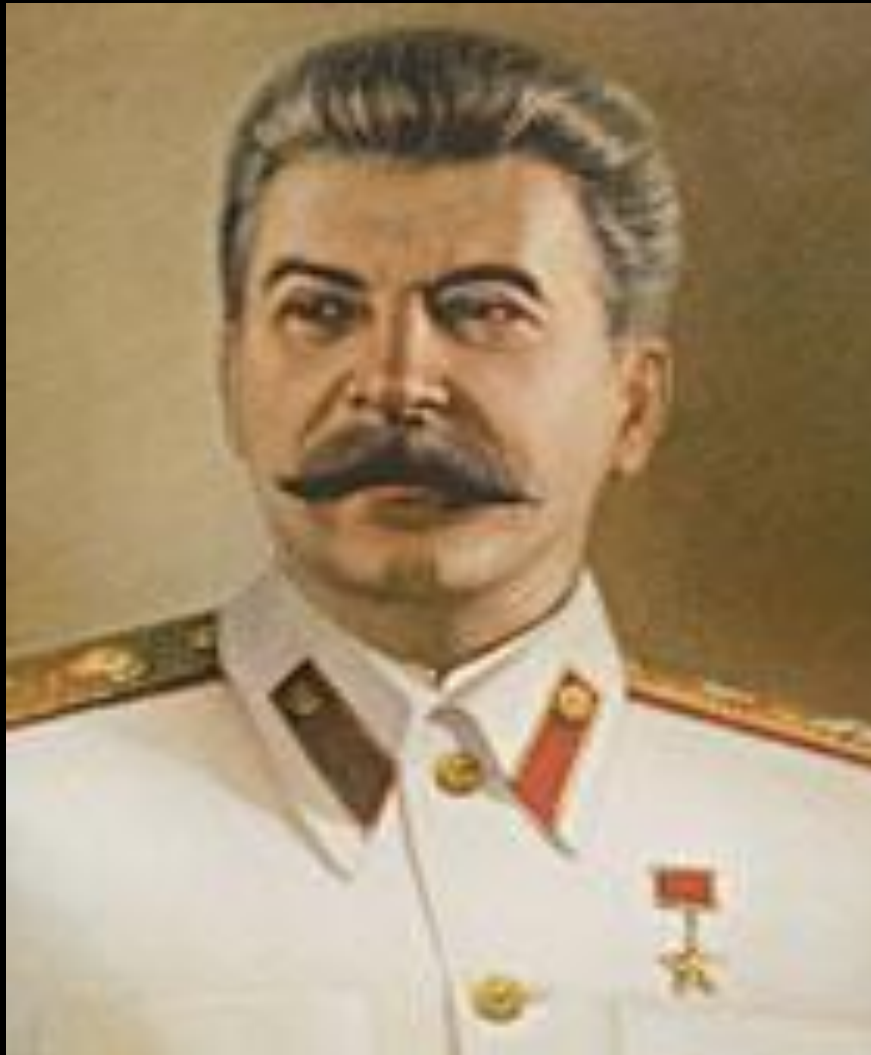
И. В. Сталин