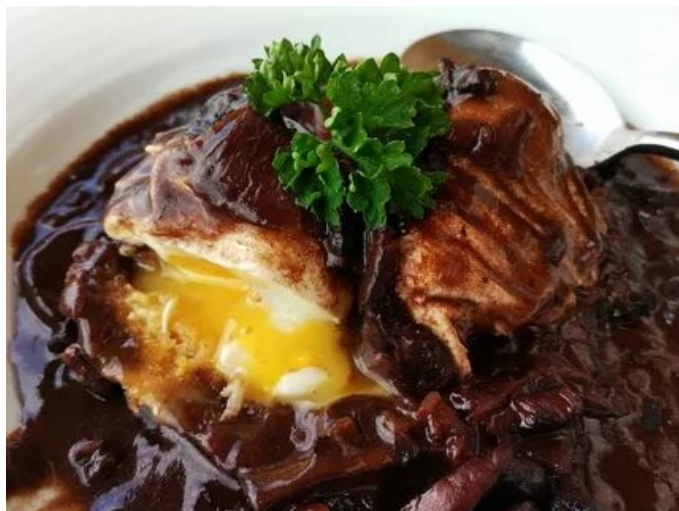
oeufs en meurette