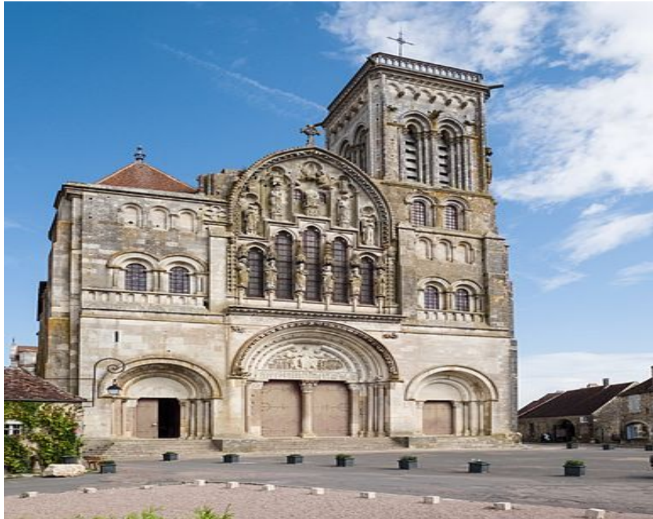
Abbaye de Fontenay