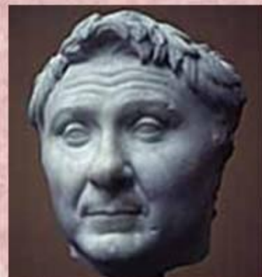
Гней Помпей Великий

Около 6 тысяч восставших рабов бежали из Апулии после понесенного поражения в Северную Италию. Но там они были встречены и уничтожены испанскими легионами Гнея Помпея, который как ни торопился, но так и не успел к решающему сражению. Поэтому все лавры победителя Спартака и спасения Древнего Рима достались Марку Крассу.