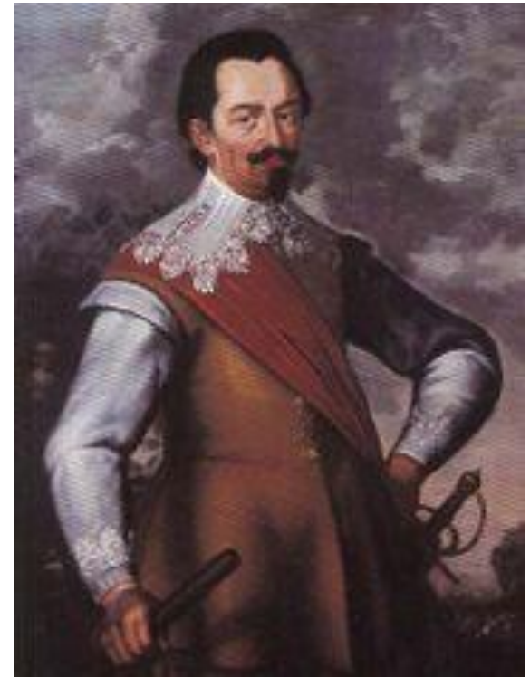
Альбрехт фон Валленштейн