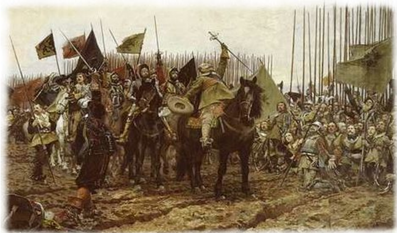
Победа Густава II в битве при Брейтенфельде (1631г.)