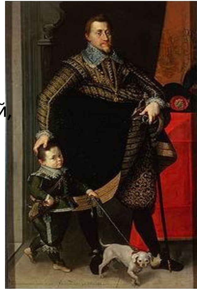
Фердинанд II Габсбург