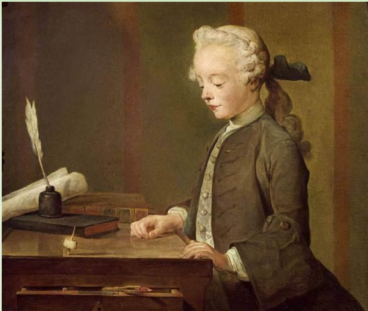
Ж-Б Шарден. Мальчик с юлой.

Меняется отношение к образованию. Под влиянием научной революции мир перестает восприниматься как опасный и непредсказуемый. Познавая его законы люди учатся его менять. Возникает идея, что точно также можно и нужно изменять человека. Появляется литература, посвященная воспитанию. Открываются учебные заведения.