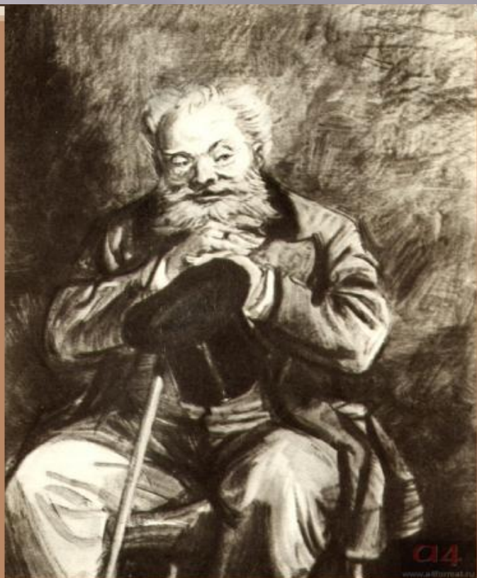
Аркадий Иванович Свидригайлов