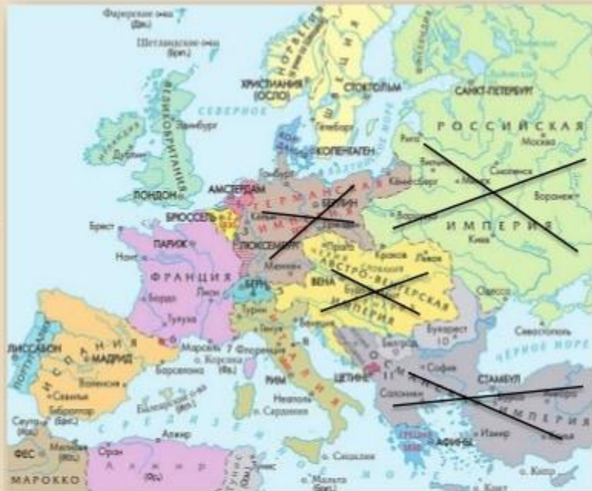
Крушение европейских империй в ходе Первой мировой войны

Распространение в Германии идей нацизма на почве экономических трудностей и реваншистских настроений