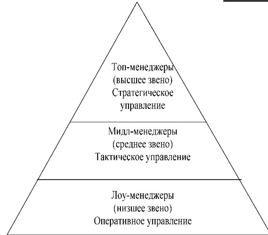
Рис. 1. Уровни управления