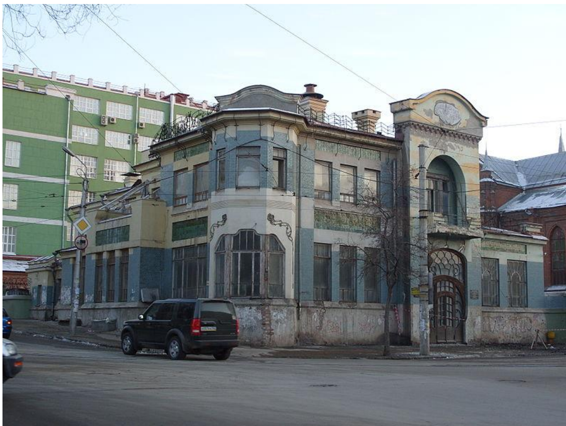
Особняк Курлиной в Самаре, построенный в 1903 году