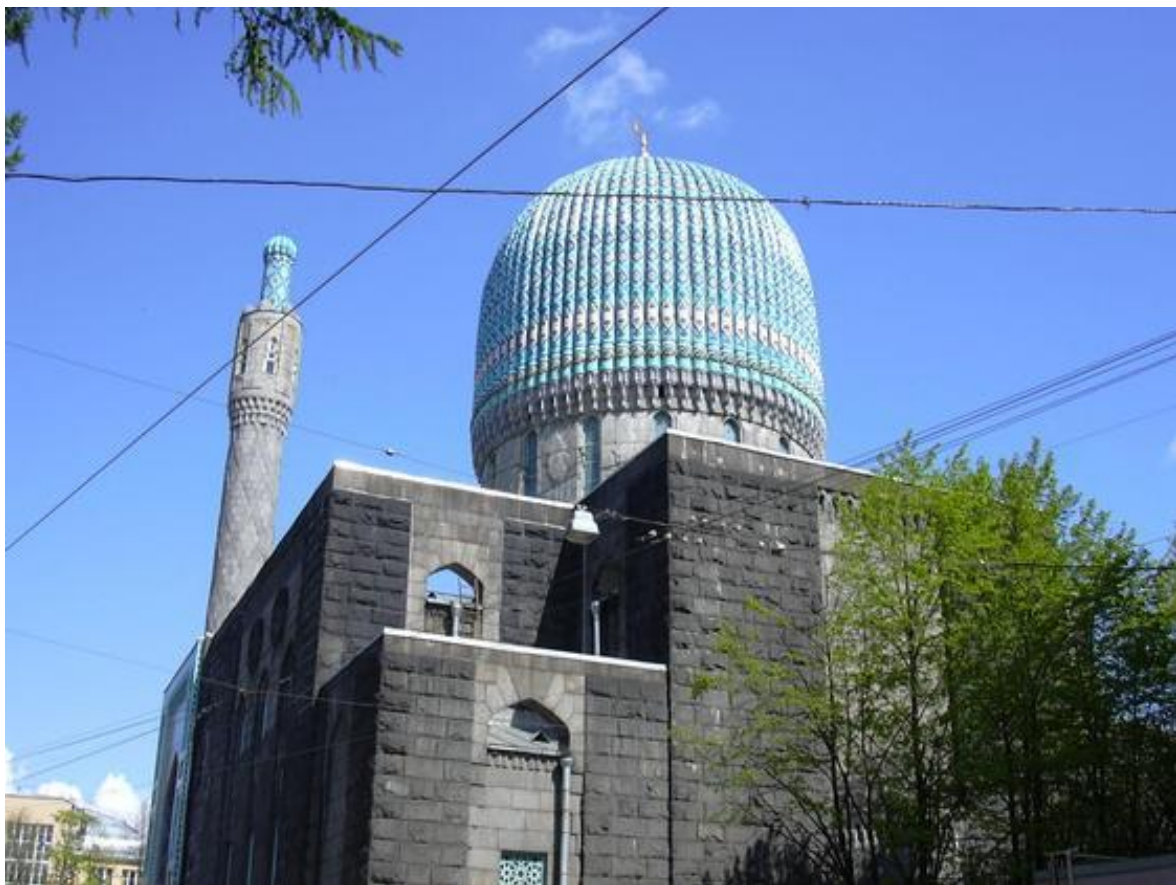
Санкт-Петербургская соборная и кафедральная мечеть