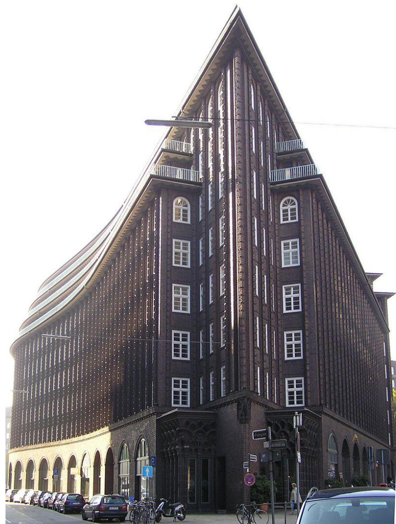
Чилхаус в Гамбурге. Германия