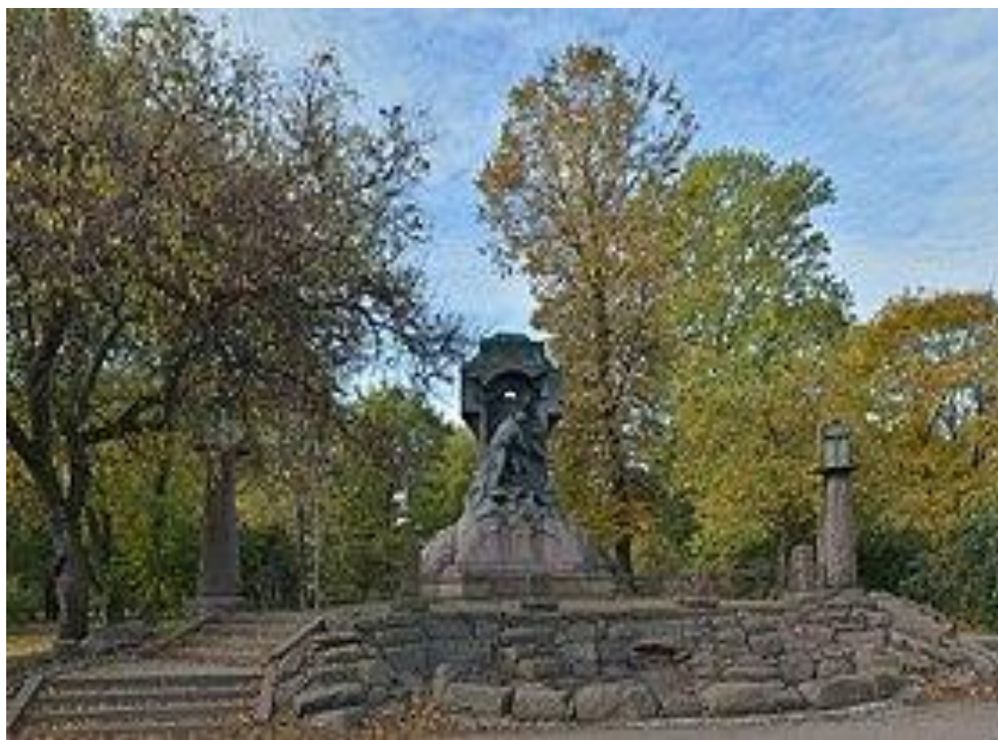
Памятник «Стережущему» в Александровском парке