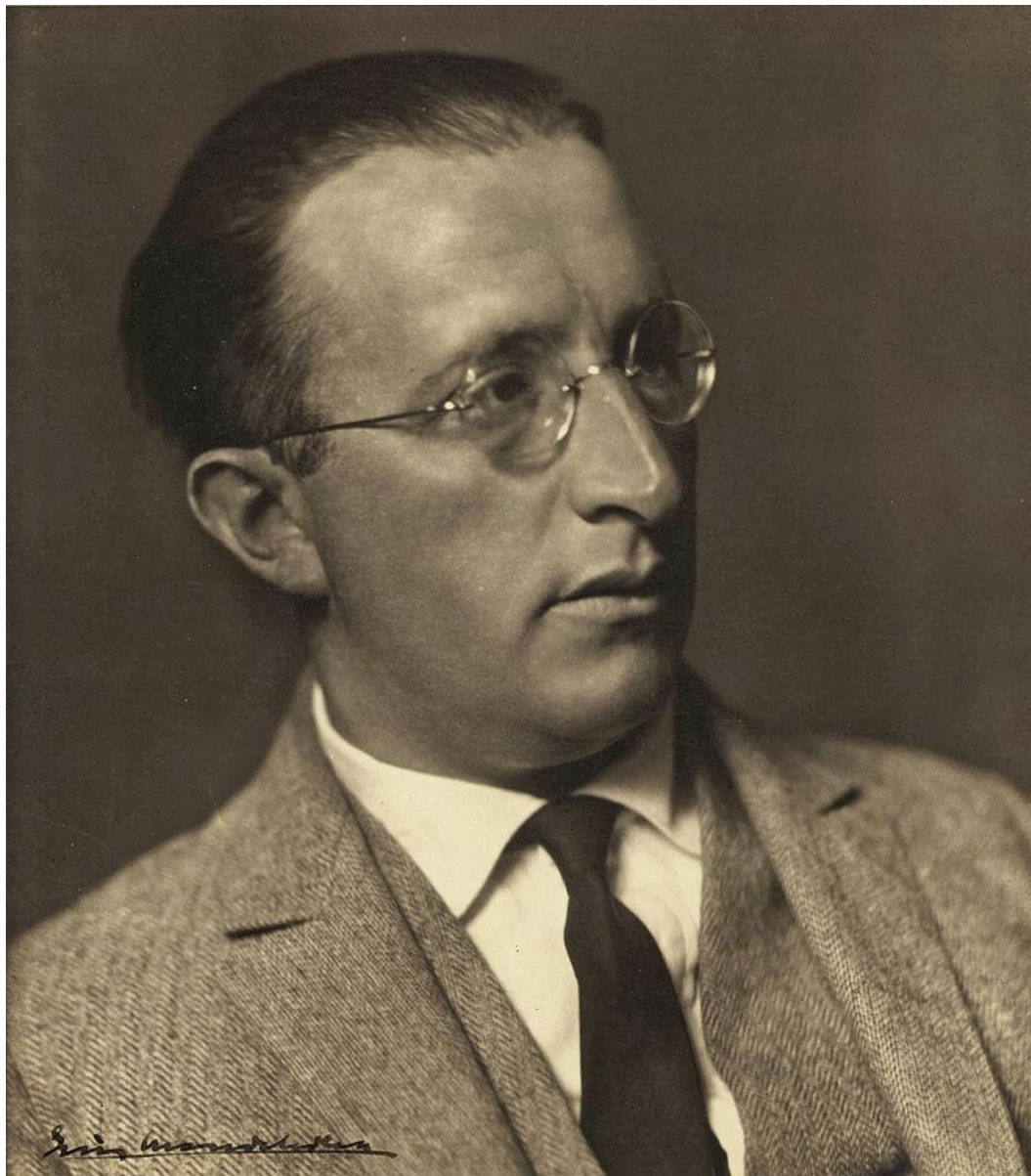
Эрих Мендельсон (21 марта 1887 — 15 сентября 1953)