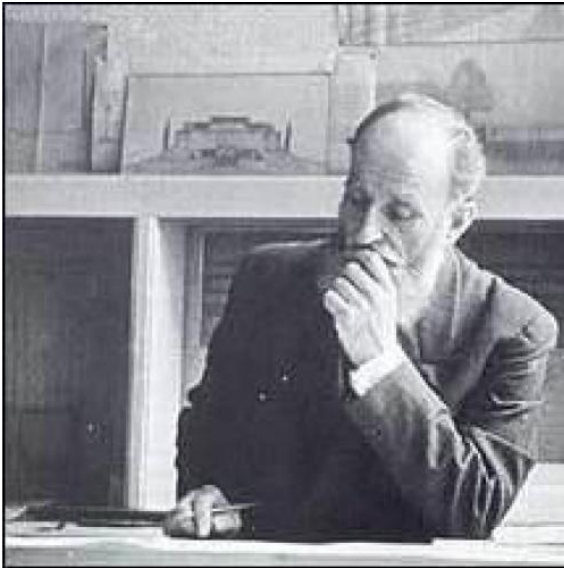
Пит Крамер (1 июля 1881 — 4 февраля 1961)