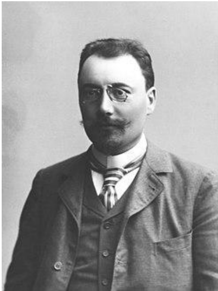
Ларс Сонк (10 августа 1870 — 14 марта 1956)