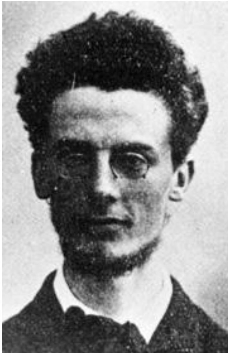
Йохан ван дер Мей (19 августа 1878 — 6 июня 1949)