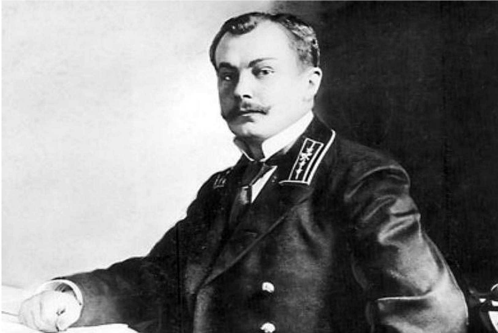
Алексей Федорович Бубырь (16 марта 1876 — 1919)