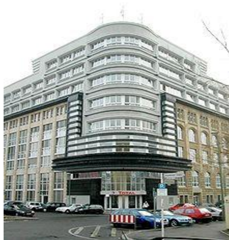
Дом Моссе в Берлине