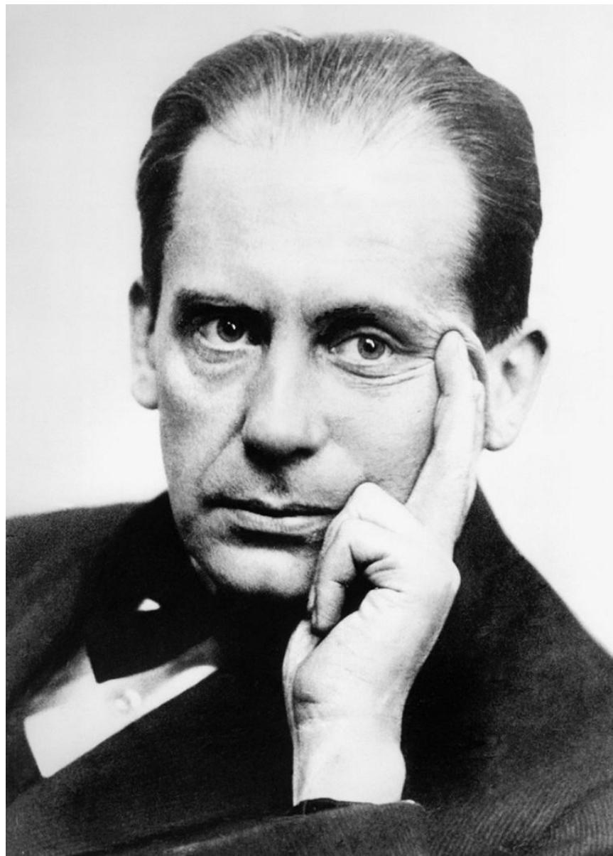
Гропиус Вальтер (18 мая 1883— 5 июля 1969)