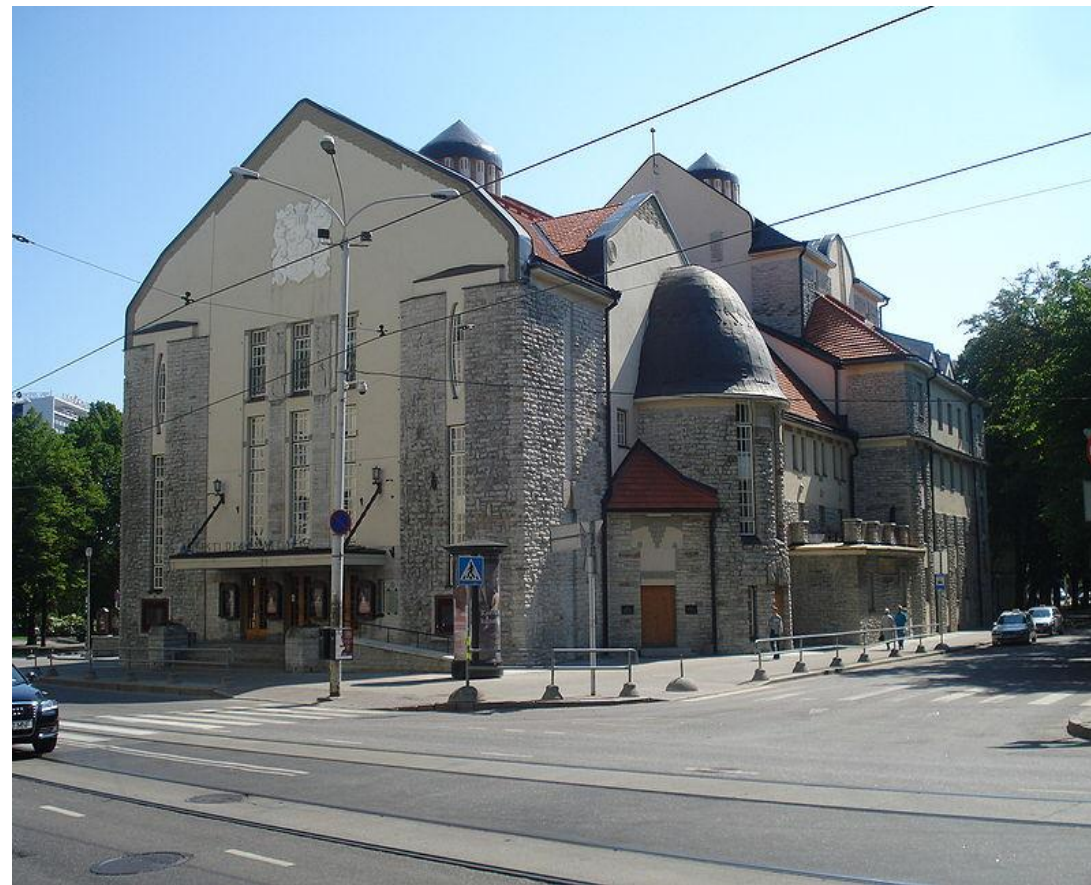
Немецкий театр в Таллине