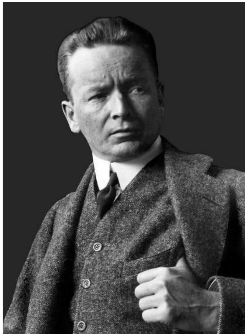
Элиель Сааринен (20 августа 1873, Рантасалми — 1 июля 1950)