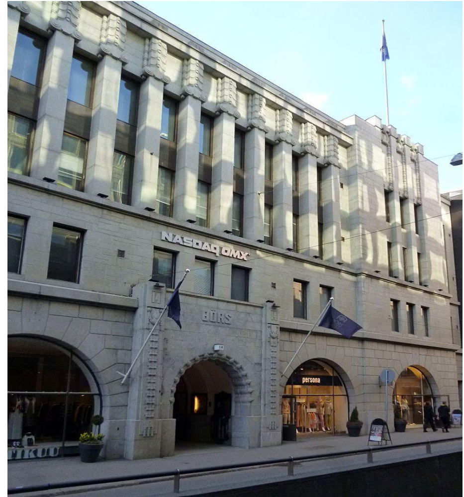
Фондовая биржа в Хельсинки. Работа Ларса Сонка