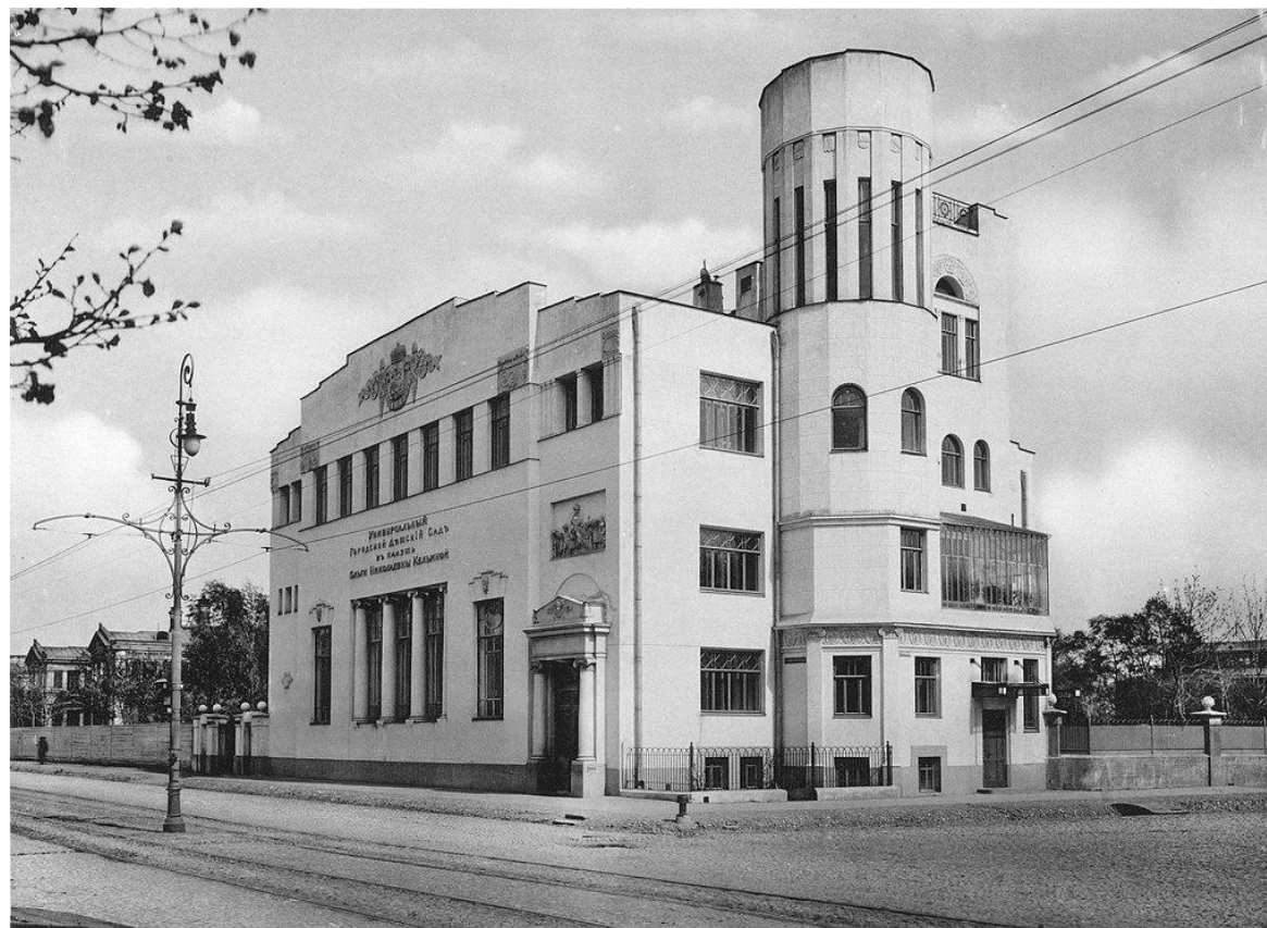
Детский сад на Большой Пироговской, 1910-1912, перестроен