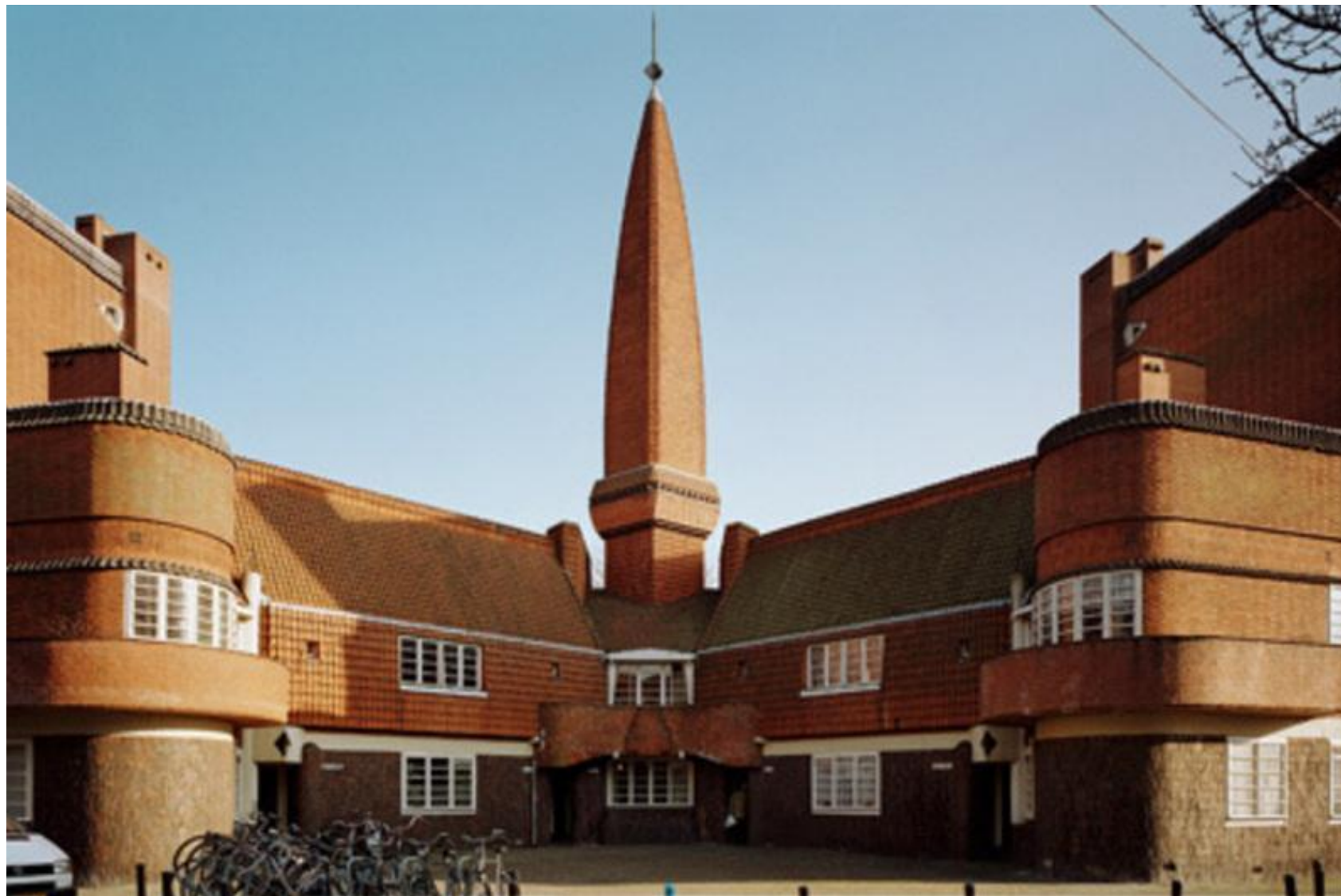
Комплекс «Корабль». Амстердам