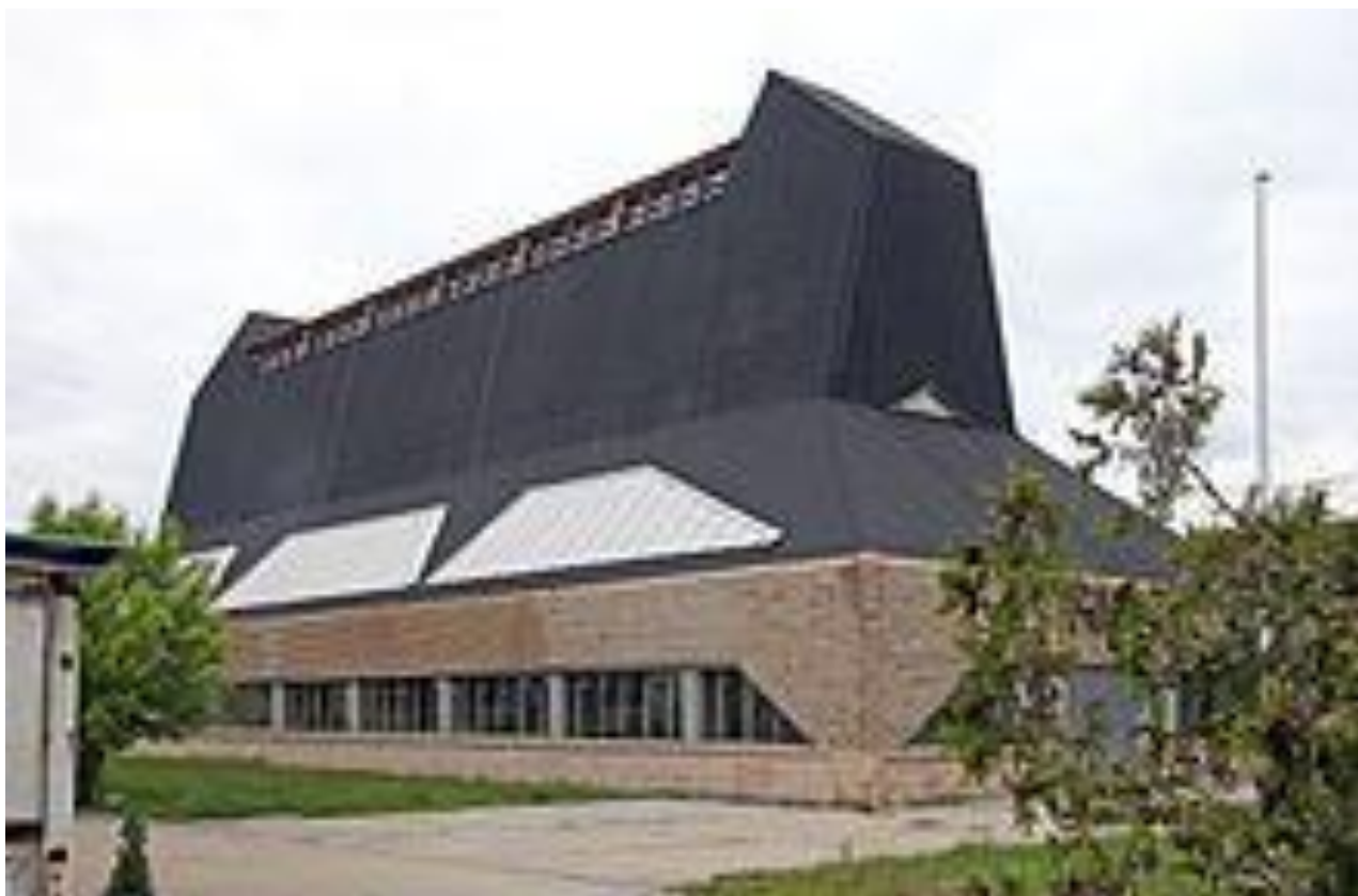
Шляпная фабрика в Луккенвальде