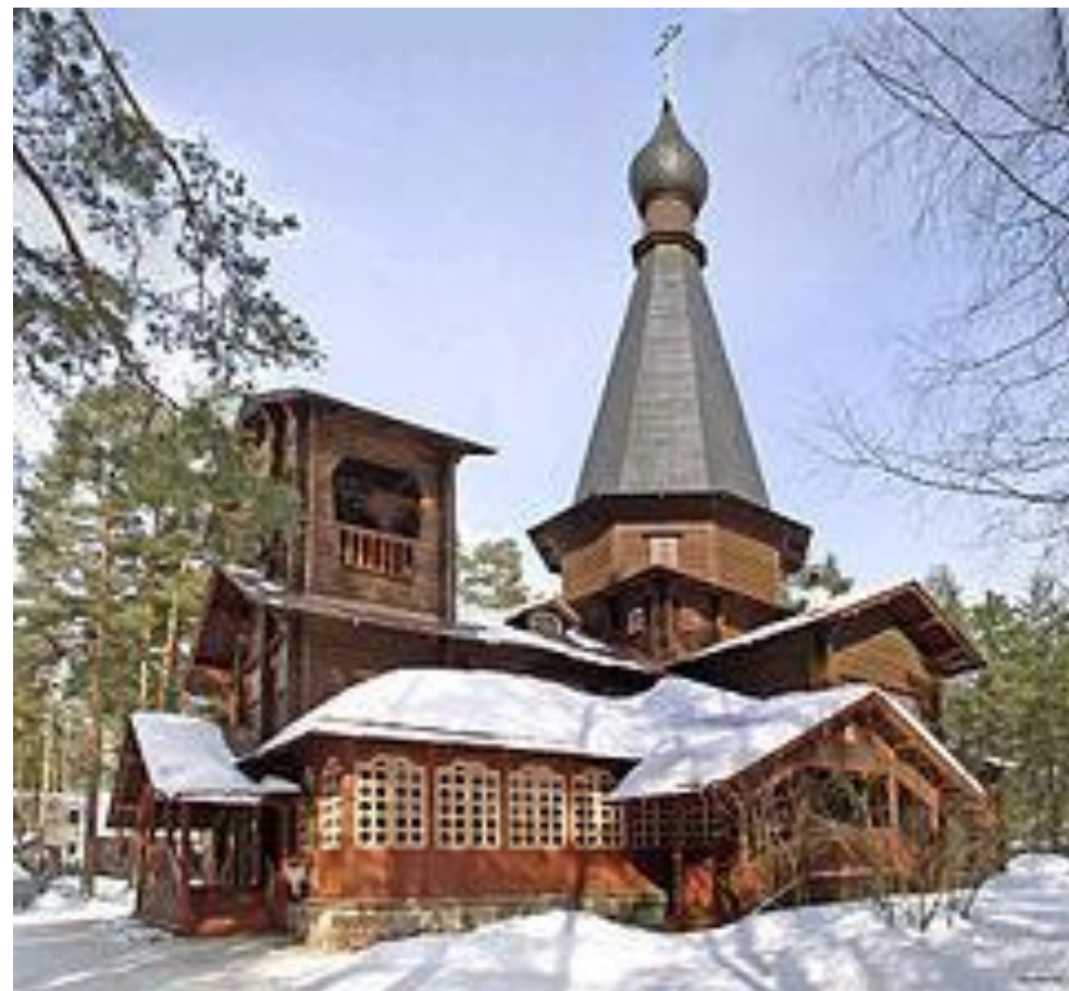
Церковь иконы Казанской Божией Матери в Вырице