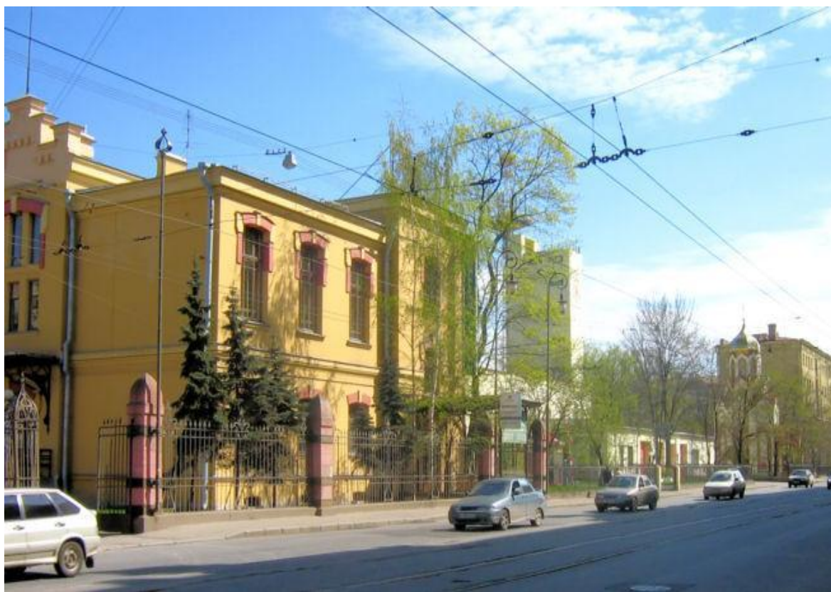
Вид Лесного проспекта (Народный дом Эммануила Нобеля, пожарная каланча и часовня мемориала пожарной части)