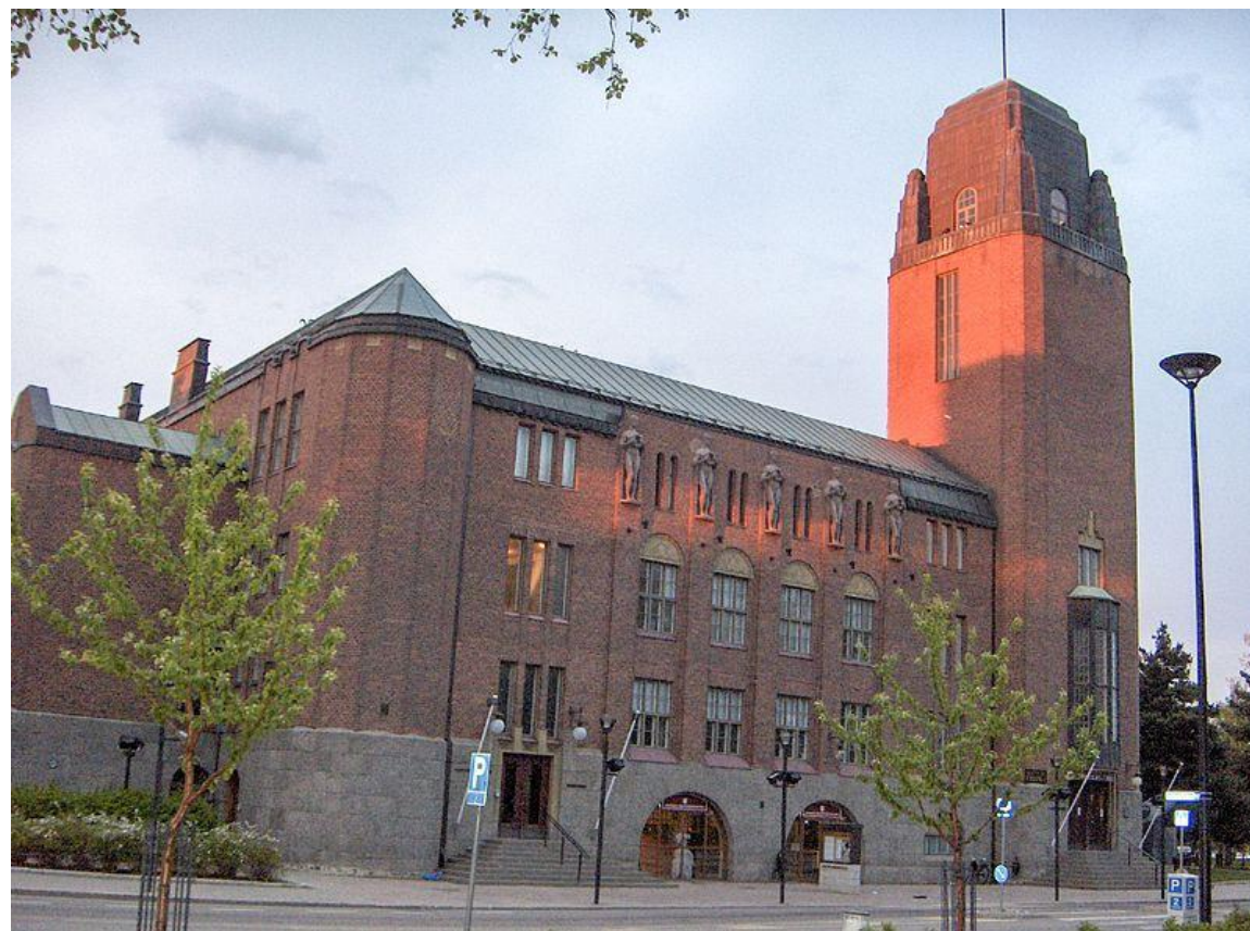
Ратуша в Йоэнсу. Работа Элиеля Сааринена