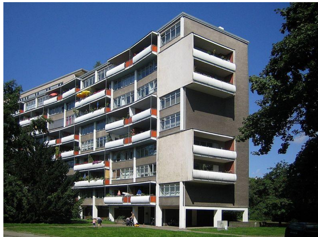
Жилой дом в Ганзафиртель, 1950-е ГОДЫ