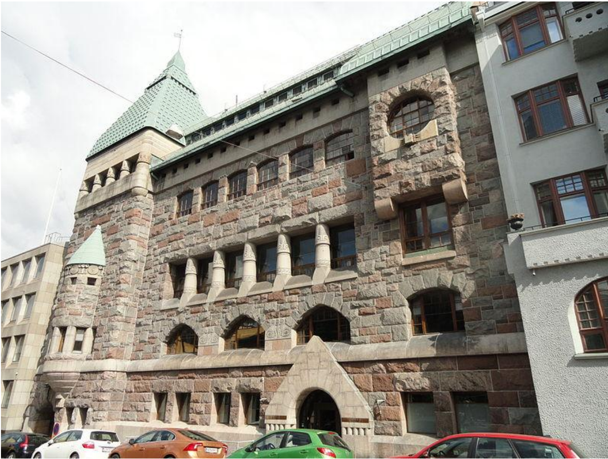
Штаб-квартира Хельсинкской телефонной ассоциации. Работа Ларса Сонка