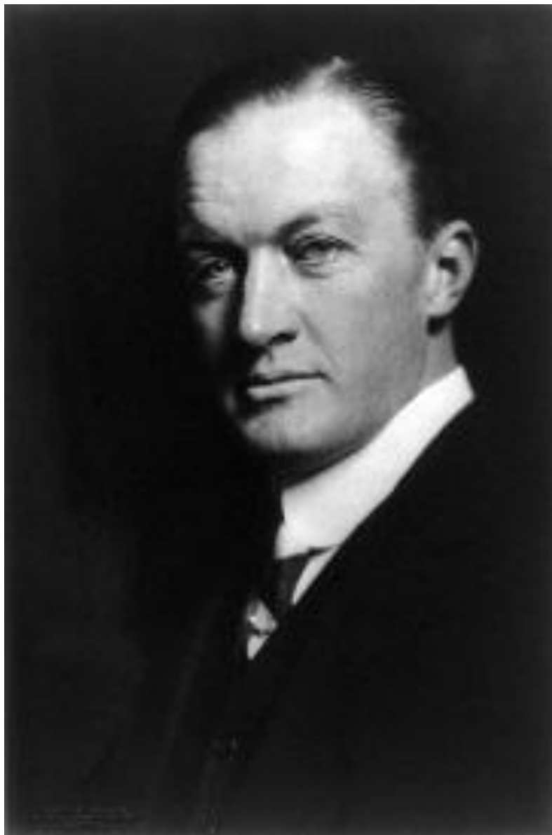
Джон Рассел Поуп (24 апреля 1874 — 27 августа 1937)