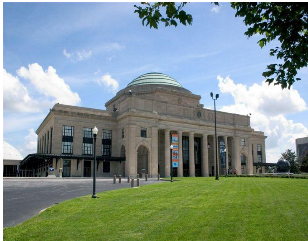
Станция «Союзная» в Ричмонде. США