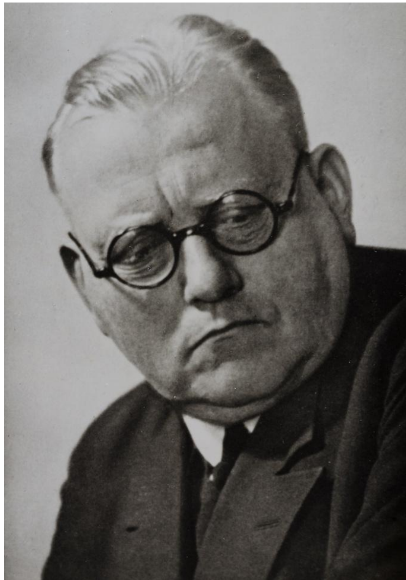
Йохан Фридрих Хегер (12 июня 1877 – 21 июня 1949)