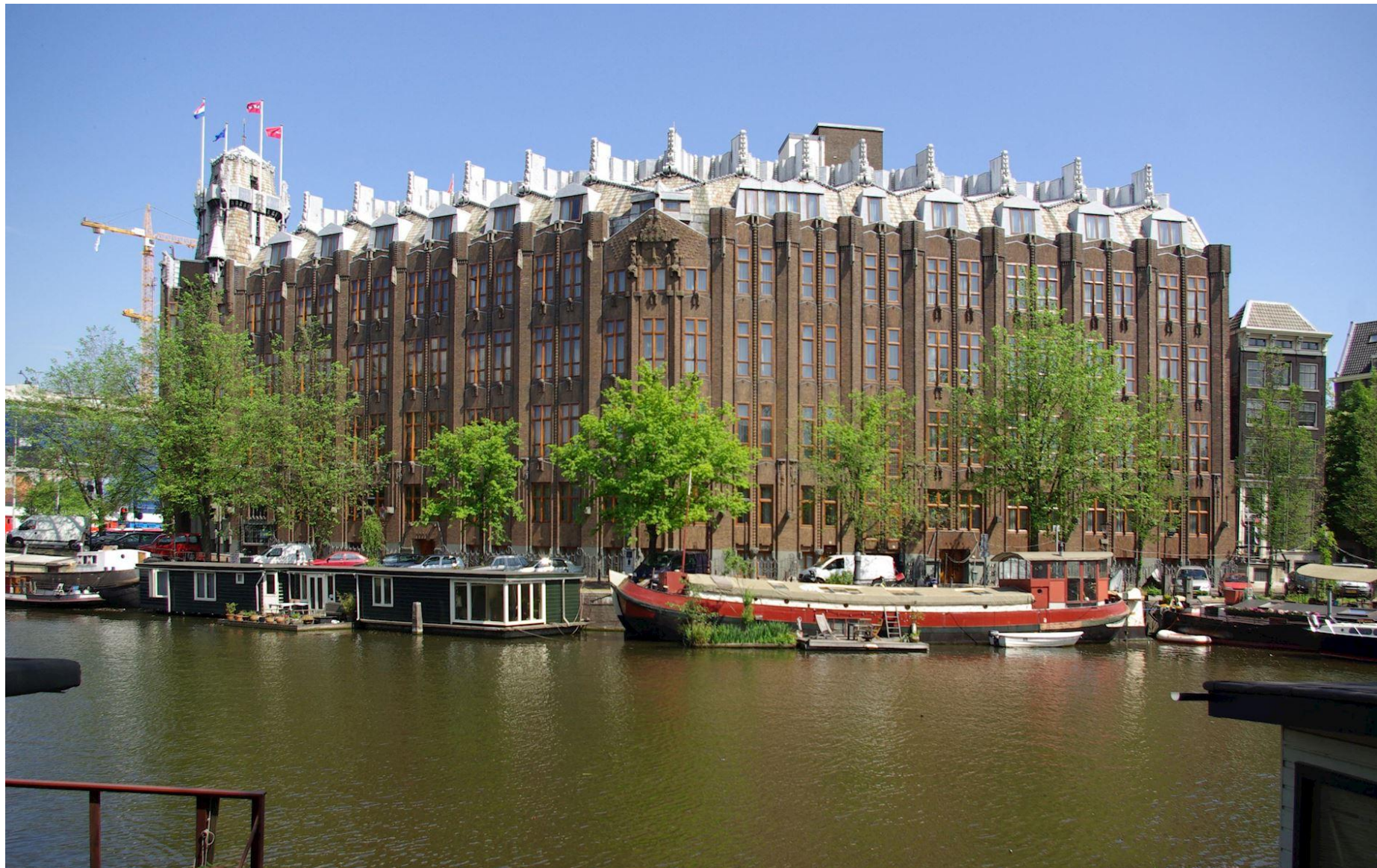
Дом судоходства в Амстердаме