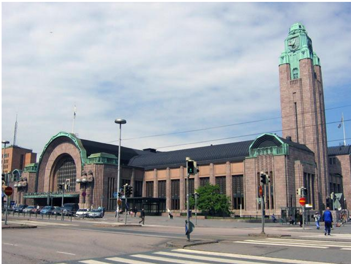
Здание вокзала в Хельсинки. Работа Элиеля Сааринена