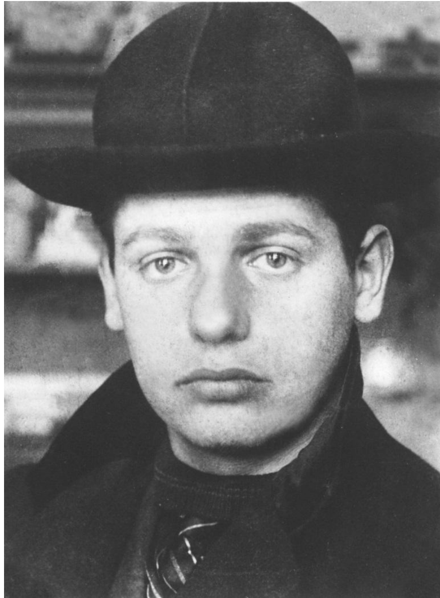
Мишель де Клерк (24 ноября 1884— 24 ноября 1923)