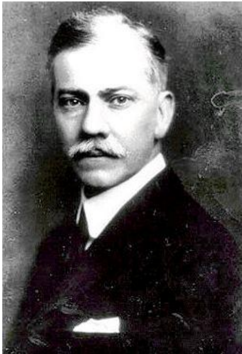
Генри Бэкон (1866–1924)