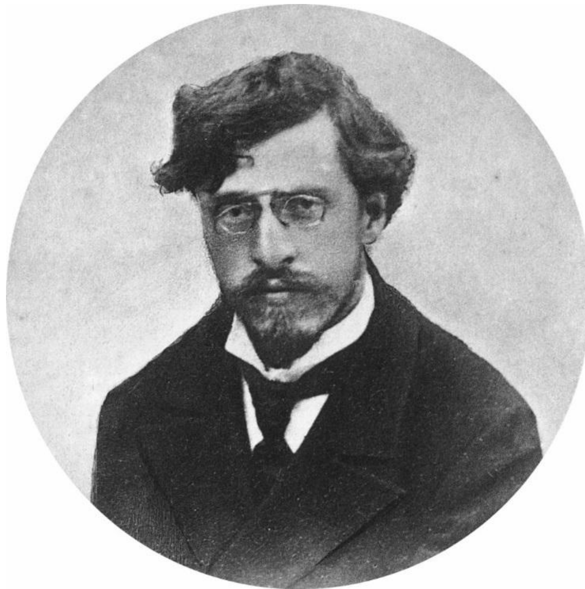
Александр Устинович Зеленко (11 октября 1871—21 июля 1953)