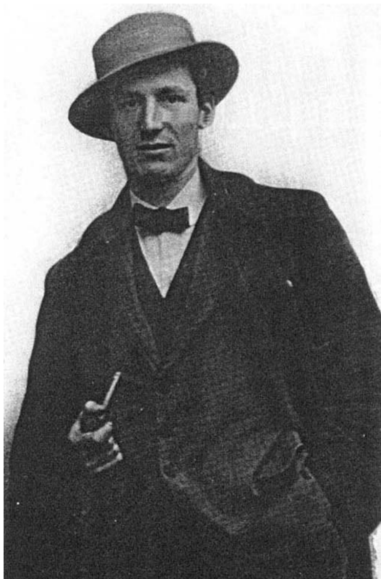
Антонио Сант'Элиа (30 апреля 1888 — 10 октября 1916)