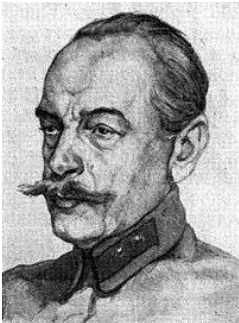
Владимир Петрович Апышков (23 января 1871, Москва — 13 мая 1939)