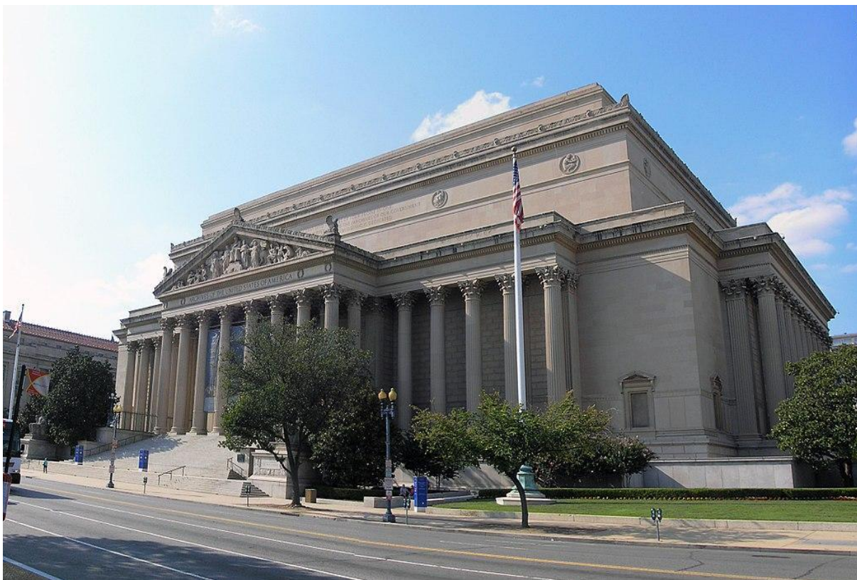
Национальный архив США