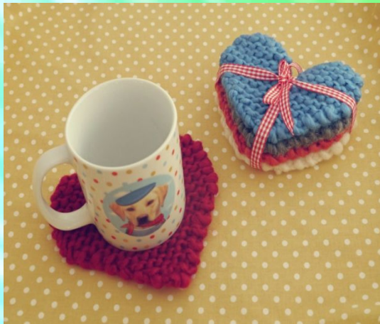
Идея №1 Подставки в форме сердечка

Обоснование проблемы «Подставка под кружку» - это не только практичный аксессуар и приятный элемент декора. А если набор подставок связать самостоятельно, то он превратится в отличный подарок для дома»