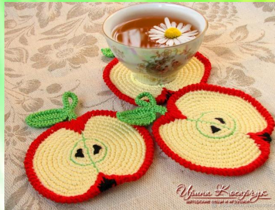
Идея № 2