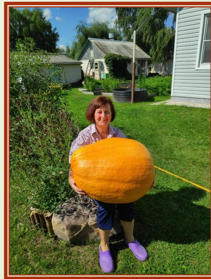
Тыква 29 кг

Тыква выросла на грядке — Не поднимете, ребятки! Если ягода она, То, наверно, для слона