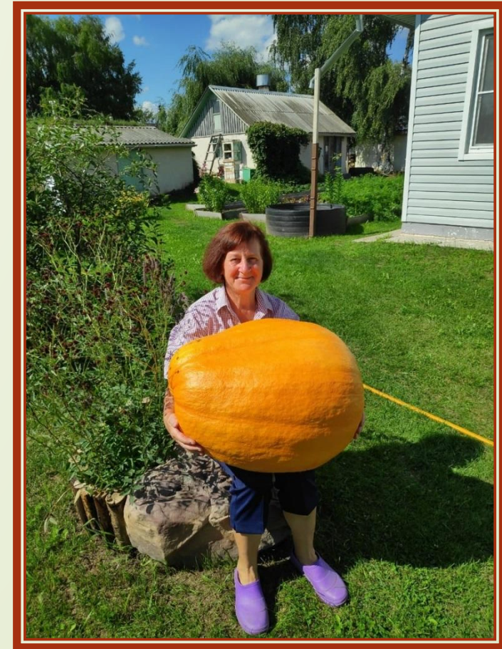
Тыква 29 кг

Тыква выросла на грядке — Не поднимете, ребятки! Если ягода она, То, наверно, для слона