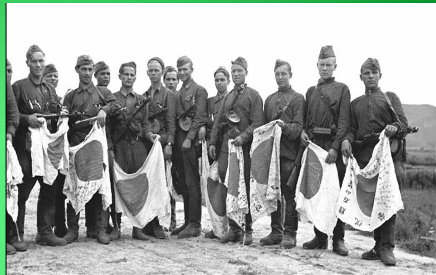
Самурайские флаги в руках советских бойцов. р.Сунгари. Август 1945 г.

Солдаты японской армии сдают оружие. 2-й Дальневосточный фронт. 28 августа 1945 г.