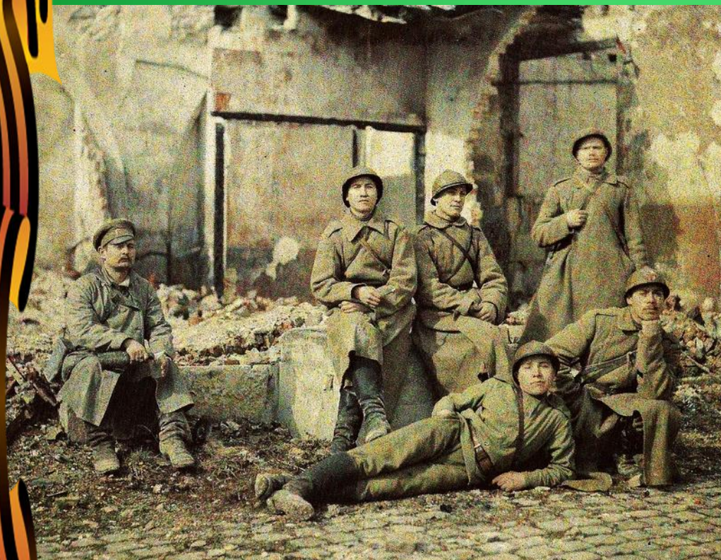
Русские солдаты в Реймсе. 1917