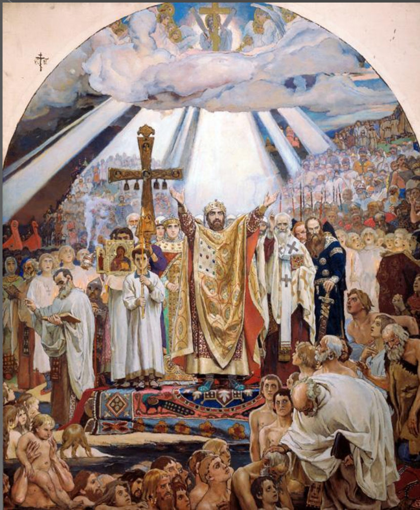
«Крещение Руси» 1895-1896 гг.