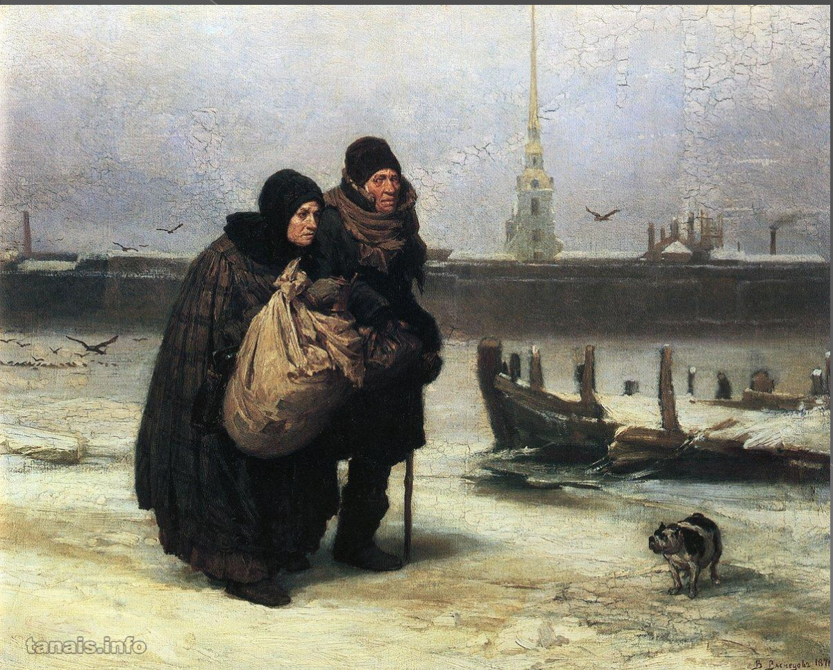
«С квартиры на квартиру» 1876 г.