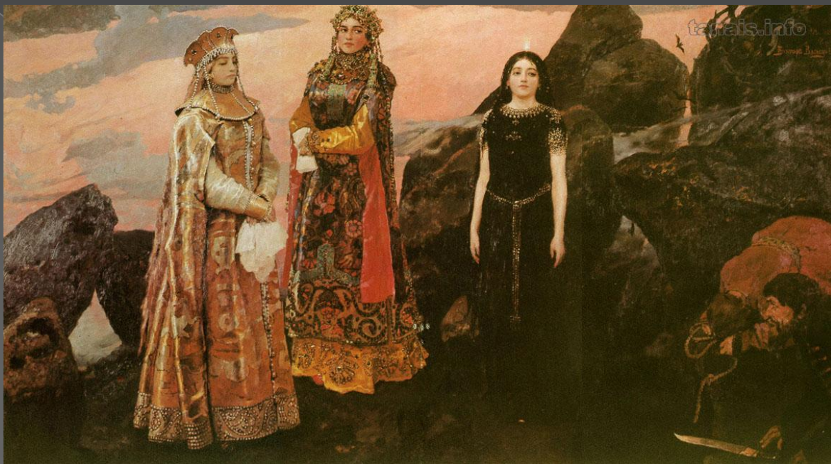
«Три царевны подземного царства» 1880-1881 гг.