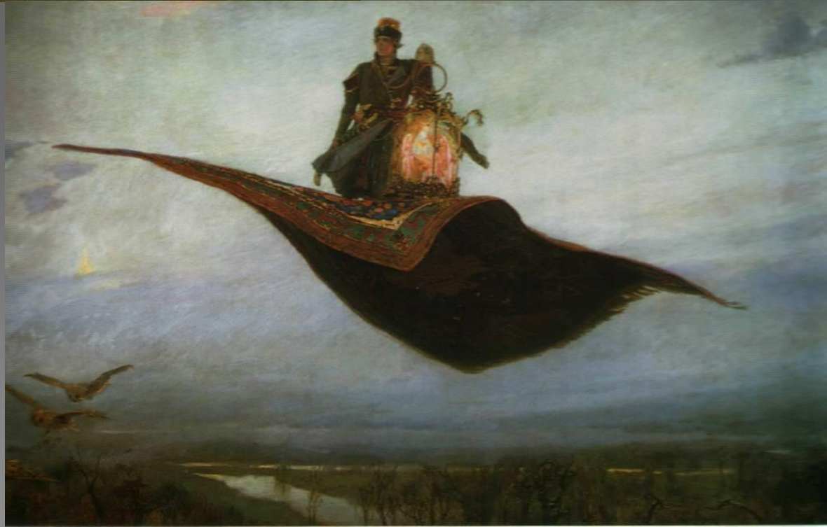
«Ковёр-самолёт» 1880 г.