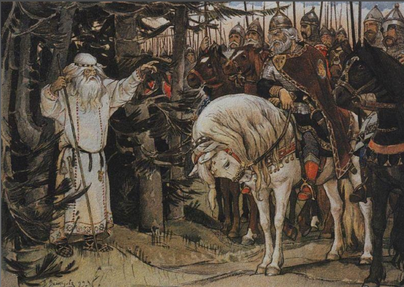
«Встреча Олега с кудесником» 1899 г.