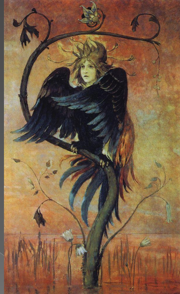
«Иван-царевич на Сером Волке» 1889г. «Гамаюн, птица вещая», 1895 г.