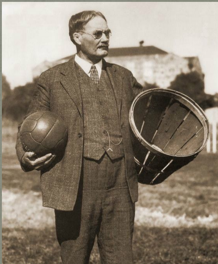
Джеймс Нейсмит (1861-1939)

Изобрел баскетбол Джеймс Нейсмит (1861-1939), преподаватель колледжа в Спрингфилде (шт. Массачусетс, США). Колледж принадлежал Ассоциации молодых христиан. Позднее студенческим баскетболом в США стала руководить Национальная атлетическая ассоциация колледжей -NCAA. Через нее получили путевку в профессиональные клубы NBA практически все звезды американского баскетбола.