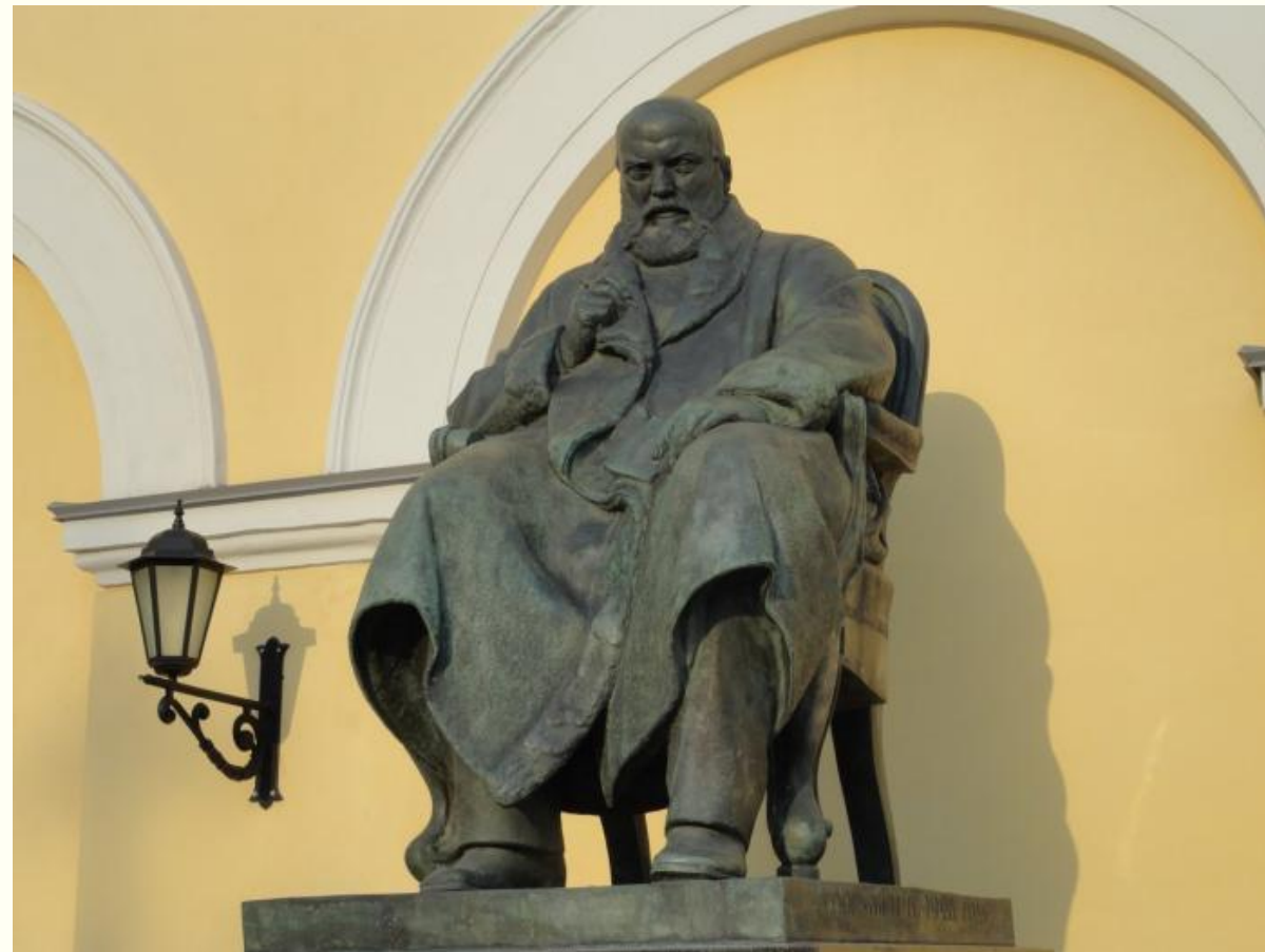
Памятник драматургу Александру Николаевичу Островскому

Малый театр называют "Домом Островского". Театр до Островского переживал тяжелое время - Не ставились хорошие, настоящие пьесы. Сцену заполнили пустячки вроде: "Муж в Тверь, жена в дверь", "Барышня-гусар", бесконечные водевили. Публику развлекали самым дешевым и простым способом. Нужен был драматург, который помог бы вернуть театру нравственное содержание, ведь именно драматургия – основа театра.